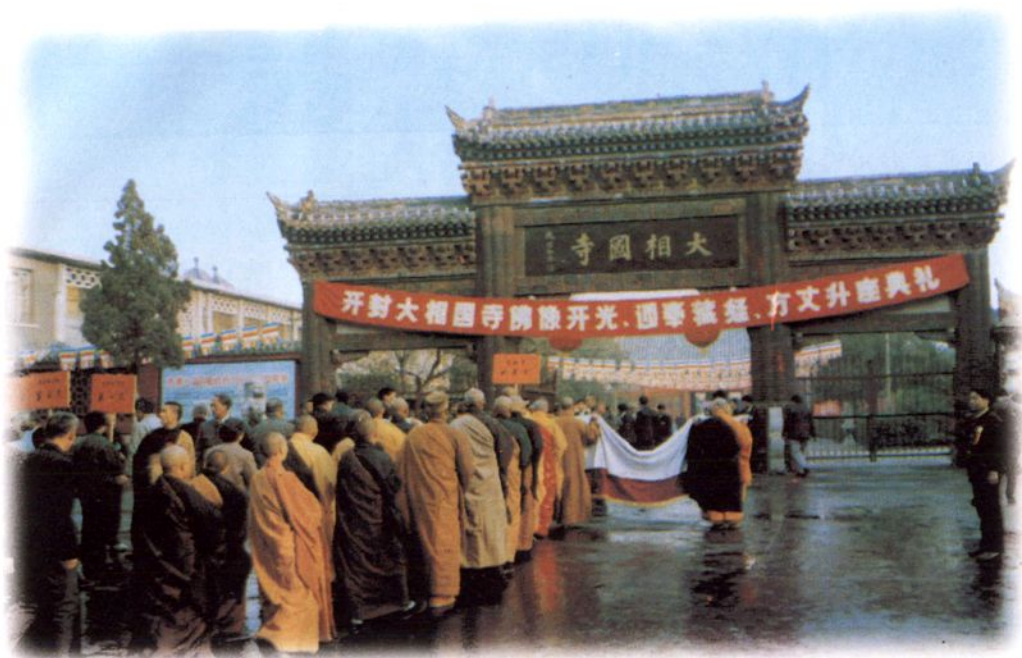
全国著名佛教寺院 —— 开封大相国寺