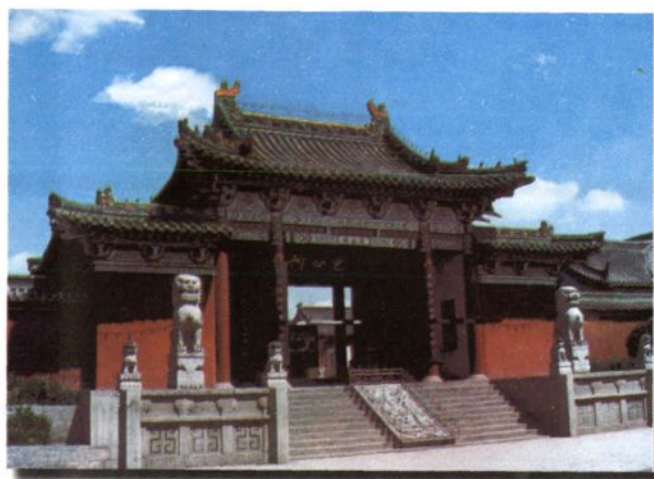
座落于包公湖畔的包公祠