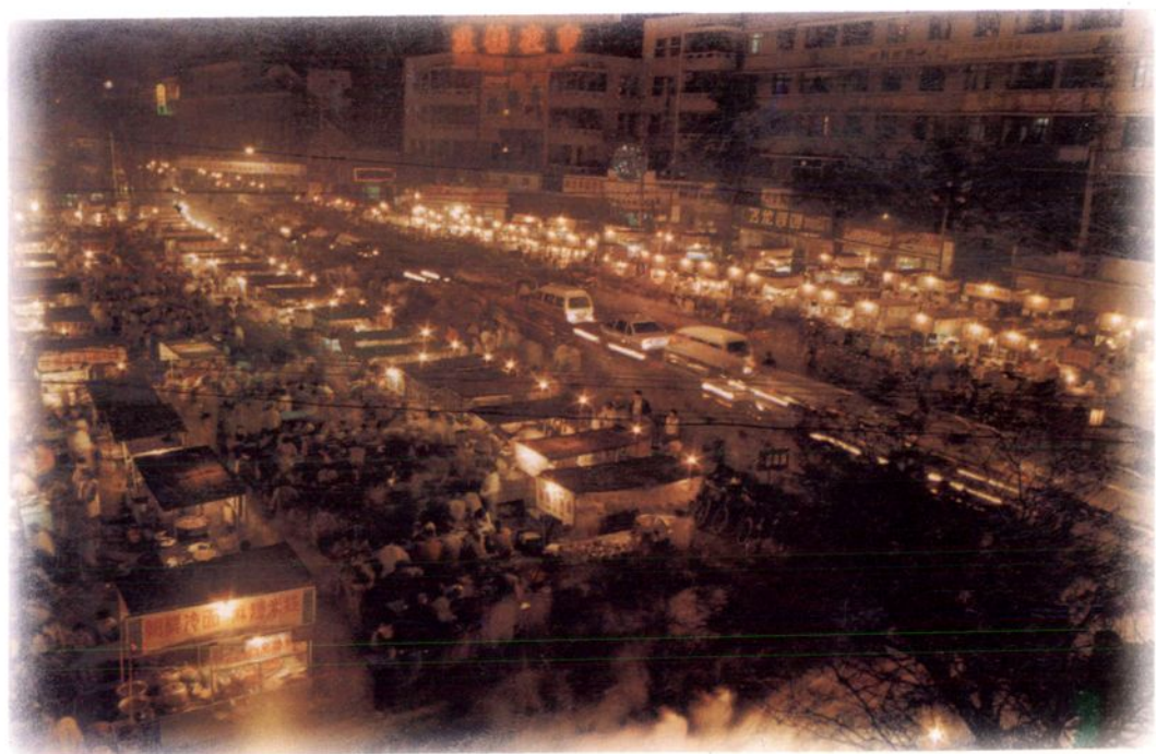
今日开封鼓楼广场夜市一瞥