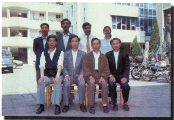
《开封市鼓楼区志》工作人员合影