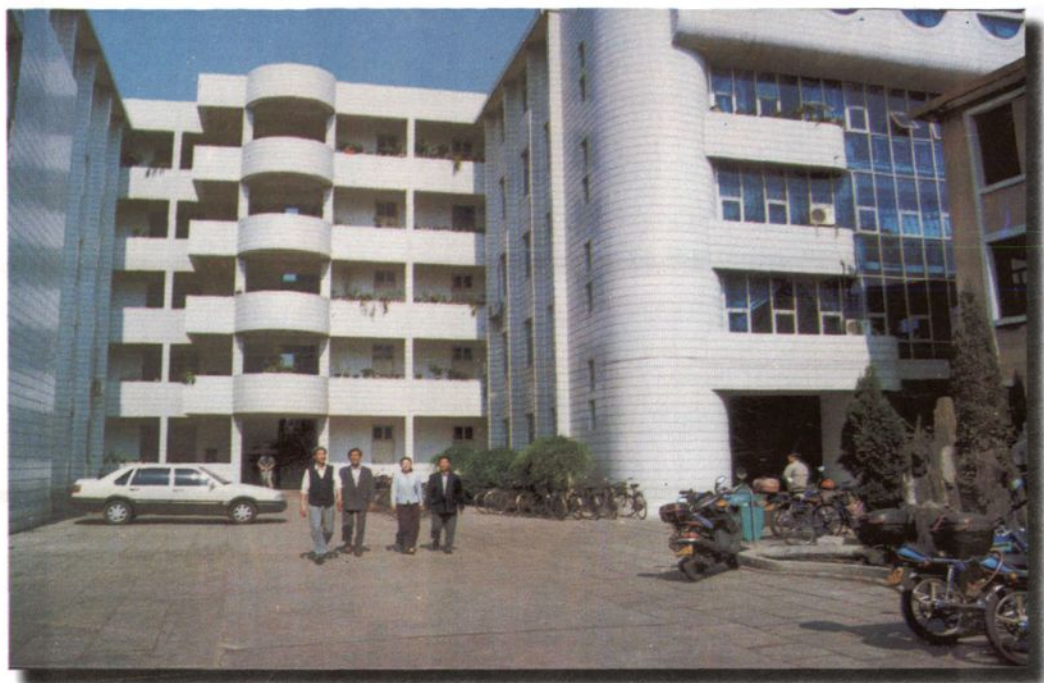
鼓楼区机关办公楼