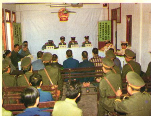
现场开庭(1989年广州北站)