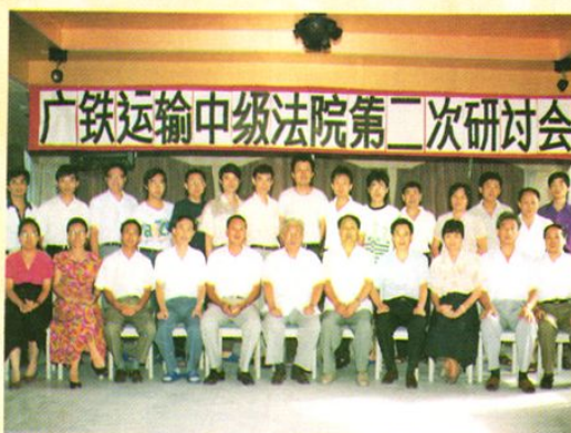
第二次审判工作研讨会与会人员合影