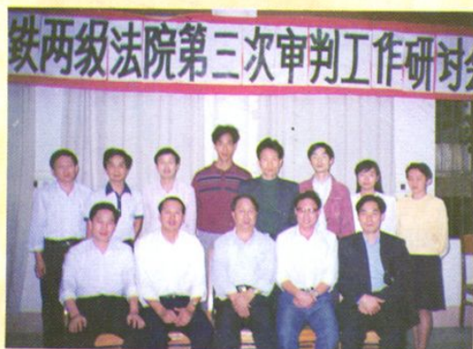
中级法院领导与第三次审判工作研讨会 获奖论文作者合影