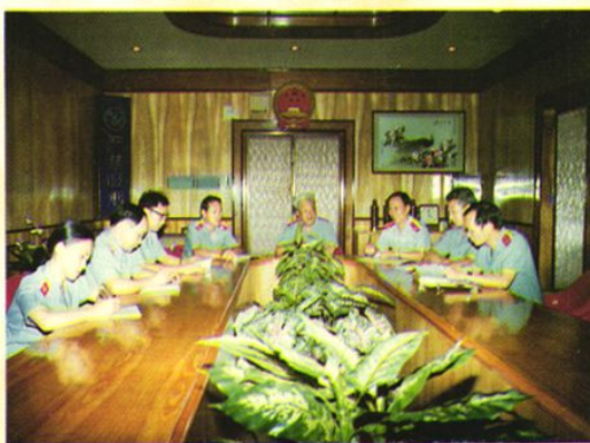
审判委员会讨论案件