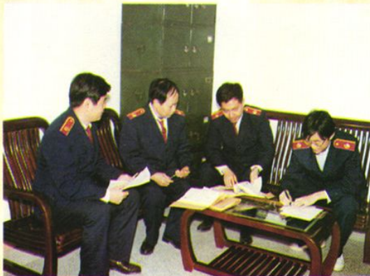
召开准备庭确定开庭有关事项