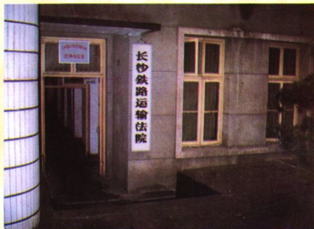
长沙铁路运输法院