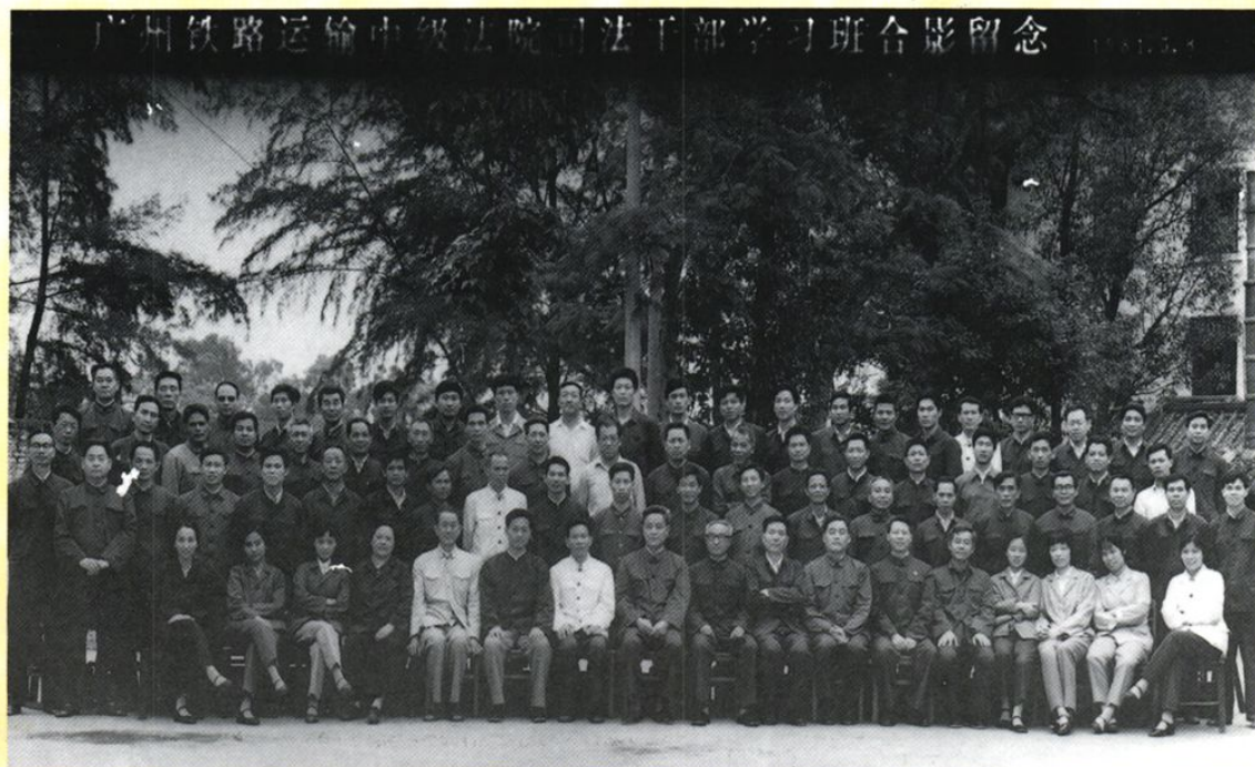
重新建院初期两级法院干警合影(1981年5月)