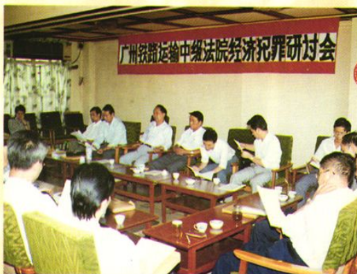
两级法院第一次审判工作研讨会会场