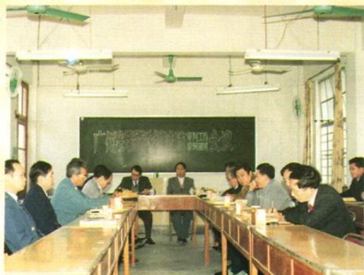
两级法院第四次审判工作研讨会会场