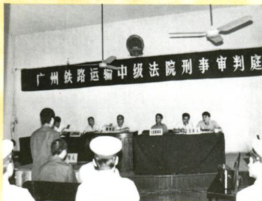
现场开庭(1983年长沙分局)