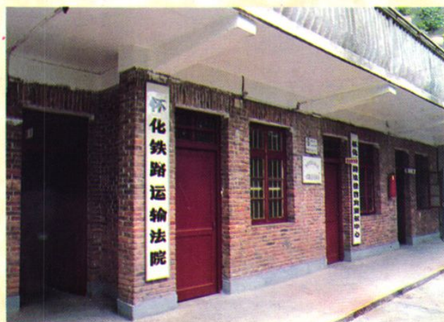
怀化铁路运输法院