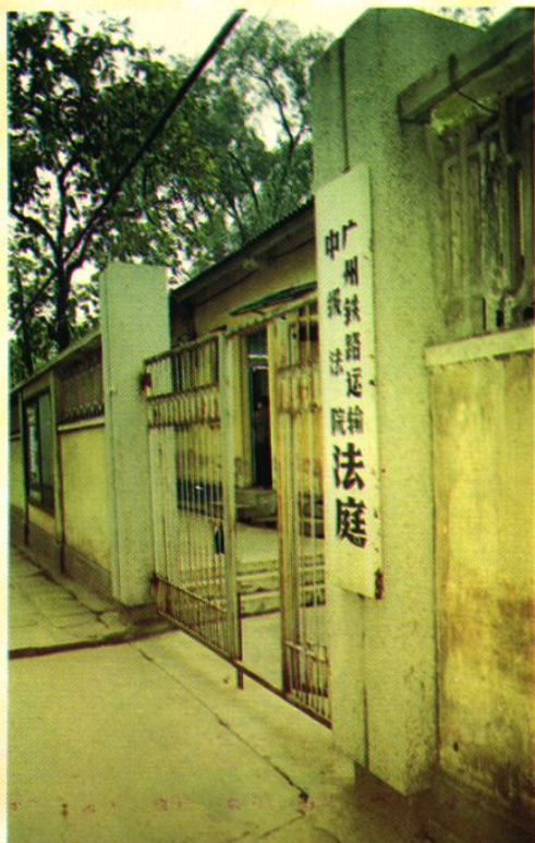
中级法院法庭(1985年至1993年3月)