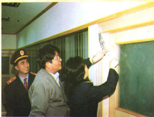
经济纠纷案件执行现场