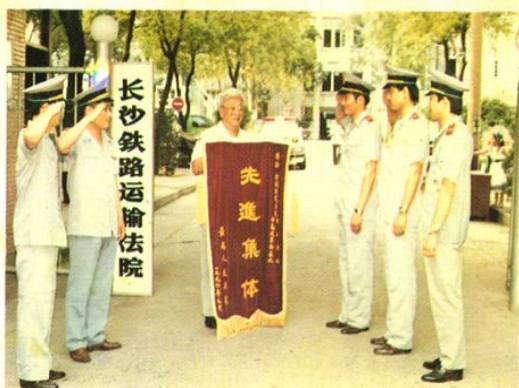
长沙法院荣获最高人民法院“全国法院系统制止动乱平息反革命暴乱先进集体”称号