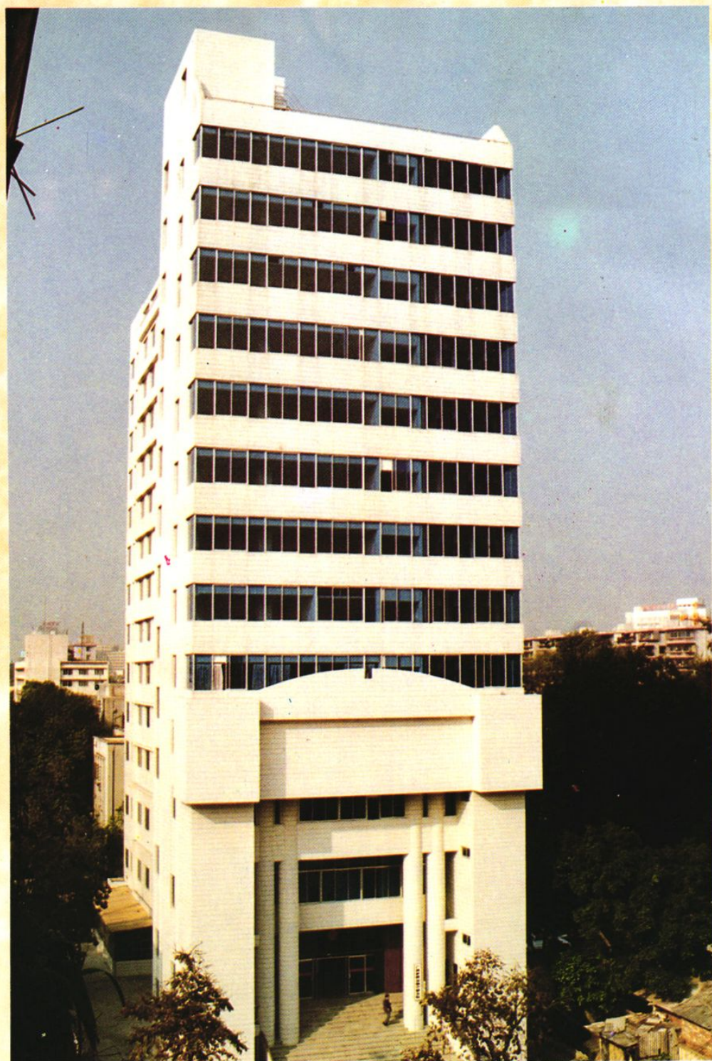
新落成的广州铁路运输中级法院办公大楼(1995年10月)