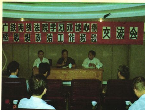
中级法院召开学习《邓小平文选》心得体会暨思想政治工作经验交流会