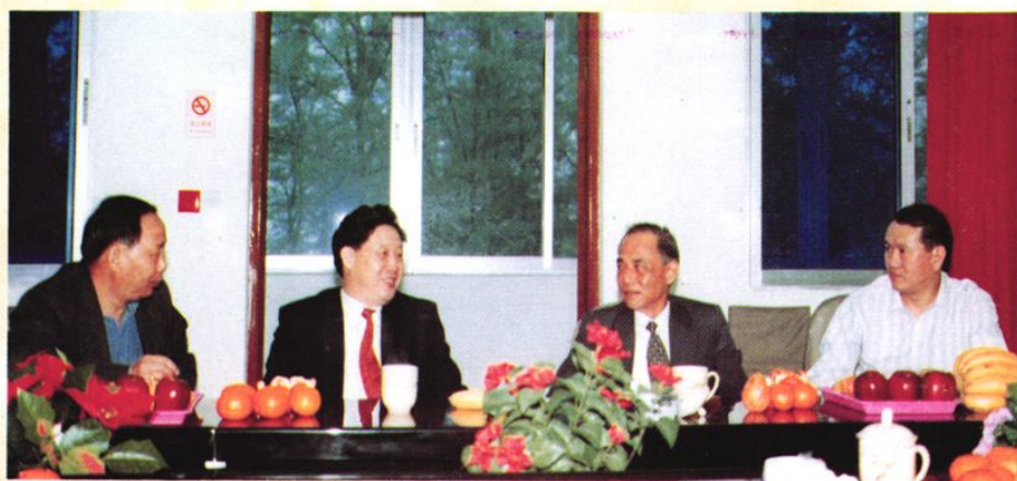
广东省高级人民法院院长麦崇楷(左三)与广州铁路(集团)公司董事长、党委书记、政法委书记江林洋(左二)到中级法院检查工作。