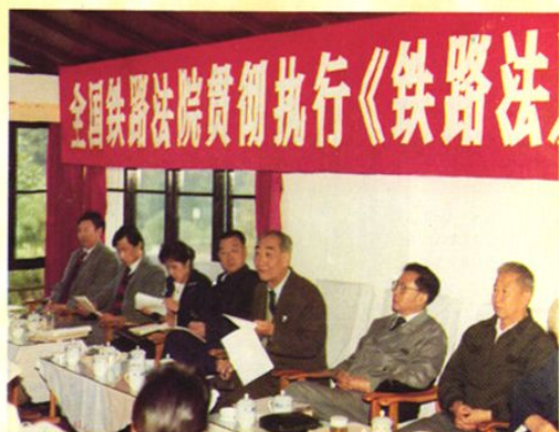
最高人民法院交通运输审判庭庭长李国堂在大庸全路法院贯彻《铁路法》研讨会上(1991.10)