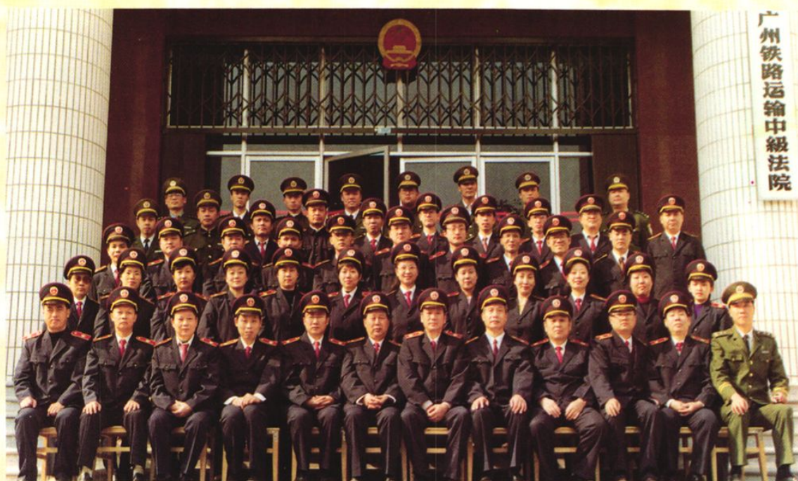
中级法院干警合影(1994年)