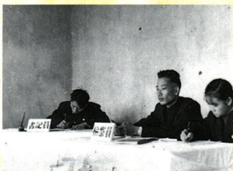
衡阳派出庭开庭剪影(1957年)