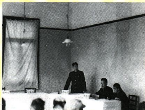
衡阳派出庭开庭剪影(1957年)