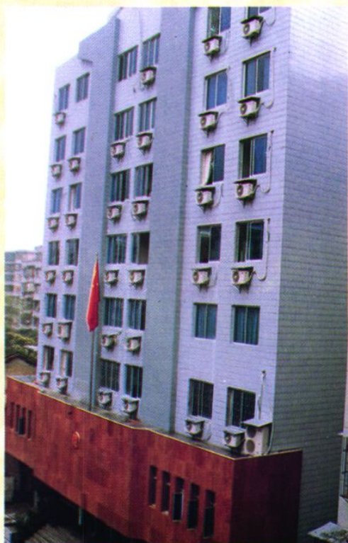
广州铁路运输法院