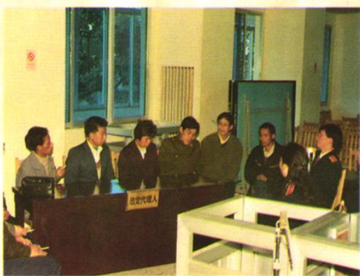
少年刑事审判庭与少年被告人家长座谈会