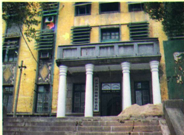
长沙铁路衡阳运输法院