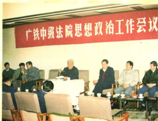
中级法院召开政治思想工作会议