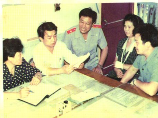
指导人民调解工作