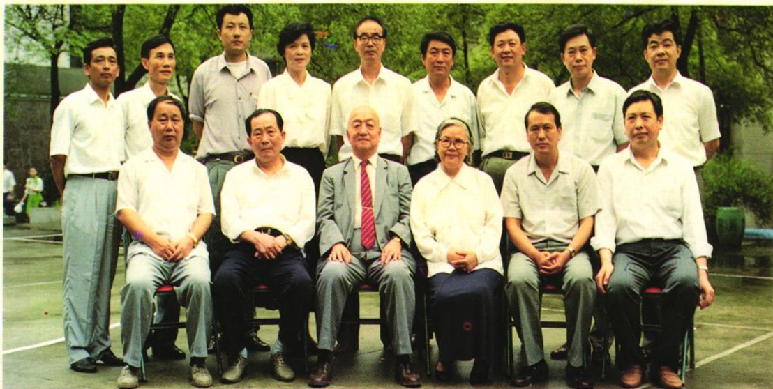
最高人民法院副院长端木正(前排左三)、湖南高级人民法院院长詹顺初(前排左二)与广州铁路运输两级法院院长合影(1994.6)