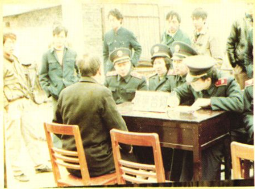
深入铁路沿线地区为民提供法律服务