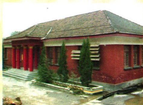
广州铁路运输法院衡阳派出庭旧址