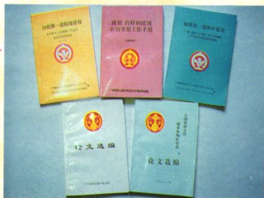
中级法院研讨工作成果