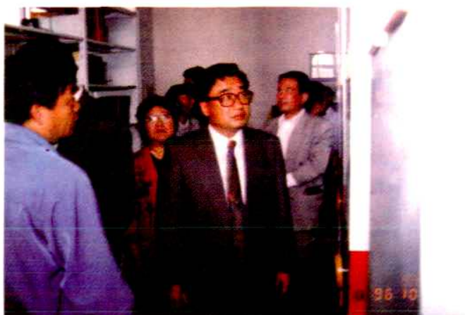
著名作家张贤亮 与读者见面