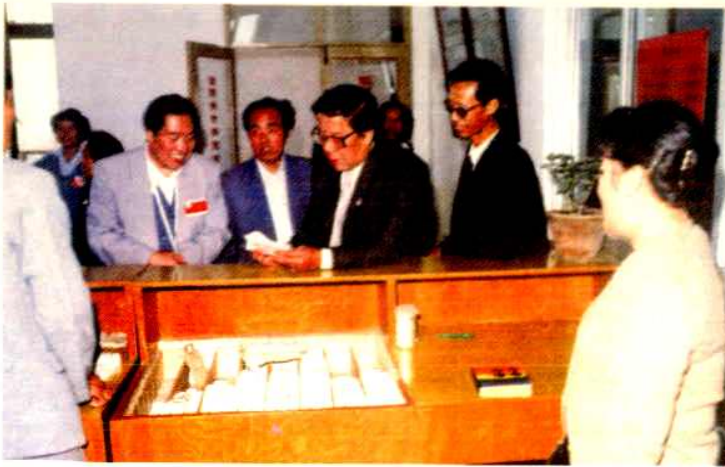
文化部副部 长李源潮到馆视 察工作