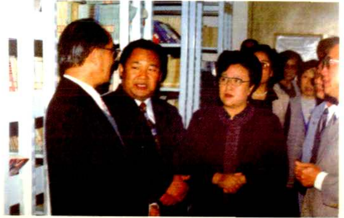
原文化部副部长 英若诚到馆视察工作