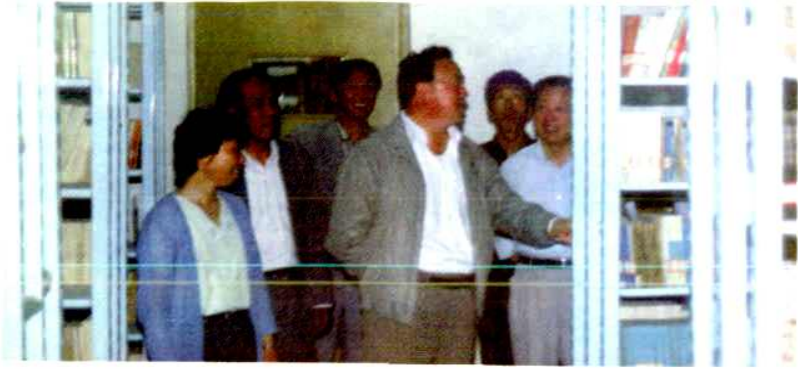
原文化部常务副部 长高占祥在自治区人民 政府副主席刘仲的陪同 下到馆视察