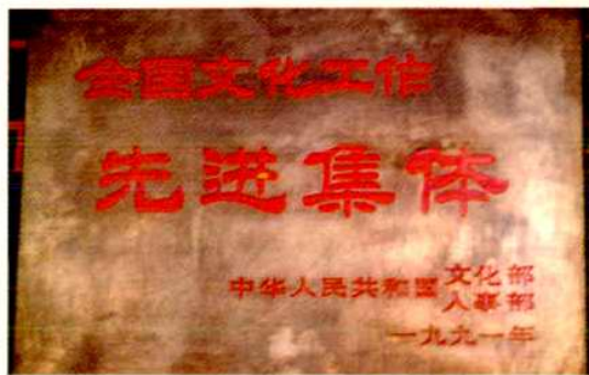
历年来获得的荣誉称号