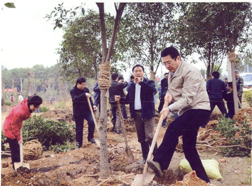
市长郑俊康（右一）、副市长焦耀光（右二）参加义务植树活动。