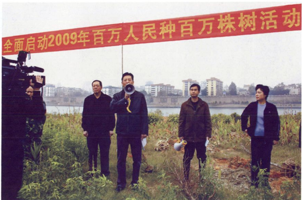
2009年春，市委书记陈刚（左一），市长郑俊康（左二），副市长严世明（右二），市委常委苏爱群（右一）等市领导参加义务植树活动。