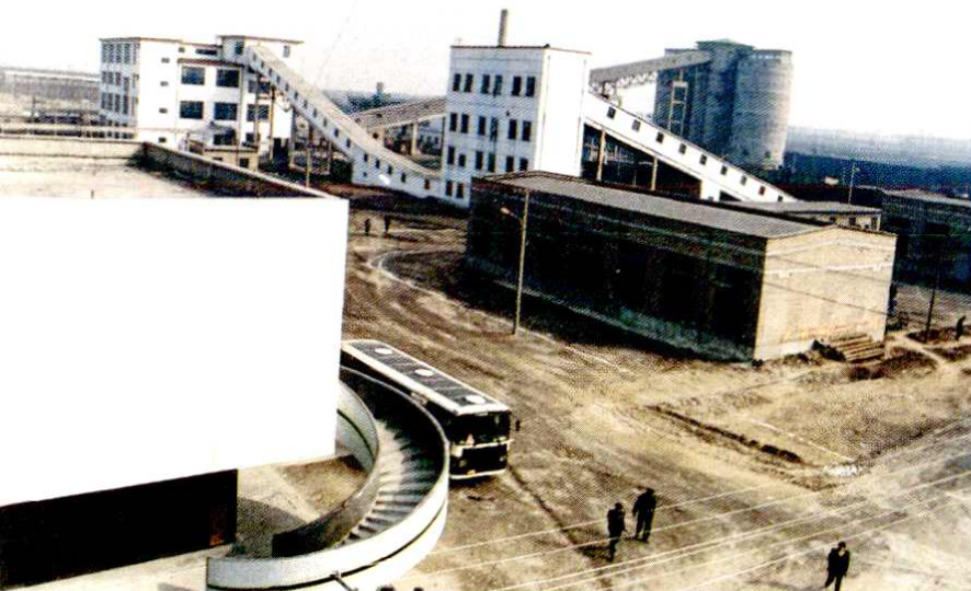
建设中的市洗煤厂