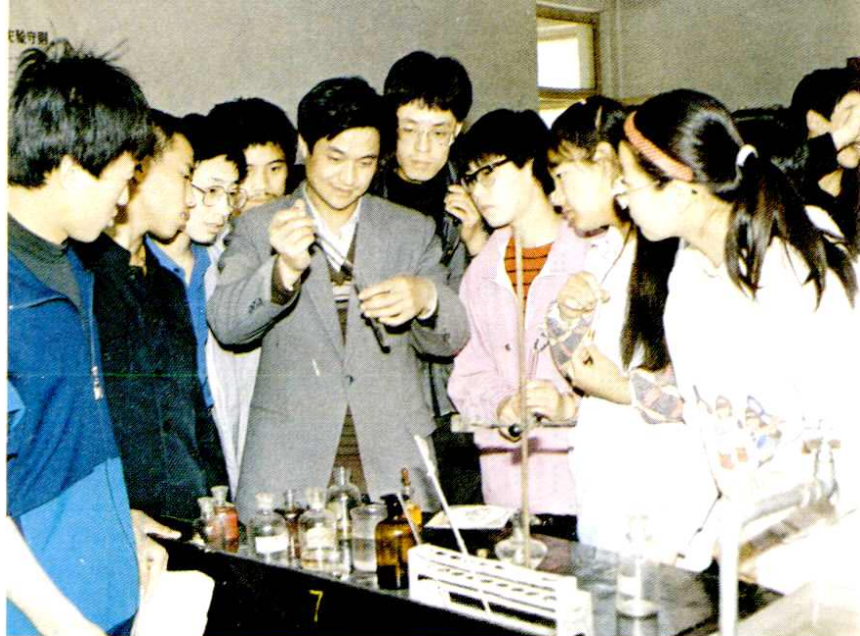
孝义中学学生化学试验