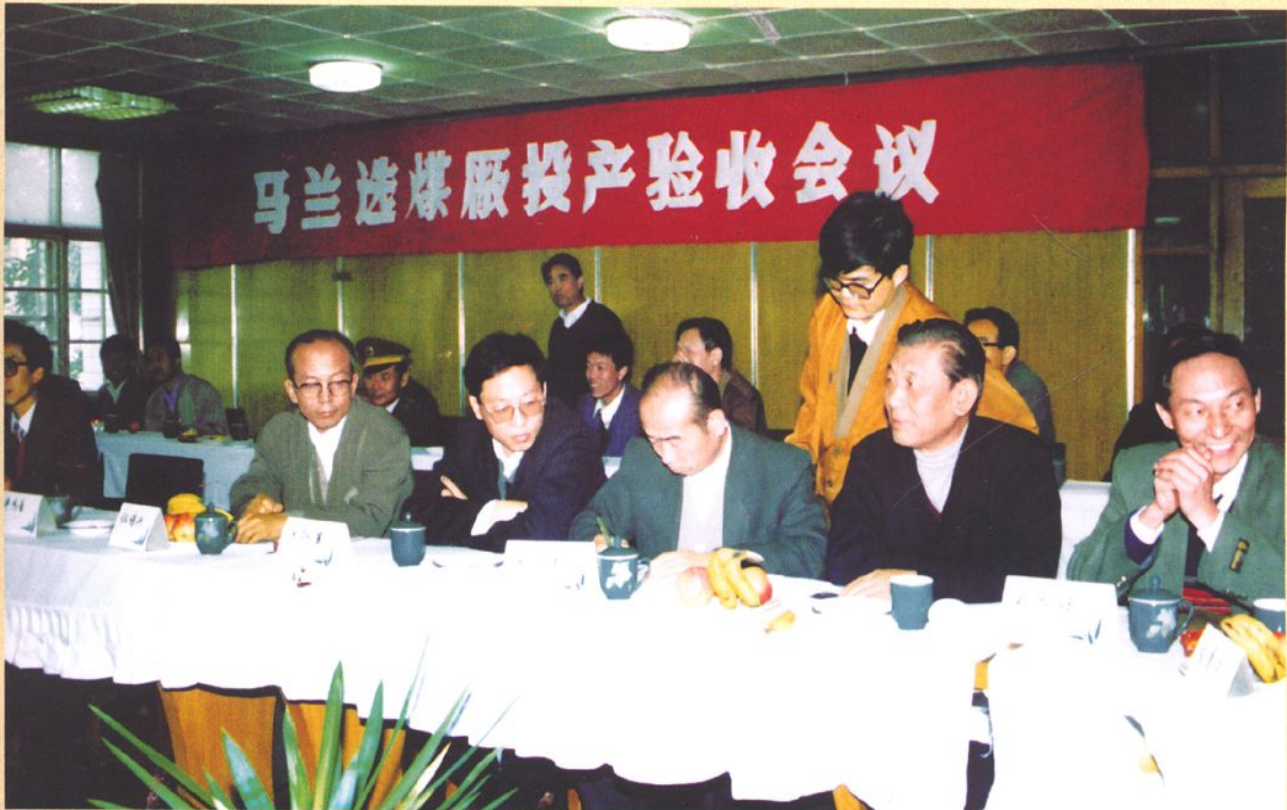
马兰矿选煤厂投产验收会议。