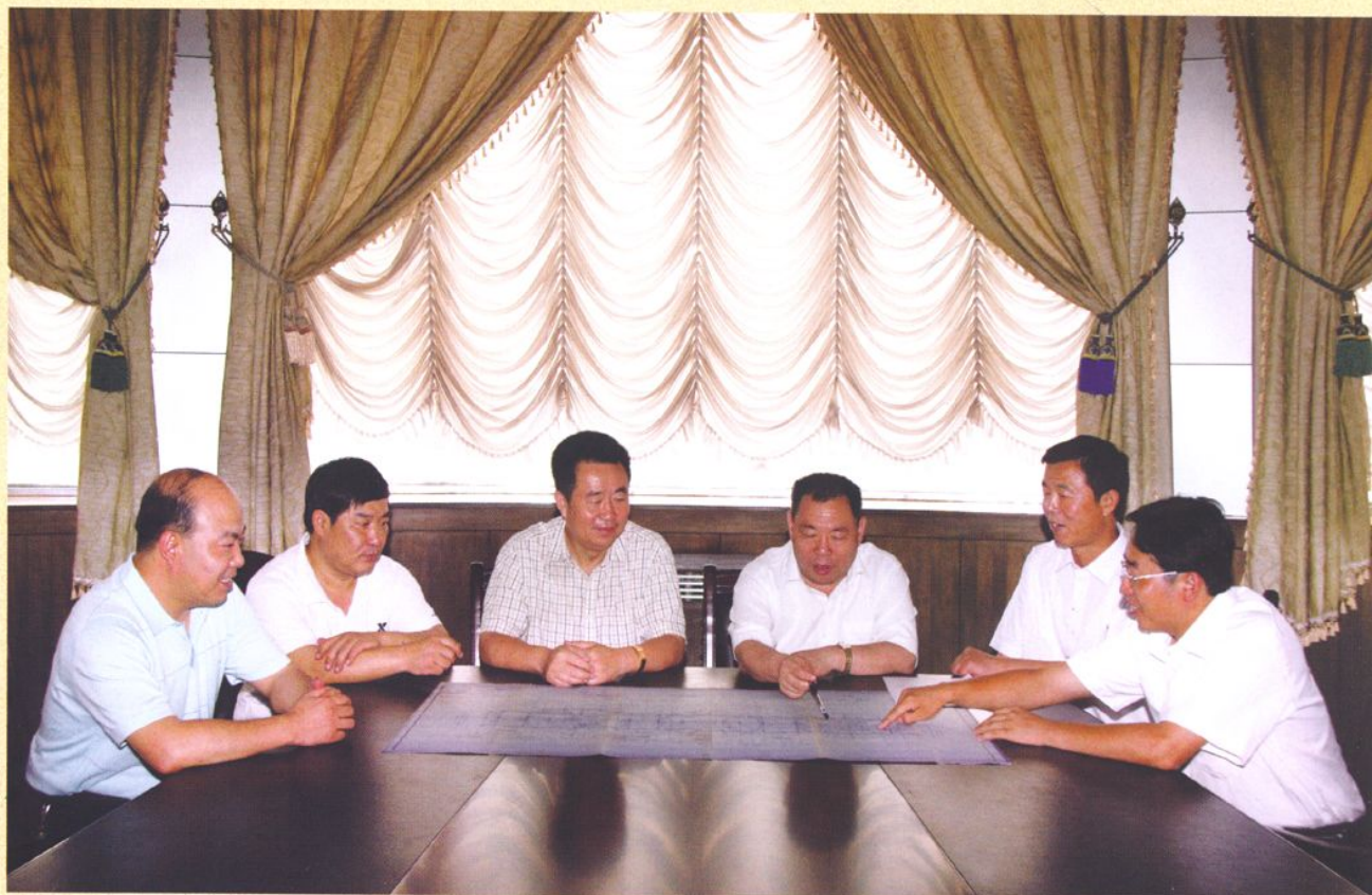
马兰矿选煤厂现任领导班子。