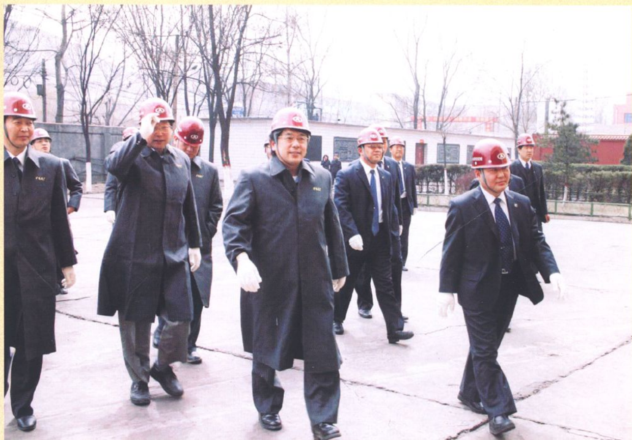
日本客商来厂参观。