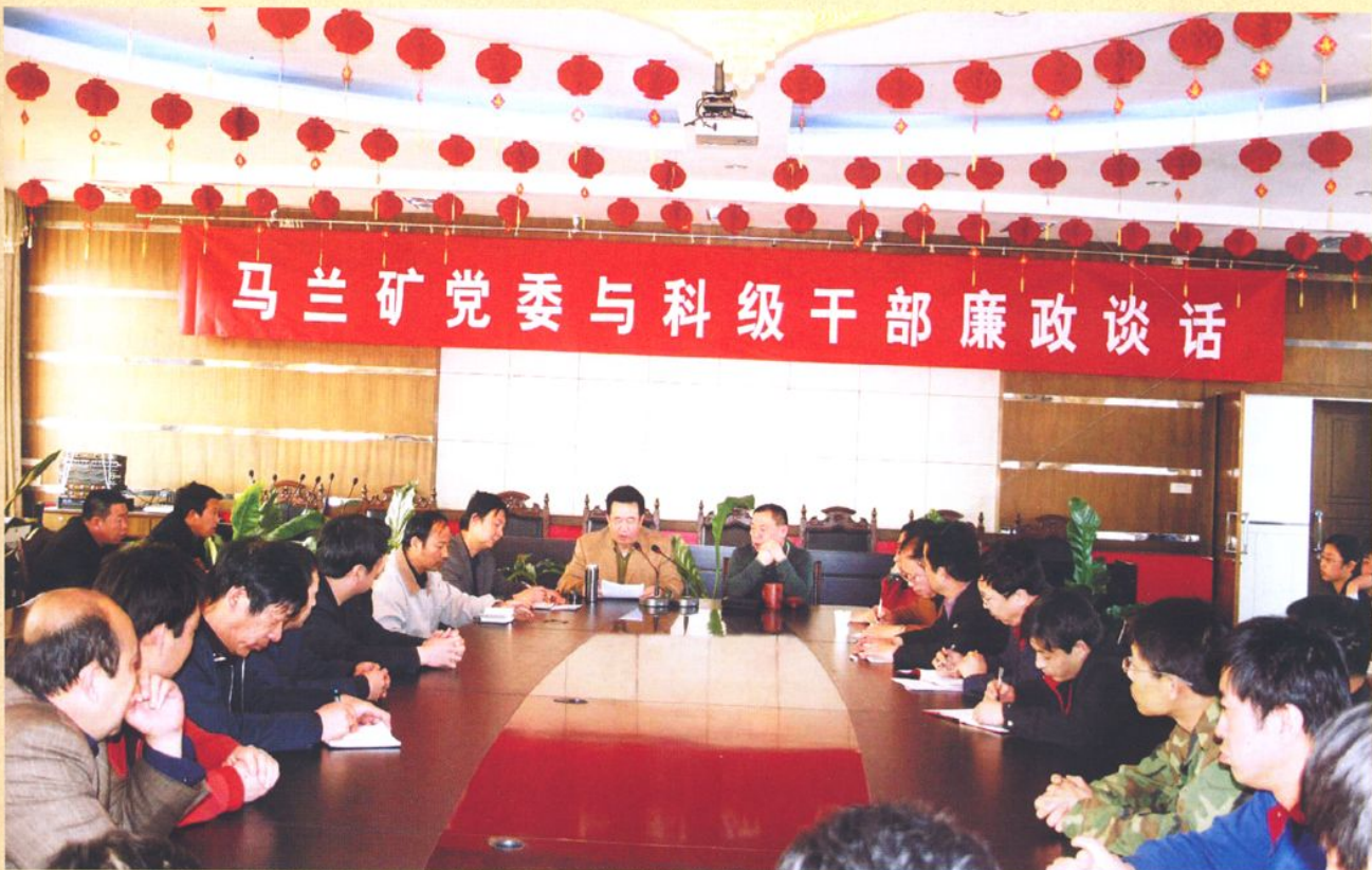
马兰矿党委与选煤厂科级干部廉政谈话。