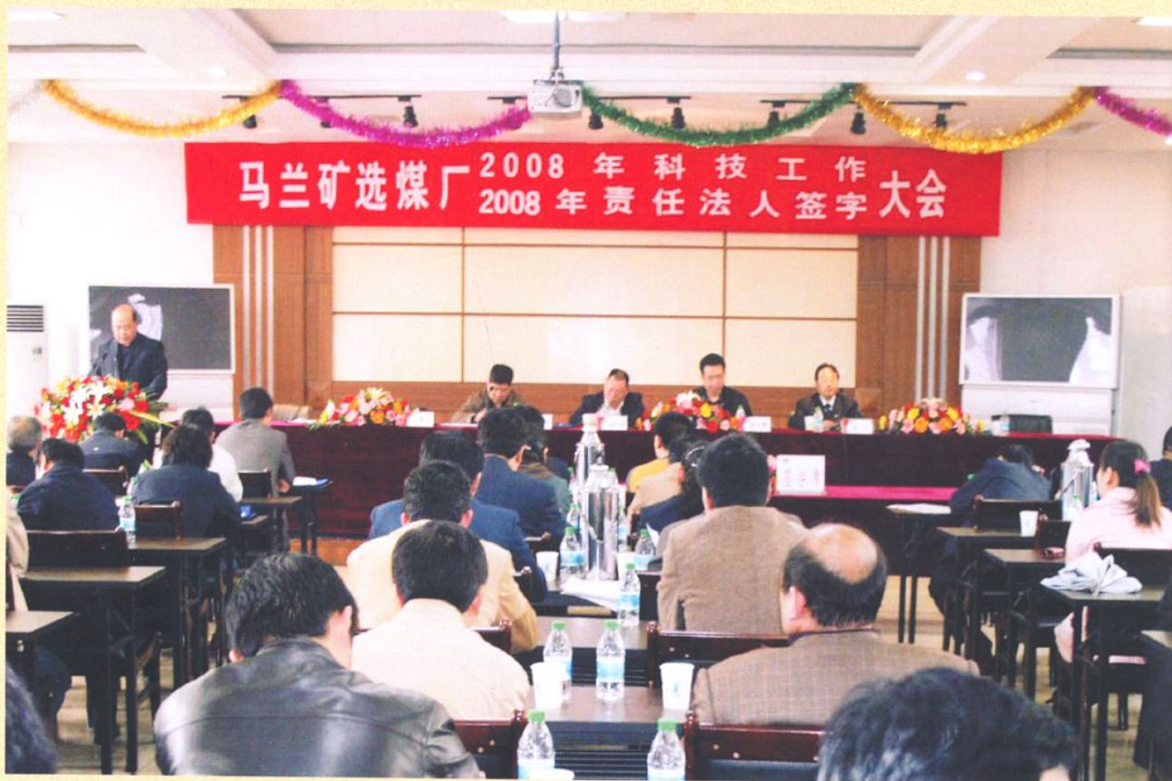
科技工作和责任法人签字大会。