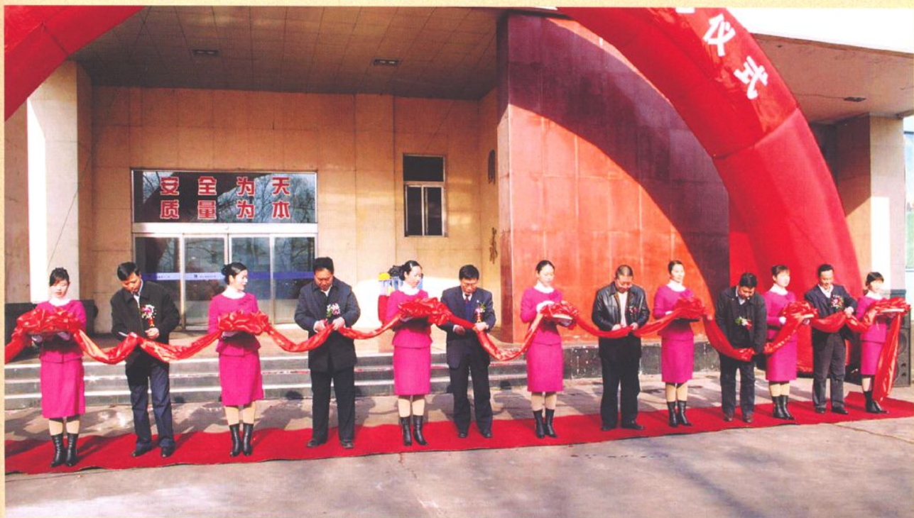
2007年12月15日，马兰矿选煤厂二期技改工程快开式隔膜压滤机、重介分选系统能力补套和精煤仓扩建项目竣工剪彩。