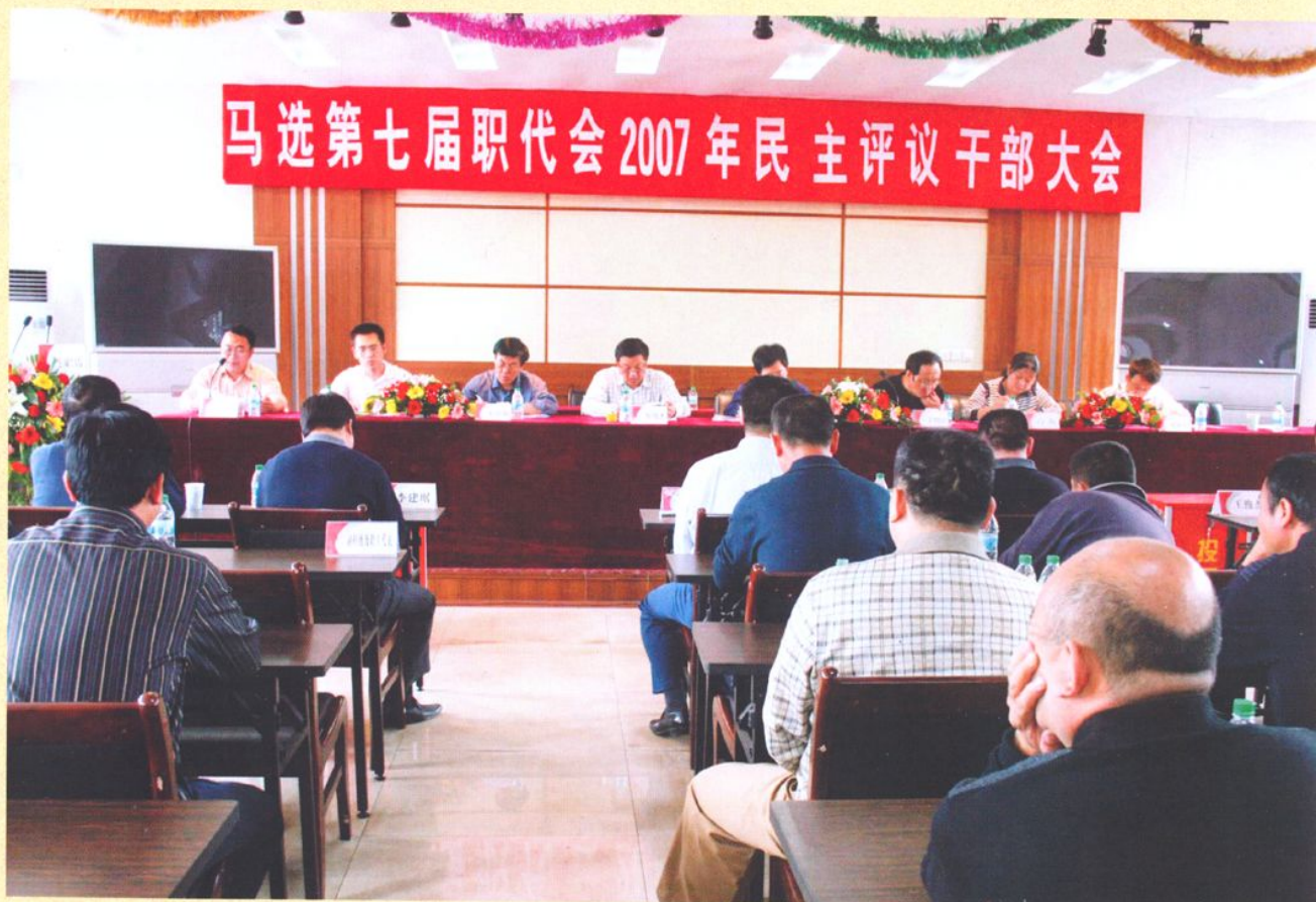
职代会民主评议干部大会。