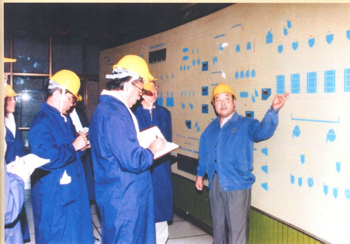
澳大利亚客人在集控室参观。