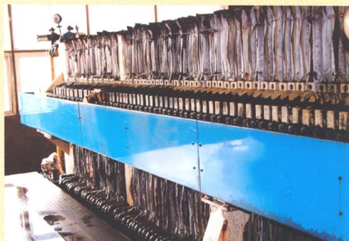
快开式隔膜压滤机。