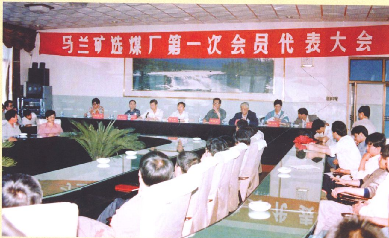
马兰矿选煤厂第一次会员代表大会。