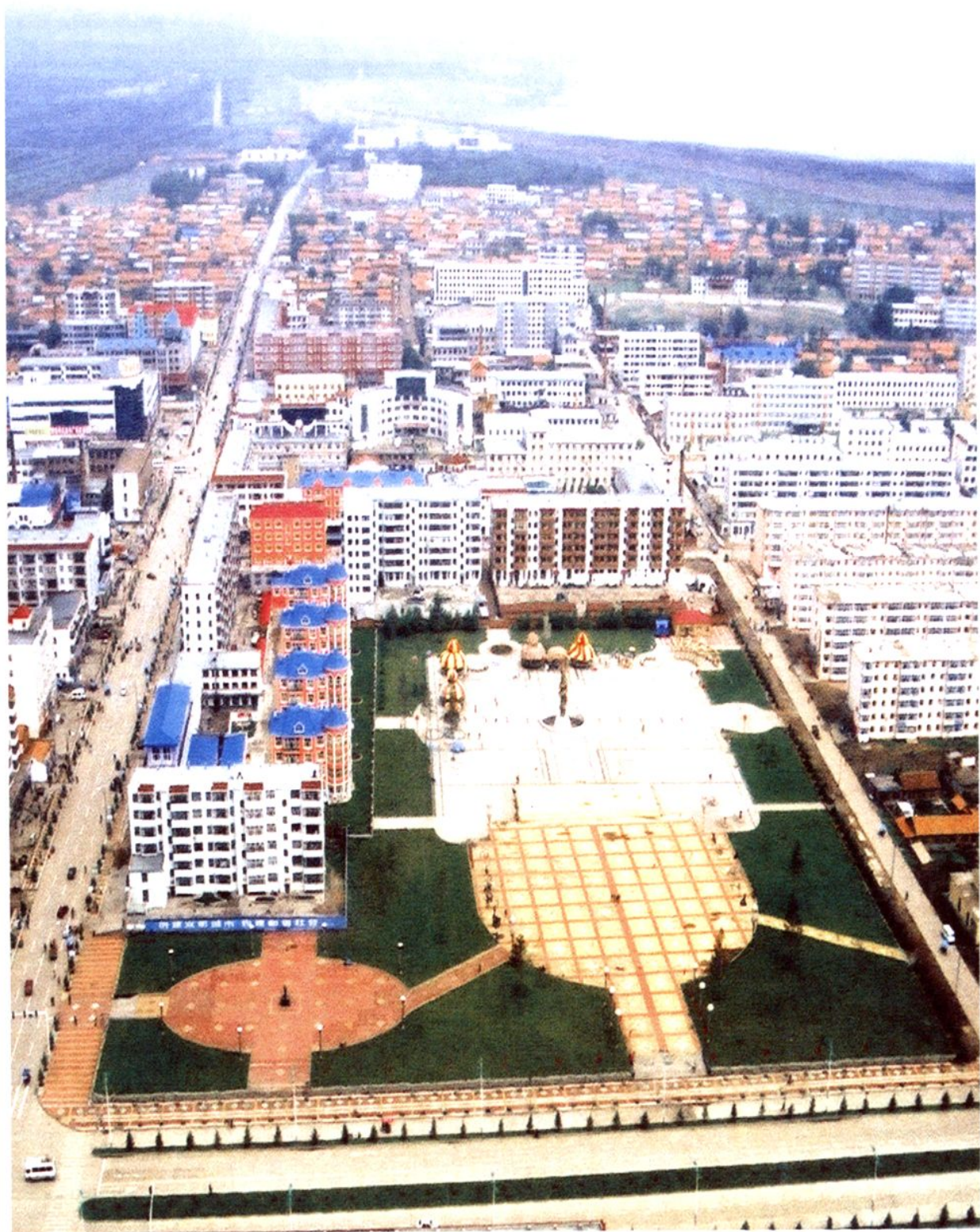
尼尔基镇城区鸟瞰