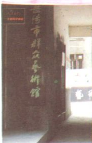
上：岳阳市群众艺术馆