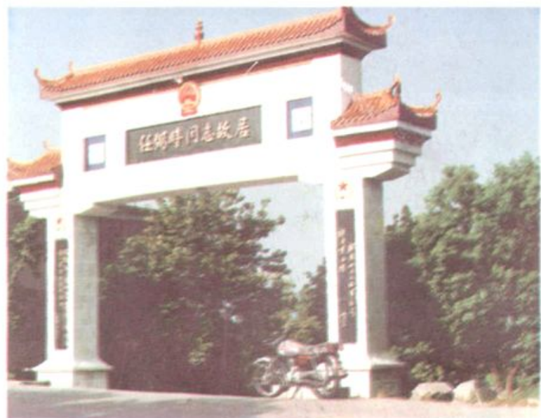
任弼时同志故居 纪念馆