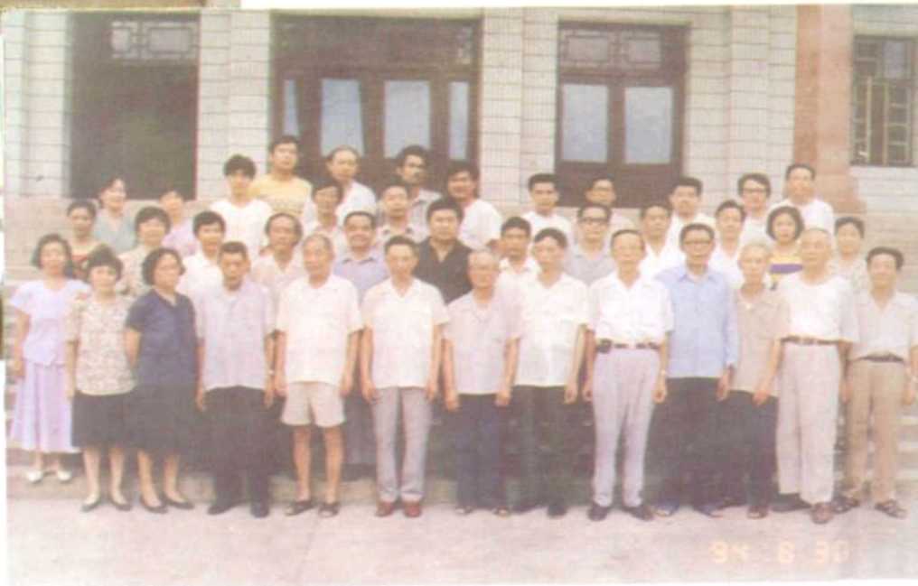
上：《文化志》部分工作人员和撰稿人员合影