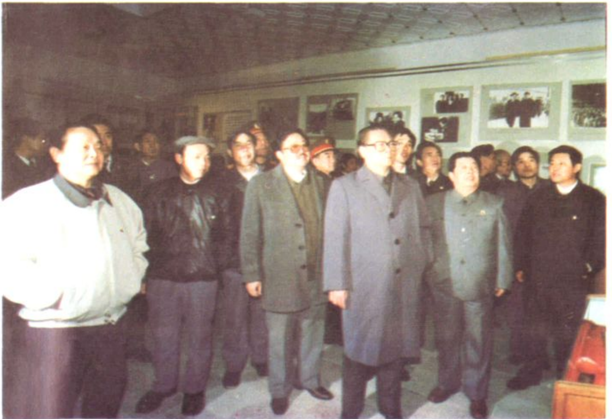
江泽民同志在省党、政、军领导陪同下，参观任弼时纪念馆