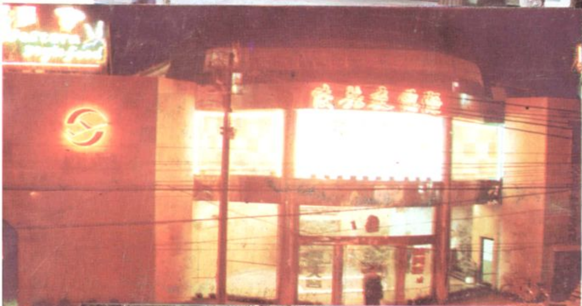
右：岳阳市电影公司