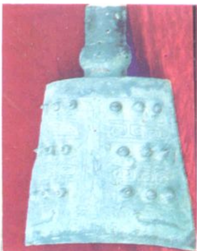
上图：商代晚期 回纹四虫铜铙