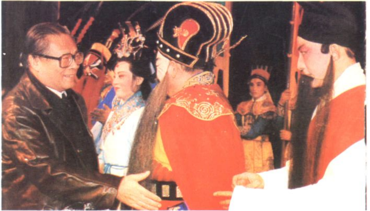
江泽民同志观看《曹操与杨修》，并上台与全体演职员见面。