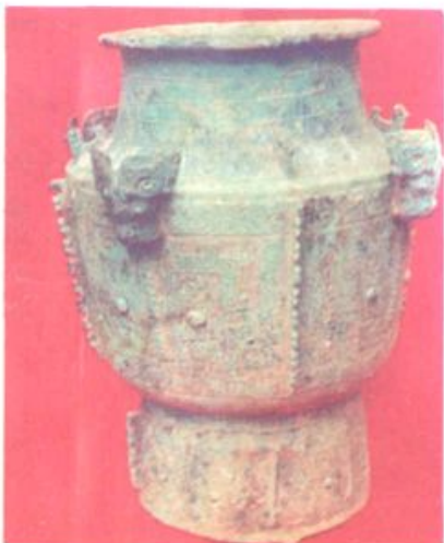
下图：商代牺 首鱼尾铜尊