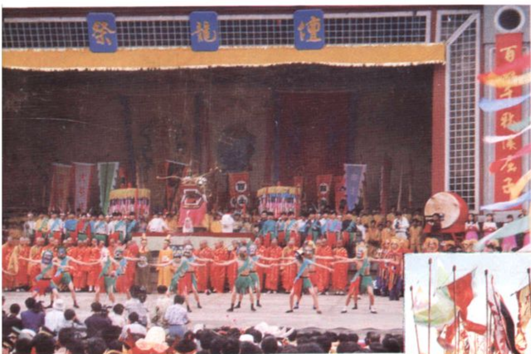
龙舟节的祭龙活动