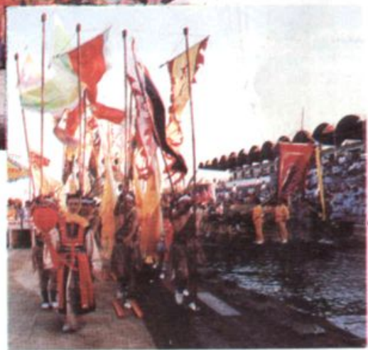
大型龙舞“九龙闹洞庭”