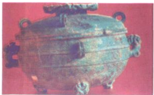
盞 「函儿」铭文铜 左图：春秋