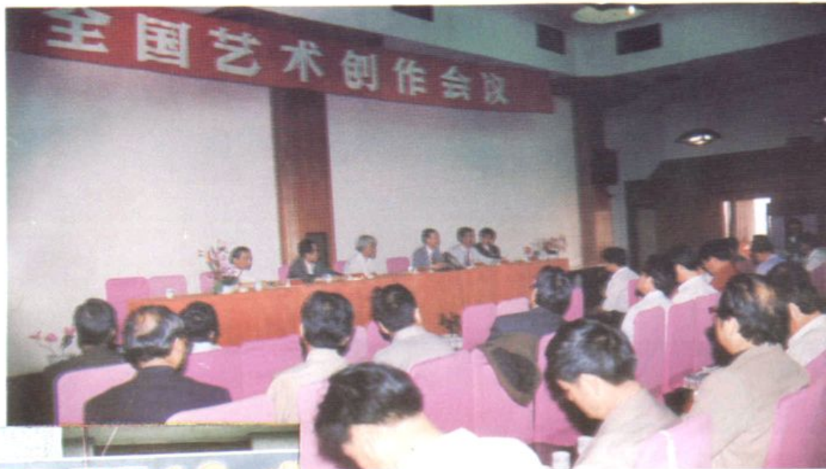
上：一九九四年五月，全国艺术创作会议在岳阳召开。