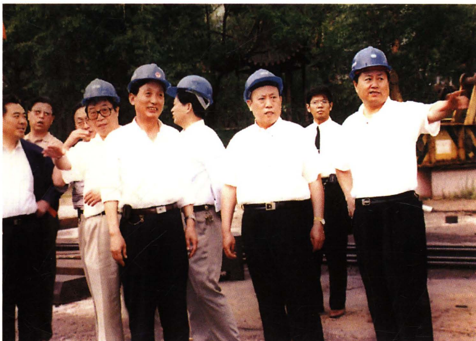
1998年6月21日，黑龙江省省委书记徐有芳（前排右二）视察工厂