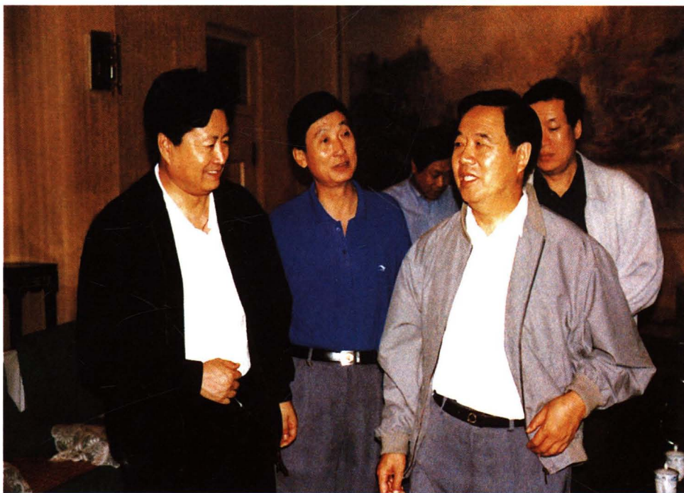
1998年8月13日，铁道部部长傅志寰（右一）视察工厂