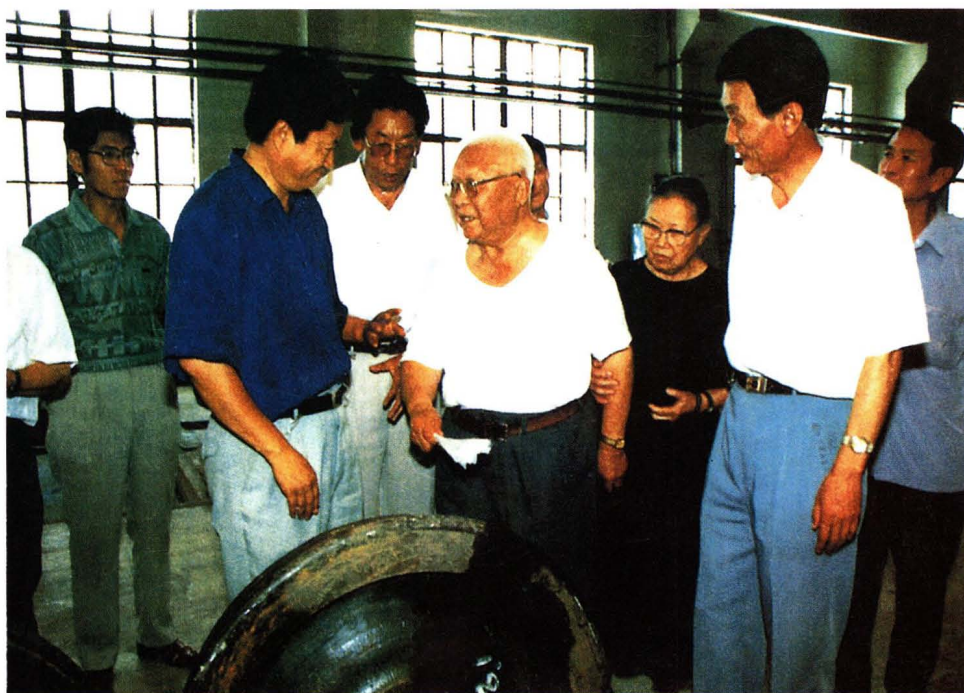
1995年8月2日，原全国政协副主席刘澜涛（前排左二）视察工厂