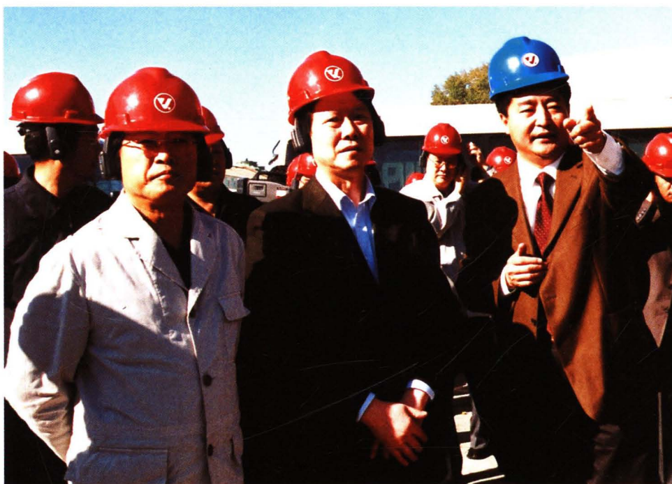
2004年10月13日，国务院国有资产监督管理委员会主任李荣融（左二）在黑龙江省省长张左己（左一）的陪同下视察齐车公司