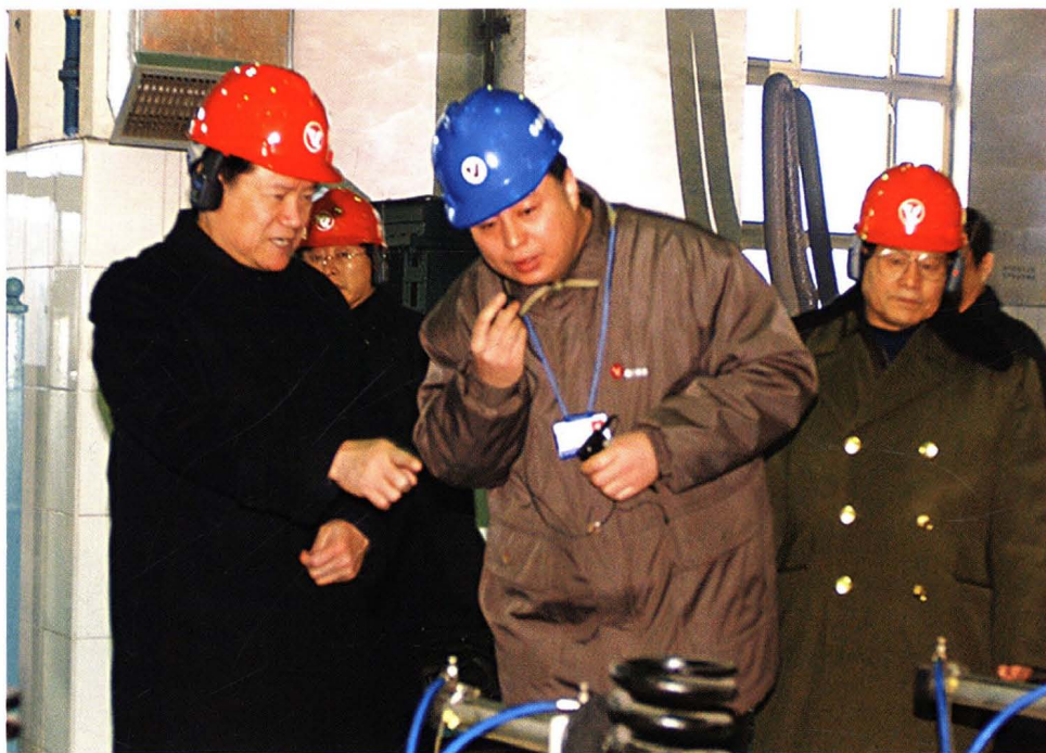
2003年12月27日，中共中央政治局委员、书记处书记、国务委员、公安部部长周永康（左一）视察齐车公司