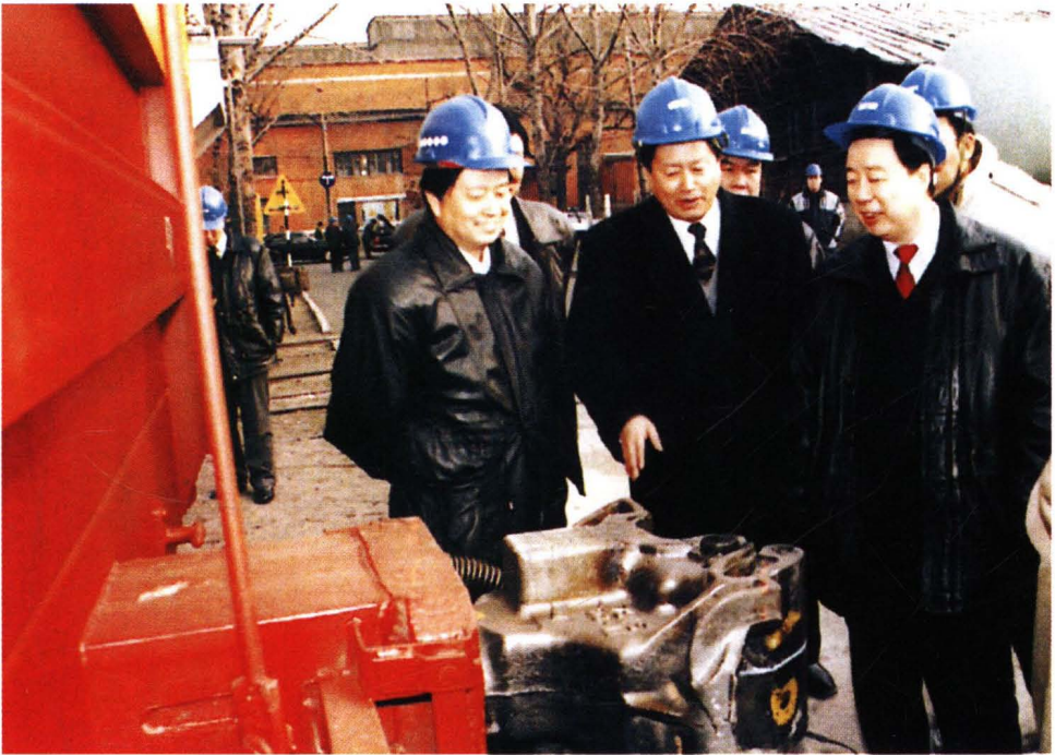
1998年2月18日，铁道部副部长孙永福（右一）视察工厂