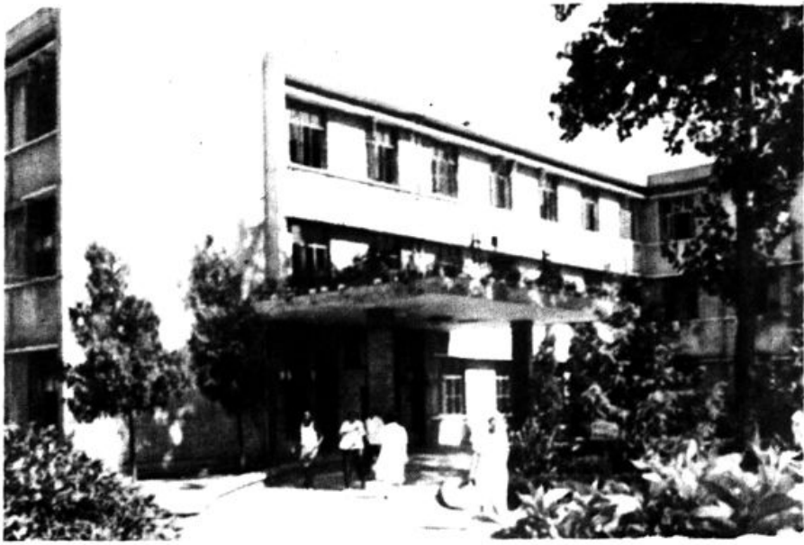
县人民医院住院部