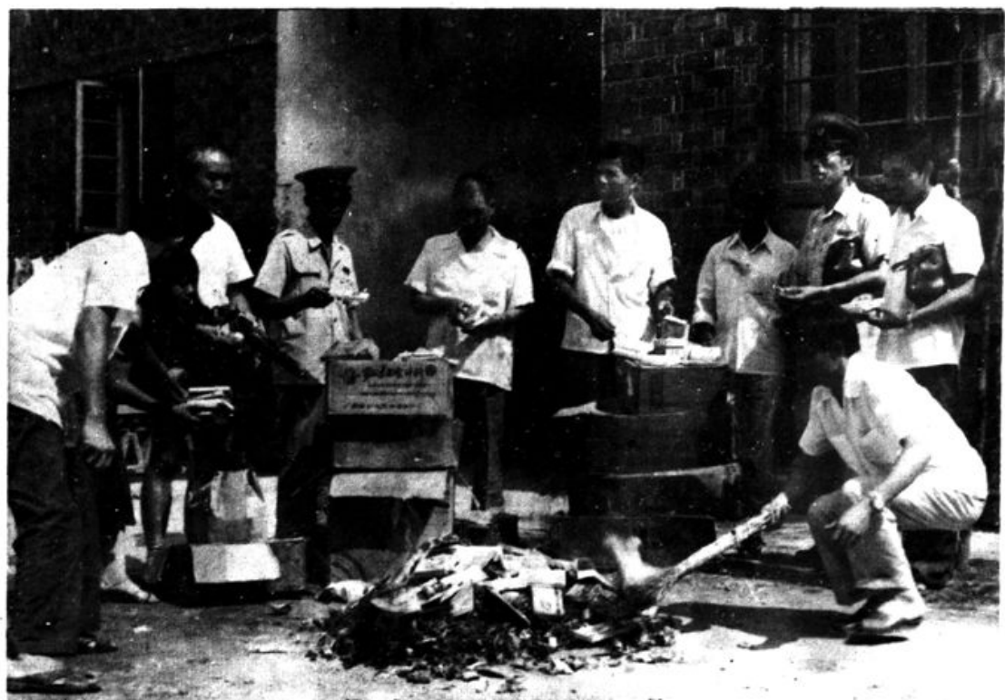
县人夫、卫生局及工商行政管理部门销毁假冒、伪劣药品