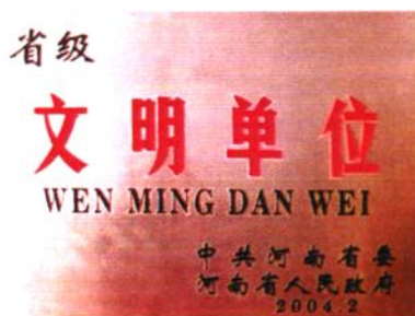
2003年第三次荣获省级文明单位