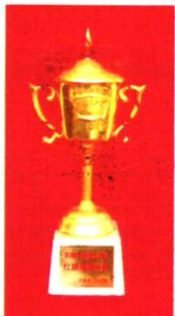
1991、1992、1993连续三年荣获全省红旗渠精神杯