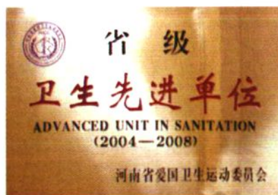
2004年荣获省级卫生先进单位