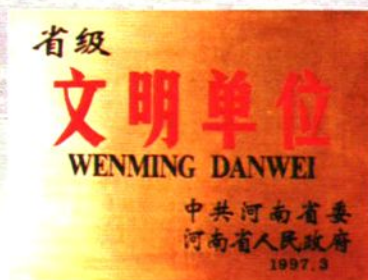
1997年再次荣获省级文明单位