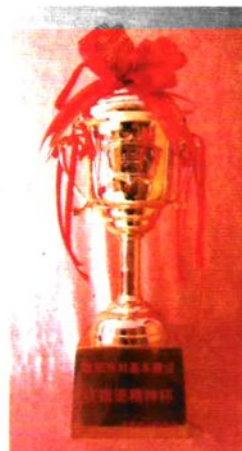
2003年荣获全省红旗渠精神杯