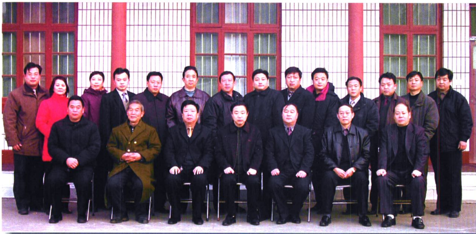
安阳县水利志编委会成员合影