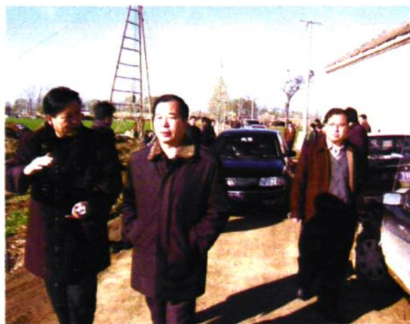
董永安市长视察我县水利工作