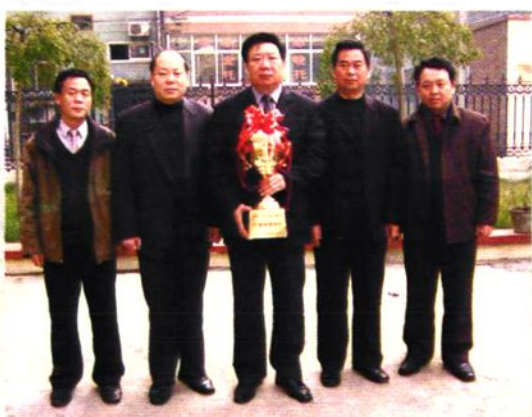
2004年水务局领导班子