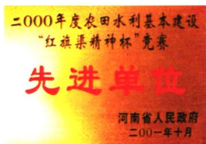
2000年荣获全省“红旗渠精神杯”竞赛奖牌