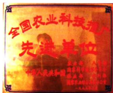
1995年荣获全国农业科技推广先进单位