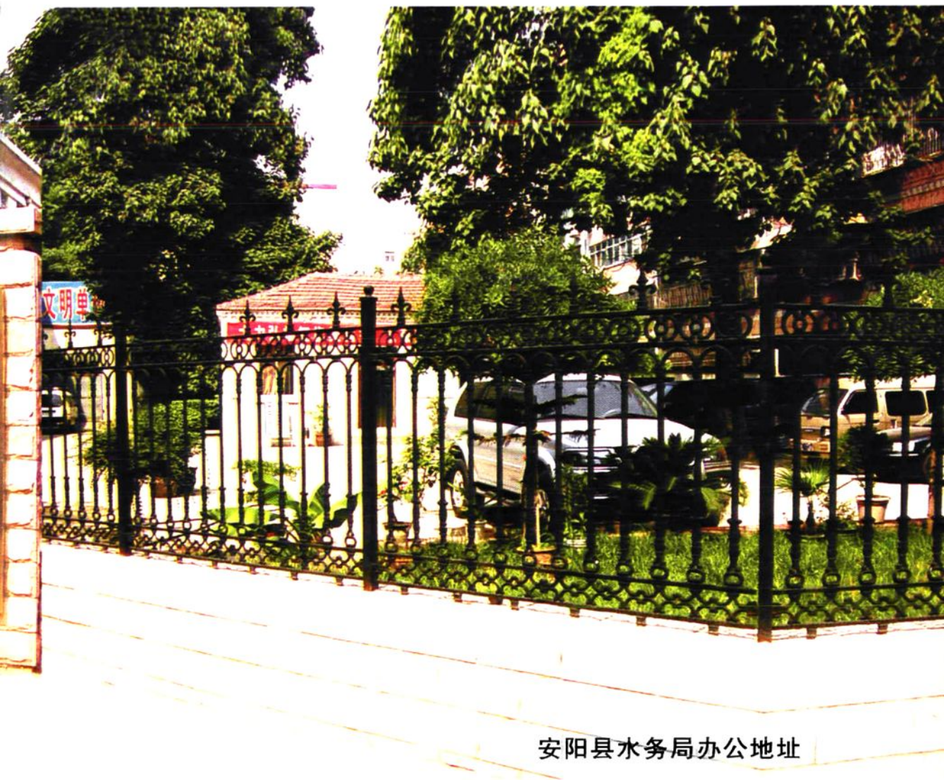
安阳县水务局办公地址