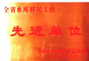
2002年荣获全省水库移民工作先进单位