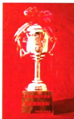
2002年荣获全省红旗渠精神杯