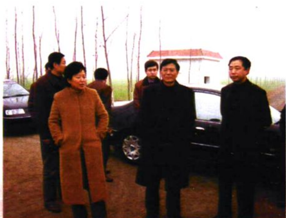
市领导李发军、葛爱美视察我县水利工作