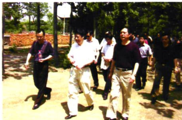
靳绥东书记视察我县水利工作