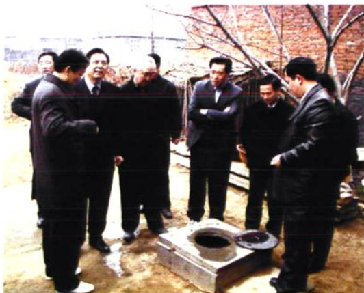
市领导李连庆视察我县水利工作