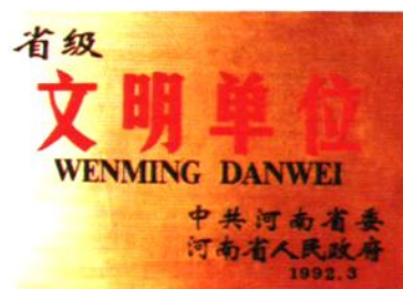
1992年荣获省级文明单位