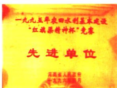
1995年荣获全省“红旗渠精神杯”竞赛奖牌