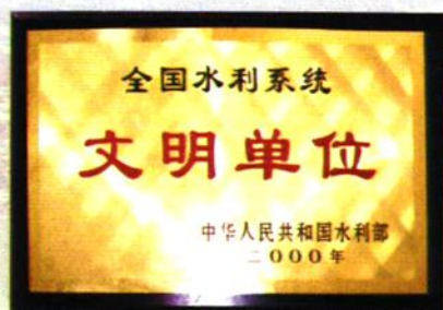
2000年荣获全国水利系统文明单位