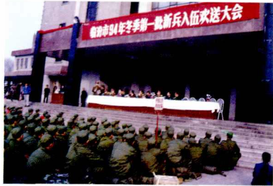
新兵入伍欢送大会(1994年)