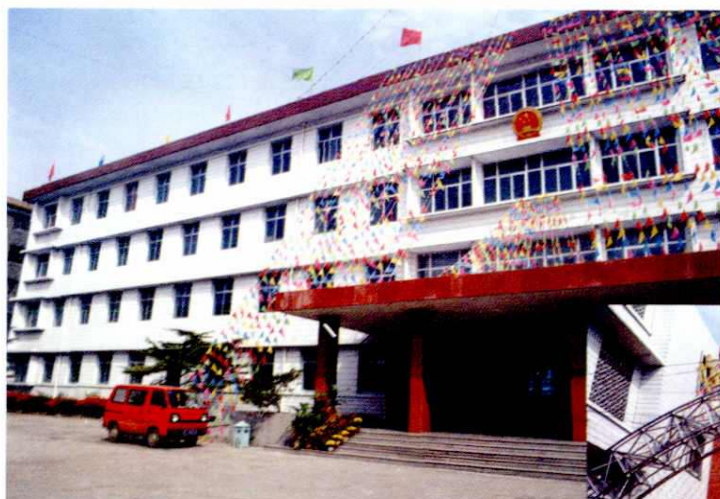
市人民政府机关 (1998年 鼓楼东大街)