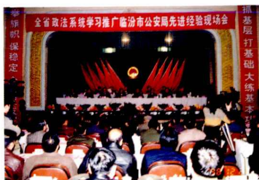
全省政法系统学习推广本市公安局先进经验现场会(1998年)