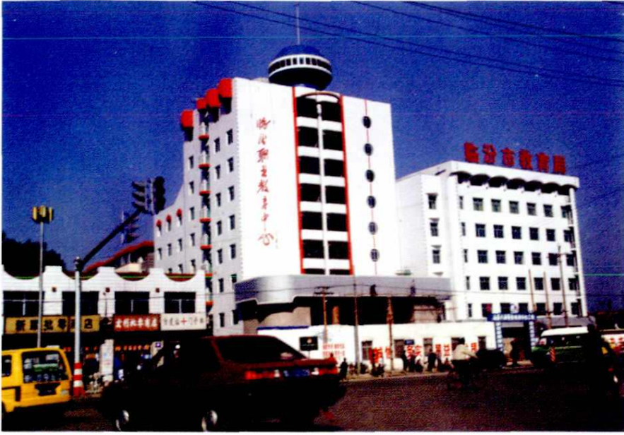
市教育局及职教中心大楼(2000年)