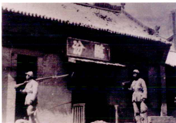
刚解放的临汾火车站（1948年）