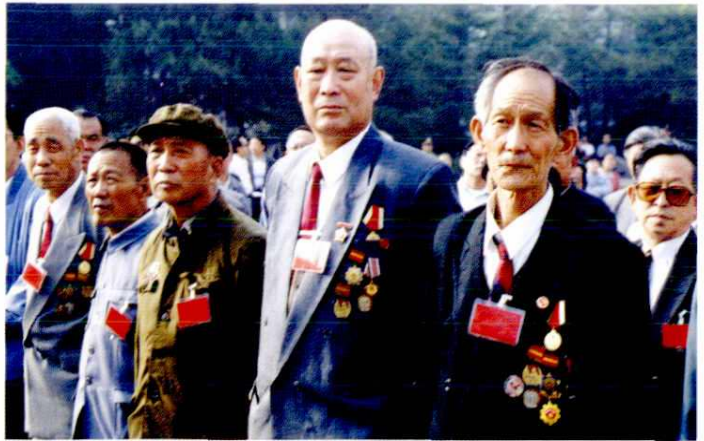
临汾旅老英雄拜谒烈士陵园(1998年)