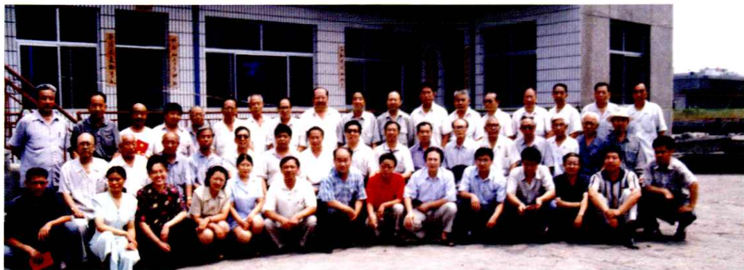
市志编辑部全体人员合影(1999年)