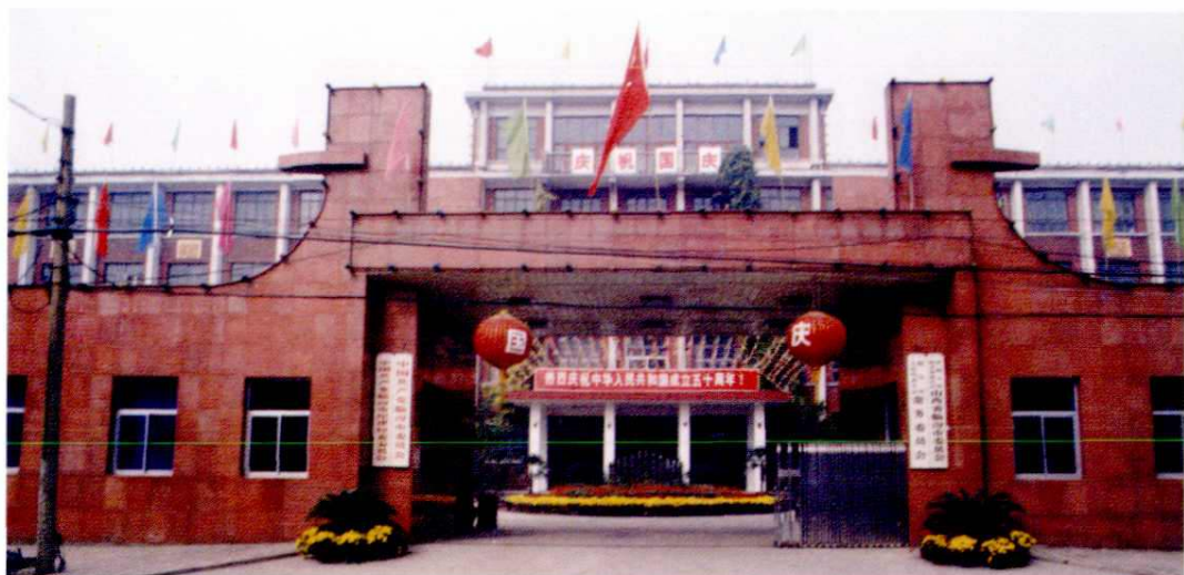
中共临汾市委机关 (1998年 广宣街)