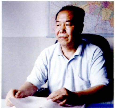
市政协主席卫喜才（2000年）