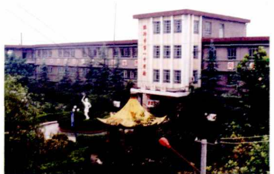
市第八中学教学大楼(1998年)