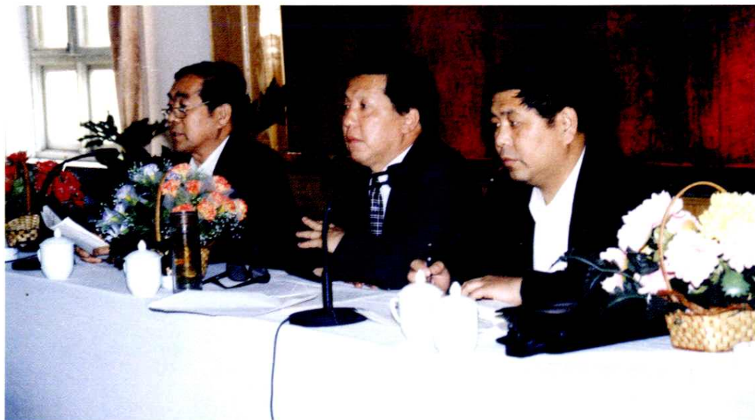
副市长、市志编委常务副主任杨一民(中)在修志工作会议上(1999年)