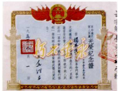
杨英俊烈士证书(1951年)