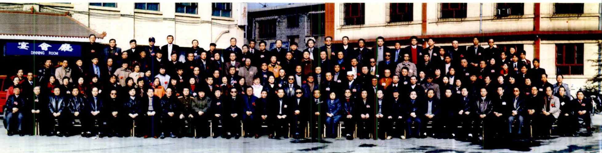
政协临汾市尧都区第六届委员会第四次全体会议 (2001年)