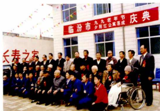
南街办事处夕阳红公寓(1998年)