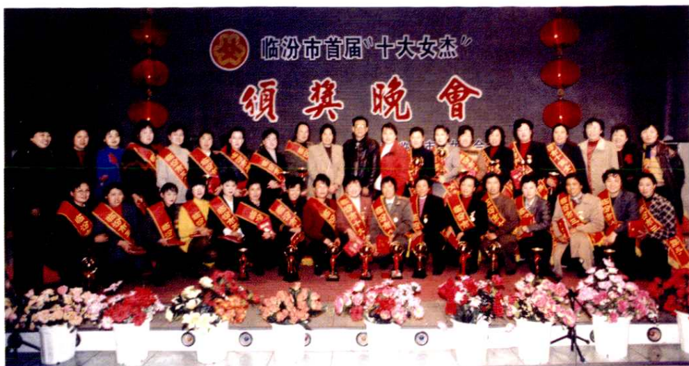
市首届十大女杰颁奖晚会(1998年)