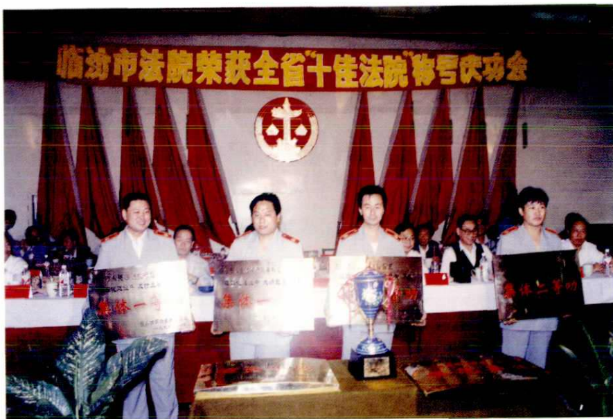
市法院荣获全省十佳法院称号(1998年)