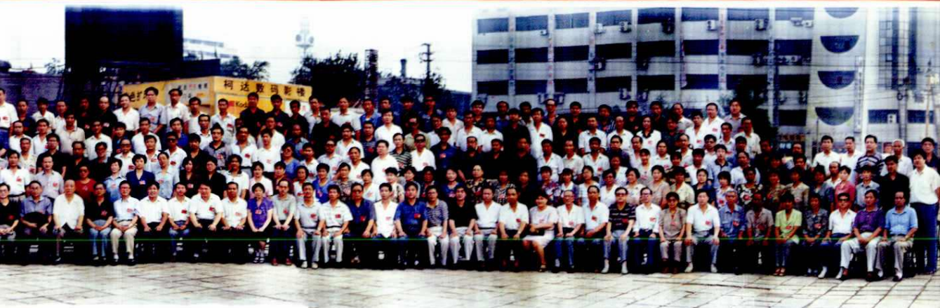
中国共产党临汾市第五次代表大会 (1998年)