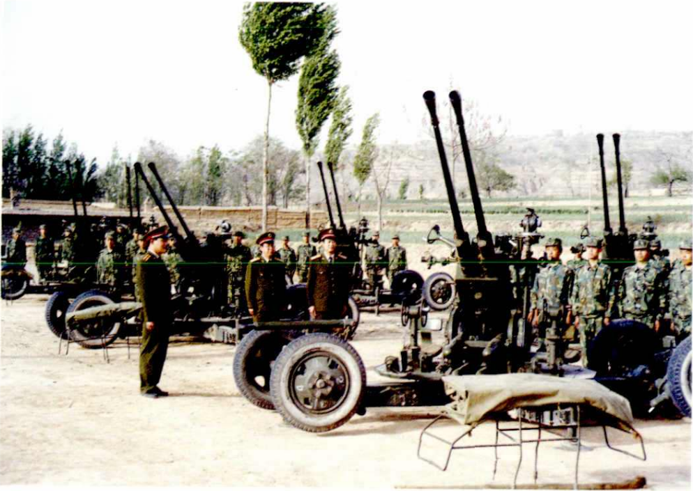
市人武部领导指导临钢民兵高炮连训练(2000年)