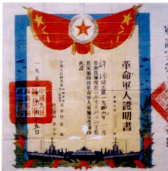
许璋革命军人证明书(1951年)