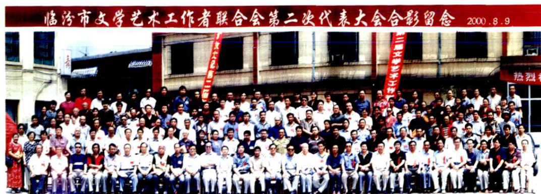
市文联第二次代表大会留影(2000年)