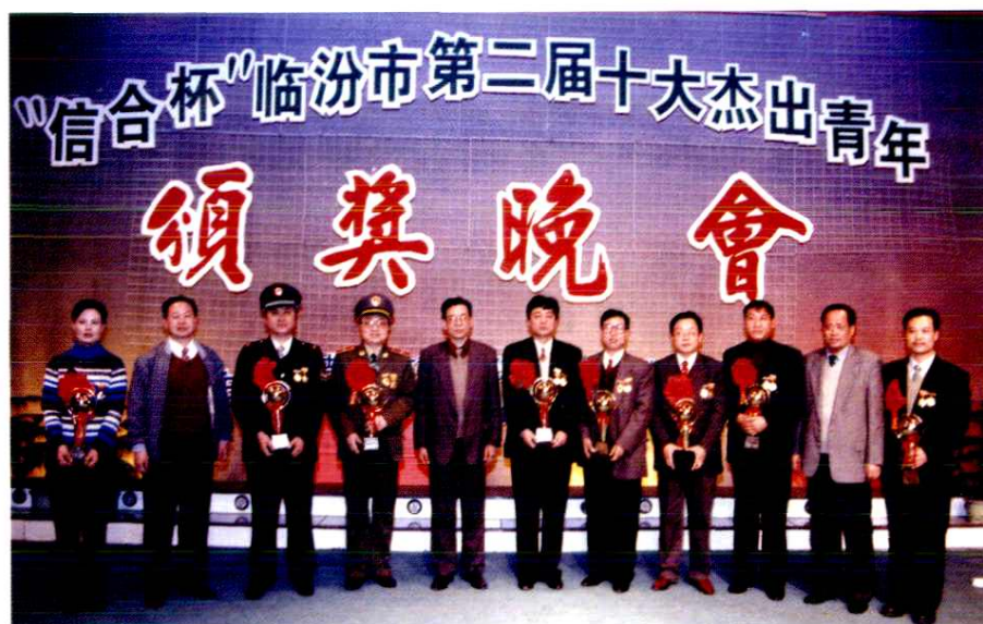
市第二届十大杰出青年颁奖晚会(1998年)