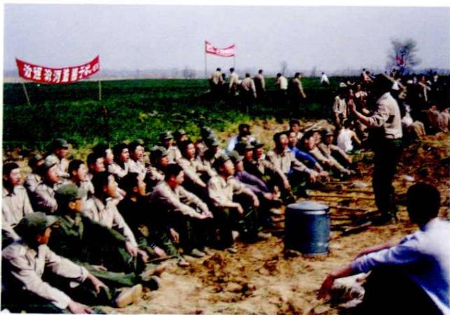
驻军指战员参加治理汾河义务劳动(1998年)