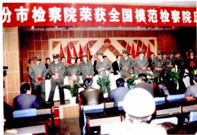
市检察院荣获全国模范检察院称号(1997年)