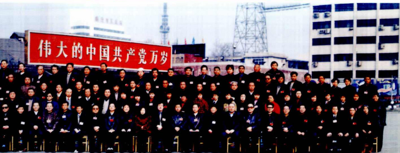
临汾市尧都区人大六届四次会议 (2001年)