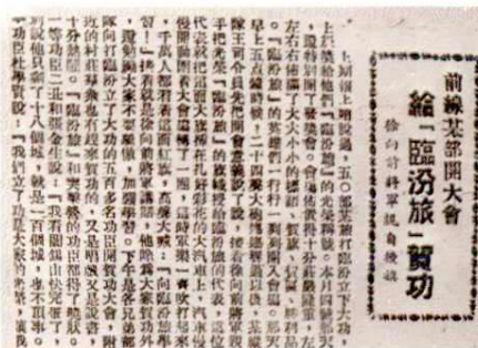
《新华日报》临汾旅贺功报道(1948年)