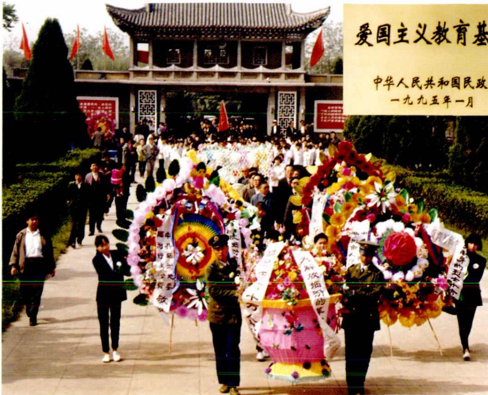
清明节祭奠临汾攻坚英烈活动(1998年)