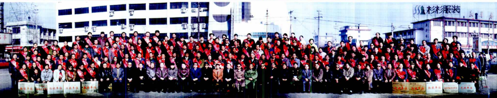
全市三级干部暨劳模表彰大会 (1999年)