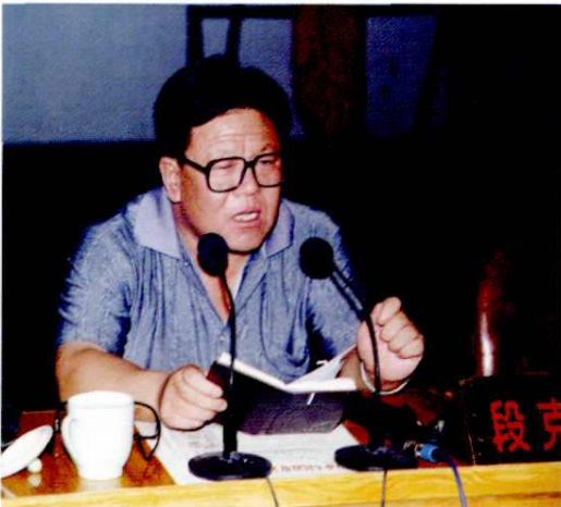
市委书记段克己（2000年）