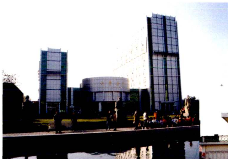
山西师范大学科学会堂(2001年)