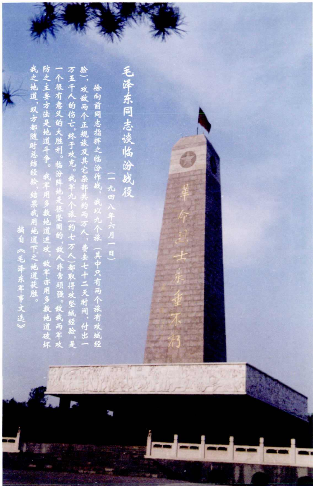
临汾烈士陵园革命烈士纪念碑(1998年)