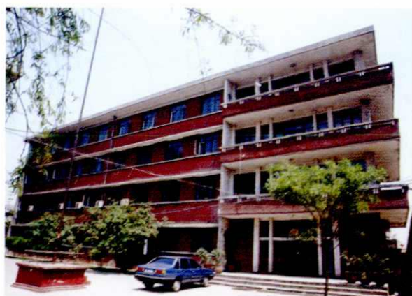
市人大常委会、市政协机关 (1998年 广宣街)