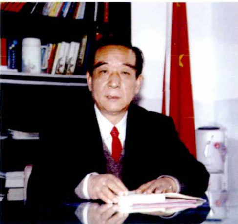
市人大主任李吉秀（2000年）