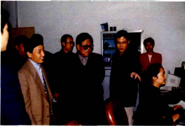
市委、市政府领导视察电视台工作(2000年)