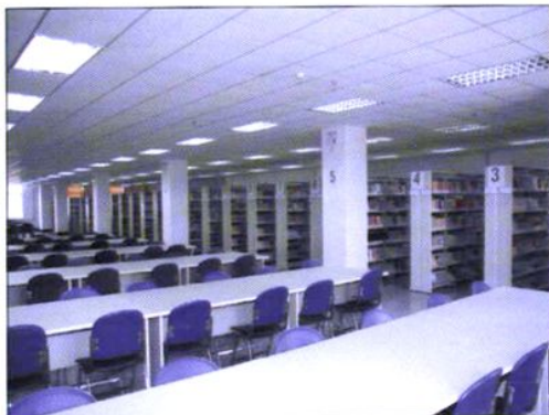
八十三中学图书阅览室