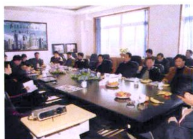
区人大领导及代表听取学校领导汇报工作