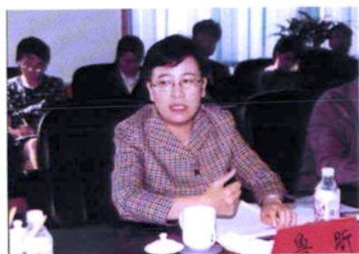
副省长鲁昕来校视察工作并讲话