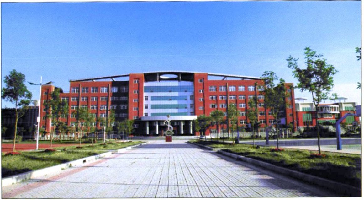
八十三中学教学主楼