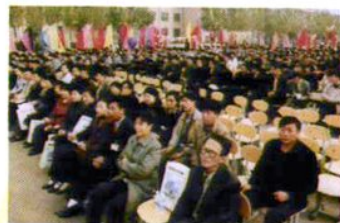
历届毕业生参加庆典活动