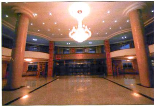
八十三中学教学楼正厅