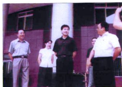
省教育厅副厅长张德祥来校视察工作