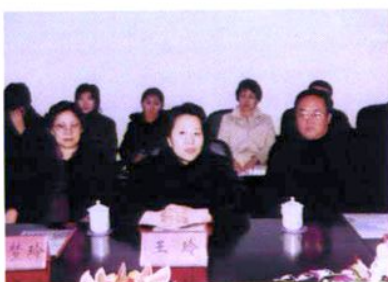
副市长王玲来校视察工作并讲话