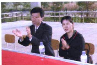
副区长顾英视察学校体卫工作