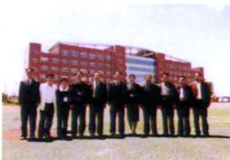
学校领导与韩国教育代表团合影