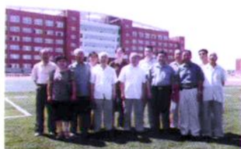
区关工委“五老”报告员来校参观