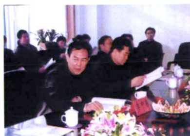
市人大副主任李中鲁来校视察工作并讲话