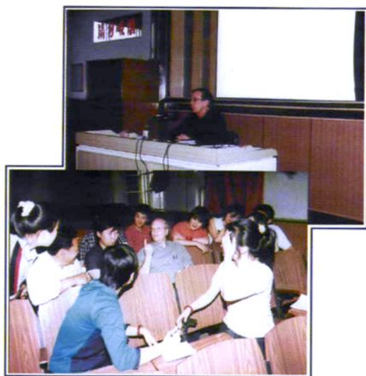
外教到校上英语示范课