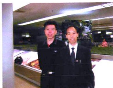
全国著名教育专家魏书生与张校长合影