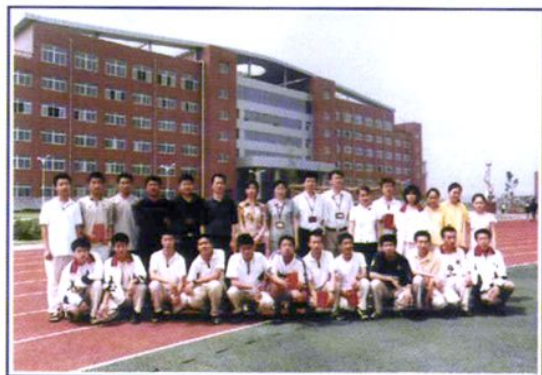
学校领导、指导教师与参加奥林匹克数学竞赛学生合影