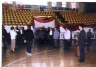
市教育局离退休干部来校参观