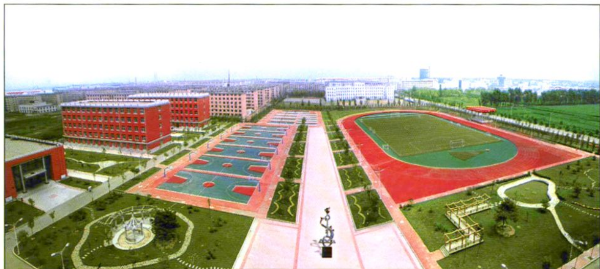
八十三中学校区北侧全景