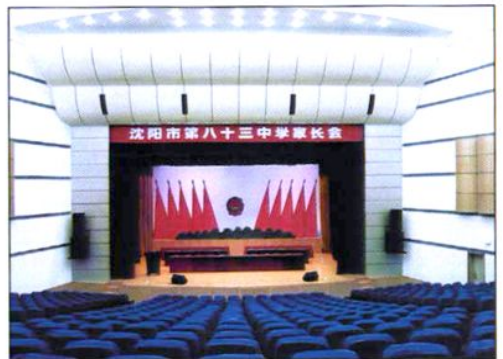
八十三中学多功能报告厅