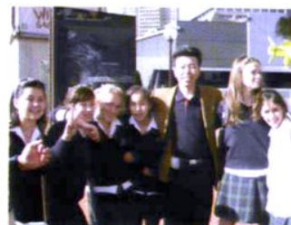
张校长与悉尼南十字星中学学生在一起