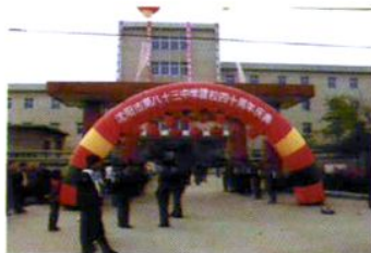
市八十三中学建校四十周年庆典