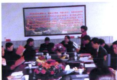
省示范高中验收团来校指导工作