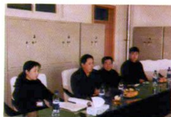
全国十大杰出青年吴琼参加会议并讲话