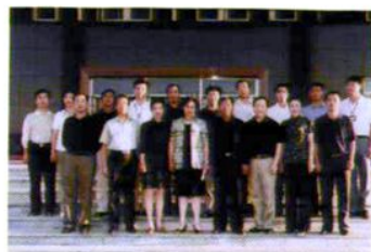
市、区教育局领导来校视察工作与学校领导班子合影