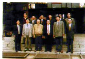
韩国高城郡访问团来校参观临别合影