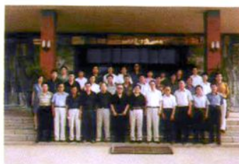
校领导与部分校友合影