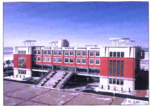
八十三中学图书信息中心和天文馆