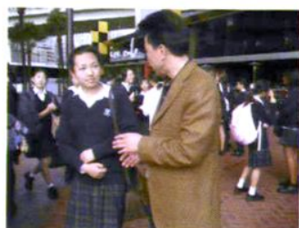
张校长在悉尼与中国留学生交谈