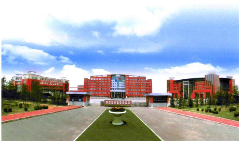
八十三中学新校址