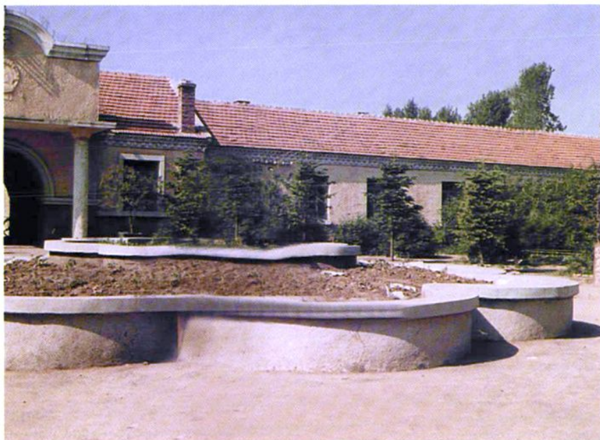
1961—1969八十三中学原校址