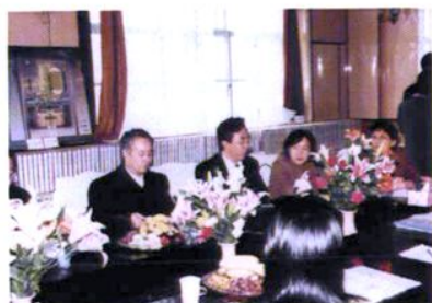
市督学室来校视察工作