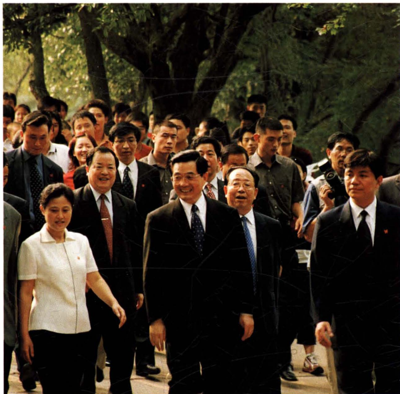
2003年10月，中共中央总书记、国家主席胡锦涛在中共湖南省委书记杨正午、省长周伯华陪同下来韶山考察并视察了韶河故居段。