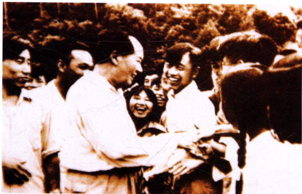
1959年6月毛泽东在韶山考察农村工作