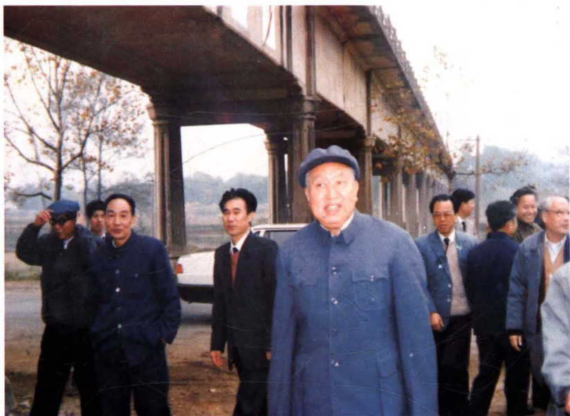
1990年11月，华国锋到韶山，视察了韶山灌区韶山银河。