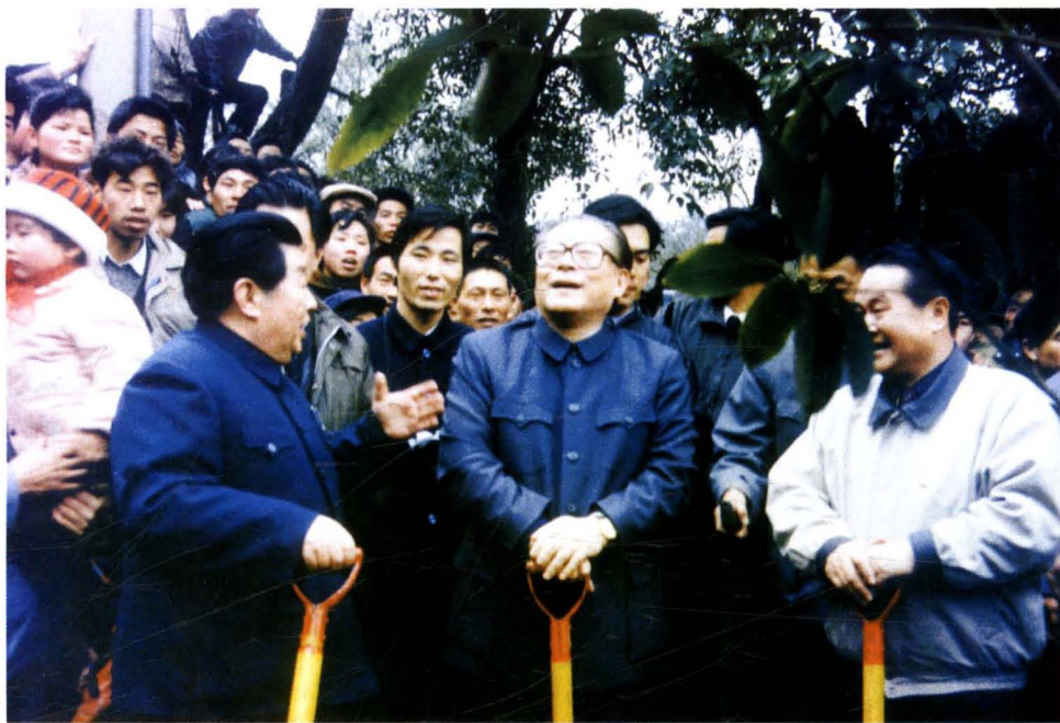
1991年3月，中共中央总书记江泽民在中共湖南省委书记熊清泉、省长陈邦柱陪同下来韶山考察，并在韶山植树，号召搞好水土保持。