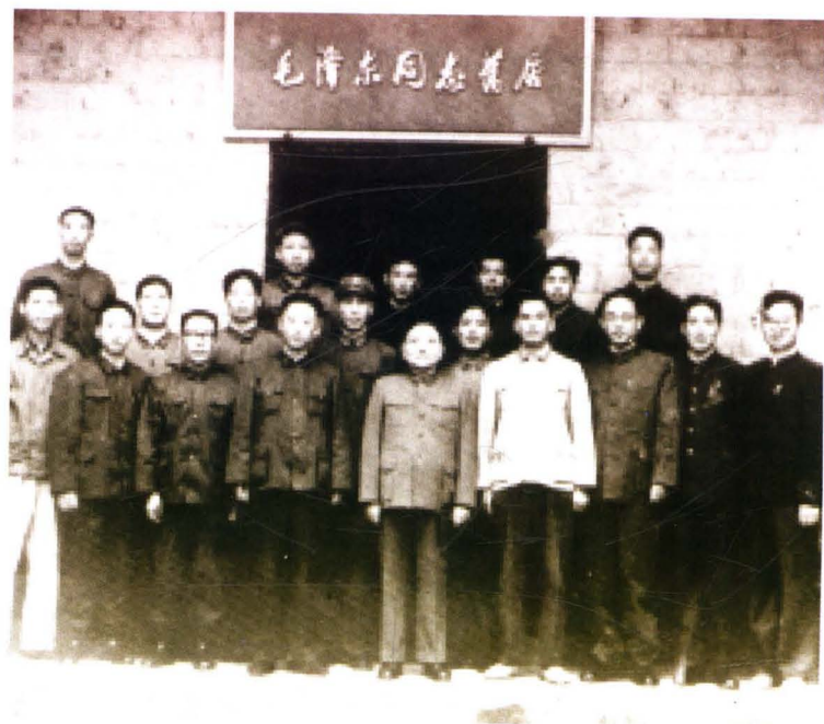
1973年10月邓小平在韶山