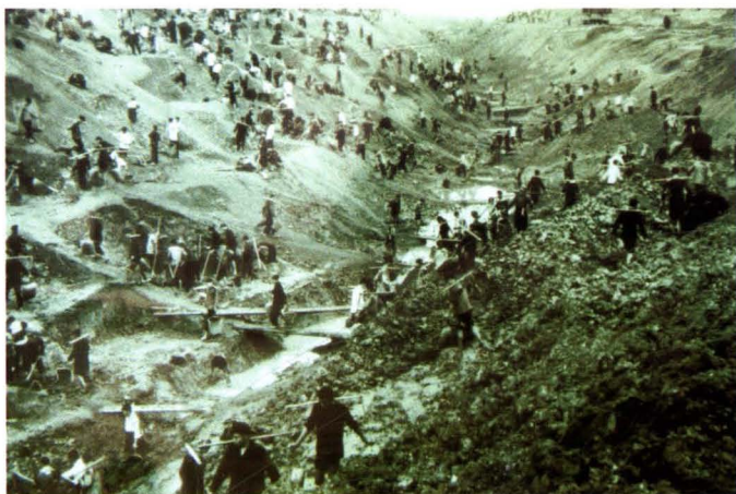
1965年冬，修建韶山灌区左干渠，万人奋战黎树塘。