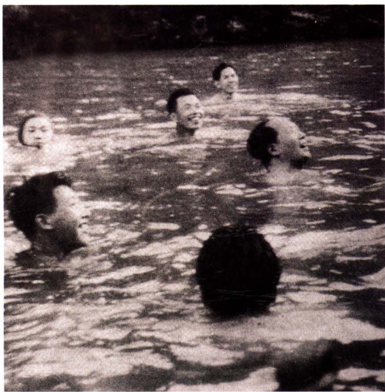
1959年6月毛泽东在韶山水库游泳