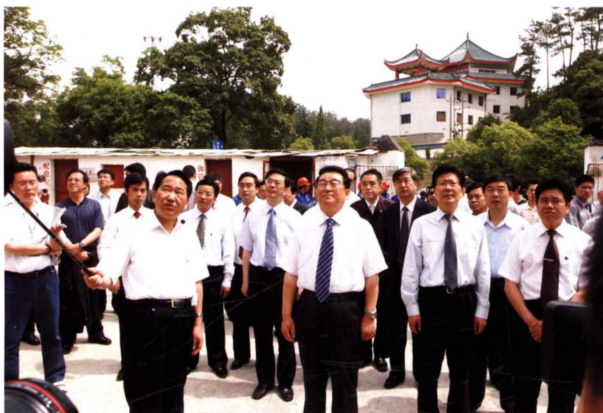
2007年5月，中共中央政治局常委李长春在中共湖南省委书记张春贤、省长周强等领导陪同下，来韶山视察。