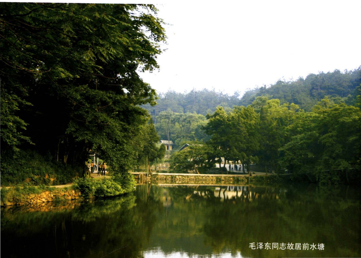
毛泽东同志故居前水塘