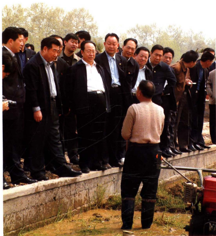
2004年4月5日，中共中央政治局委员、国务院副总理回良玉在中共湖南省委书记杨正午、省长周伯华陪同下到韶山视察农田水利建设，并与农民交谈。