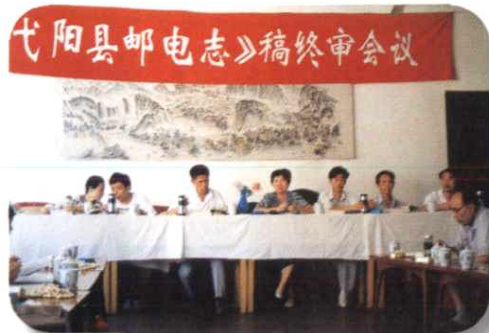
《弋阳县邮电志》终审会议