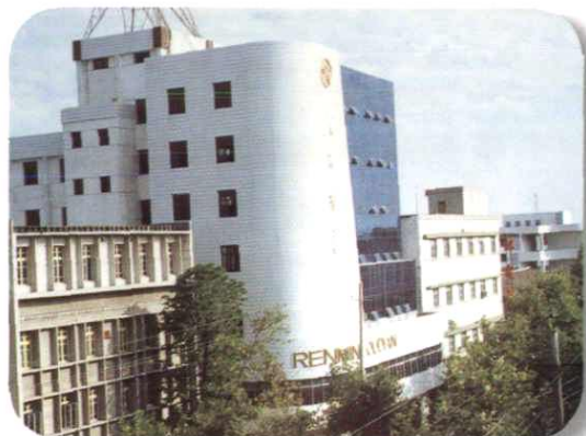
邮电综合大楼外景