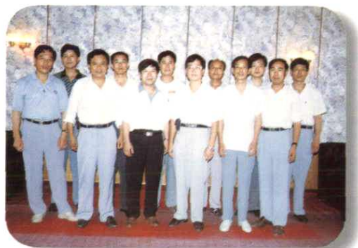
《弋阳县邮电志》编辑委员会成员合影