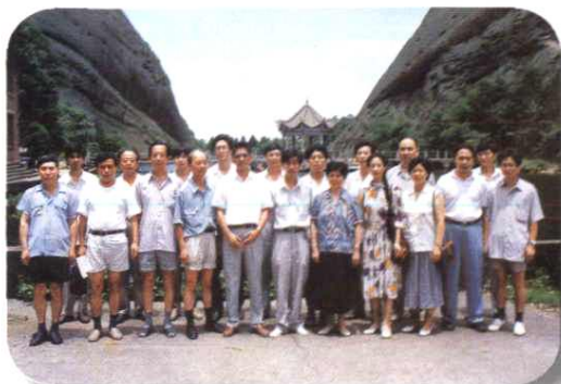
《弋阳县邮电志》终审会议全体与会人员合影