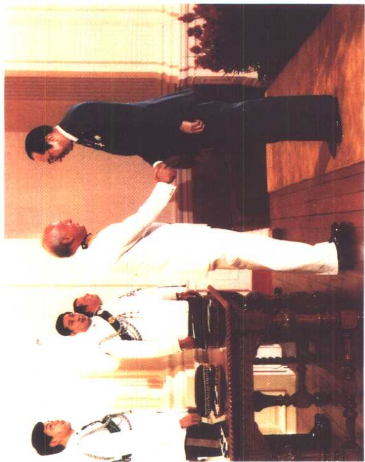
7. 前任港督尤德爵士代表英女皇授勋予李东海先生