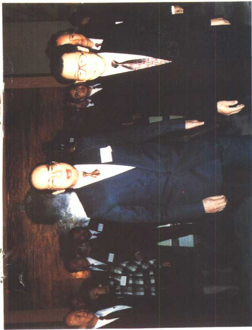
1. 全国政协主席李瑞环接见全国政协常委李东海先生时合照。