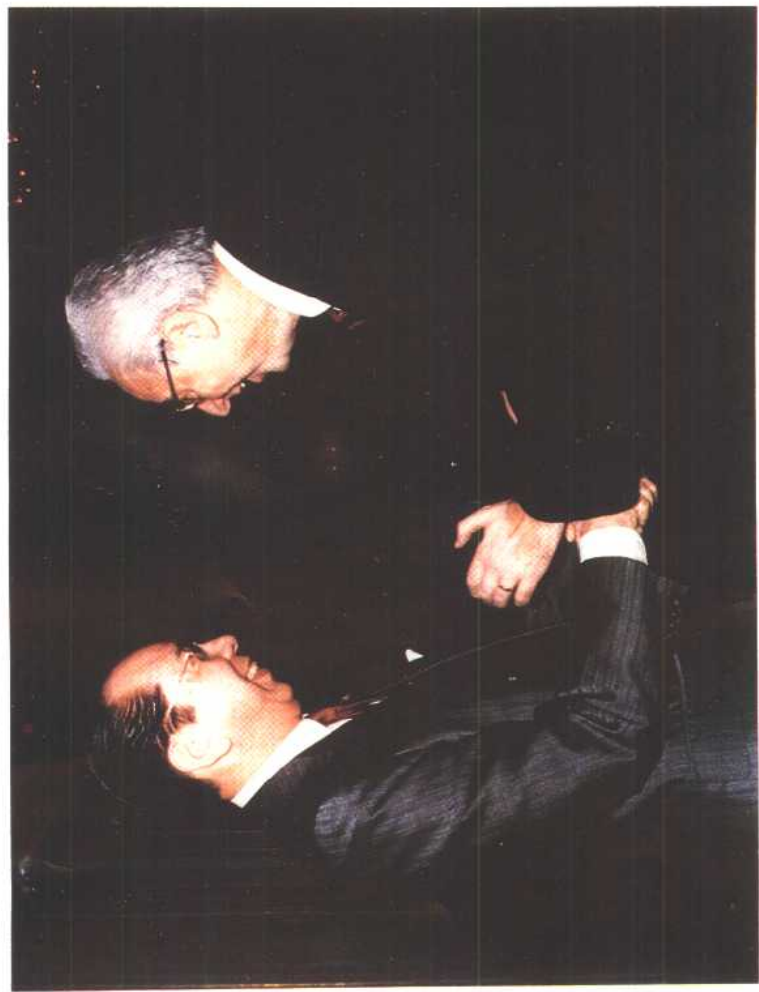
3. 1989年意大利总统科西嘉热烈欢迎李东海先生访问意大利