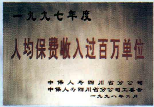
部分获奖荣誉称号