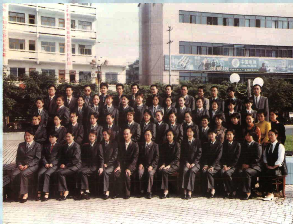
全体员工合影(1999年12月)