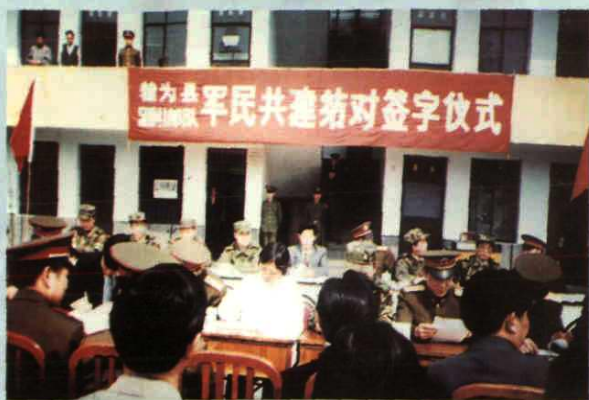
在创建“拥军爱民县”中 与56041部队25高炮连结对签字仪式