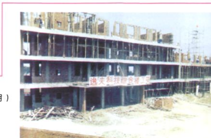
■ 正在建设中的逸夫科技楼 (1997年7月)