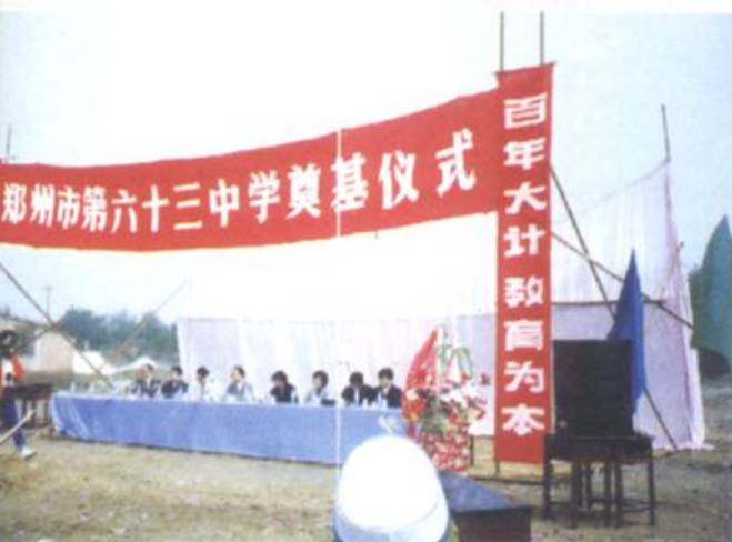
■ 郑州市第六十三中学奠基仪式 (1996.5.4)