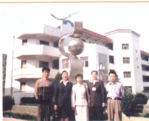
◆ 市教育局副局长王海云到学校指导工作