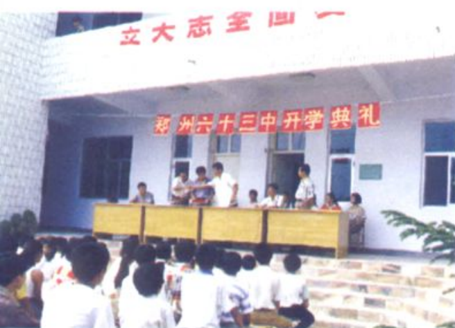
■ 1996年郑州市第六十三中学首次 开学典礼