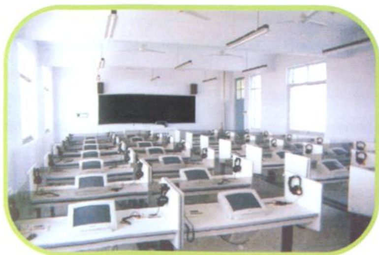
● 视听合一的语言教室