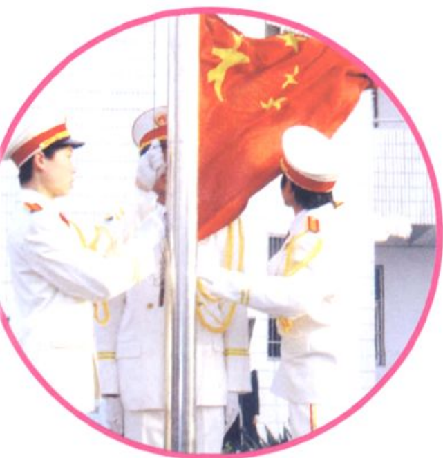
■ 隆重而庄严的升国旗仪式