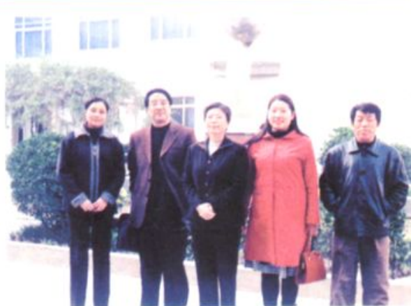
◆ 市教育局党委副书记王霄鹏等到学校指导工作