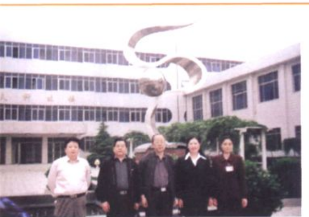
◆ 郑州市政协副主席、市教育局副局长邓庆洲到校指导工作