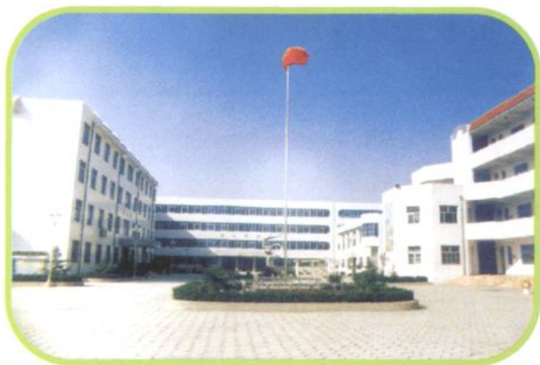
● 整洁靓丽的郑州六十三中