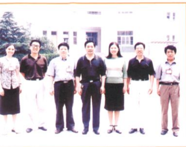
◆ 郑州市教育局党委书记，局长司福亭等到学校指导工作。