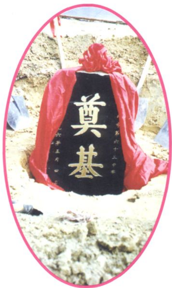
■ 郑州市第六十三中学基石 (1996.5.4)