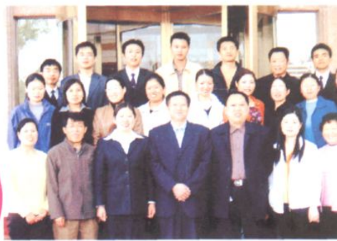
■ 郑州市教育局副局长魏诗文和德育研讨会全体与会人员合影。