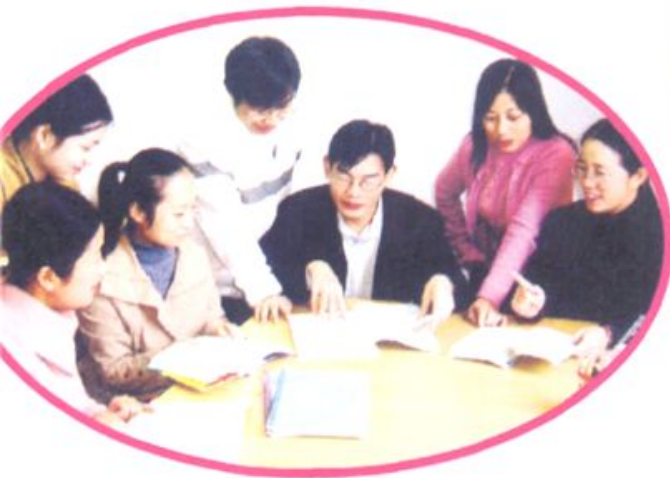
■ 刻苦钻研、辛勤耕耘——这是郑州市先进教研组数学组的老师们在集体备课。