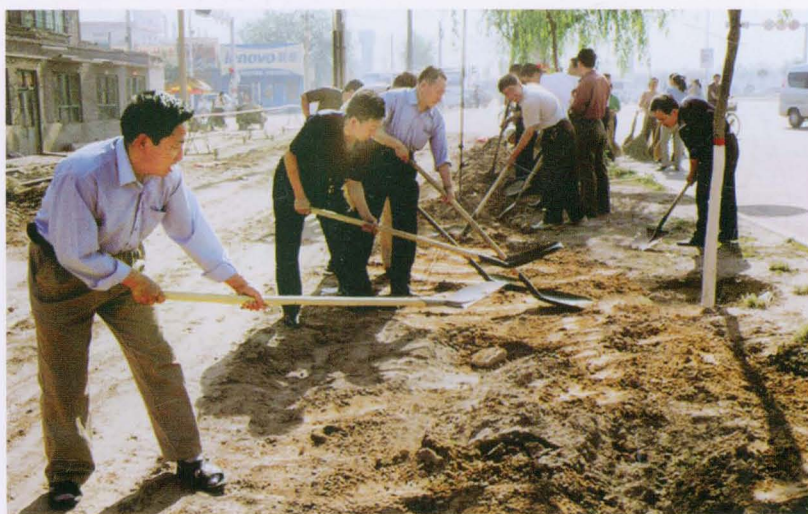
平遥县财政局机关干部职工参加义务植树活动