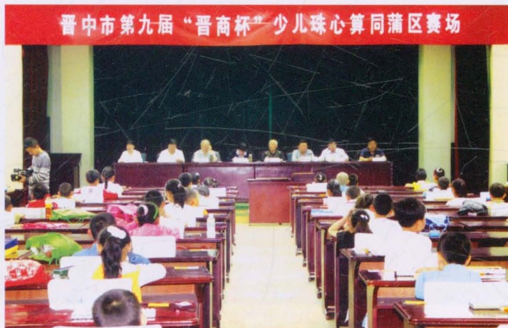
“晋商杯”少儿珠心算比赛现场