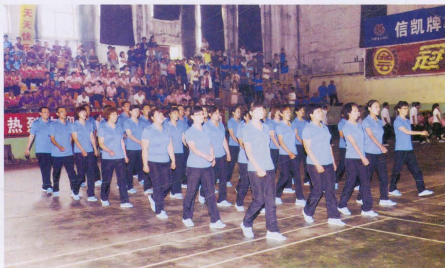
2013年平遥县财政局职工参加全县广播操比赛