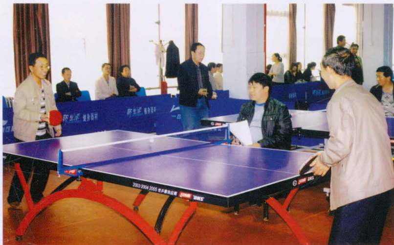
平遥县财政局机关干部举行乒乓球比赛