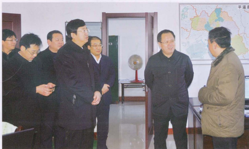
中共平遥县委书记卫明喜、县长曹治胜慰问干部职工