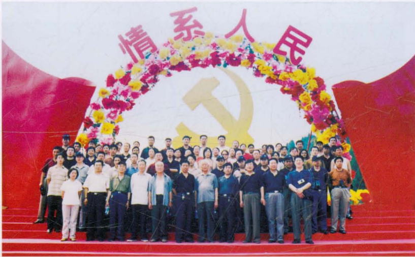
2004年7月平遥县财政局党员赴西柏坡接受革命传统教育