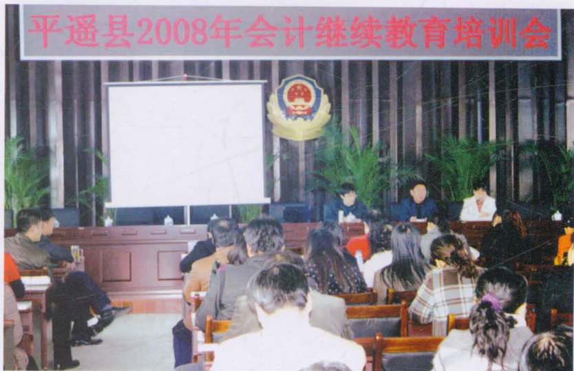
2008年会计继续教育培训会