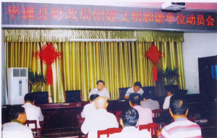
2011年平遥县财政局创建文明和谐单位动员会