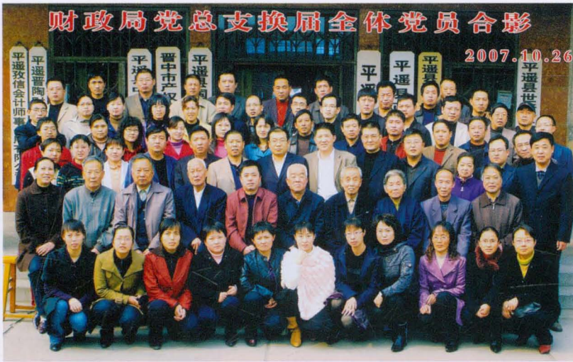
2007年平遥县财政局党总支换届党员合影