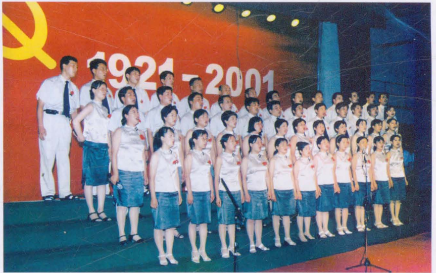
建党80周年平遥县财政局参加全县组织的歌咏比赛