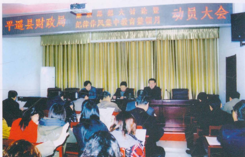
2012年10月平遥县财政局召开纪律作风教育整顿活动