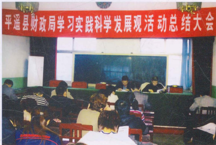
平遥县财政局学习实践科学发展观总结会