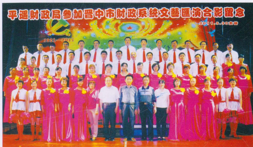
2011年平遥县财政局参加晋中市财政系统文艺汇演