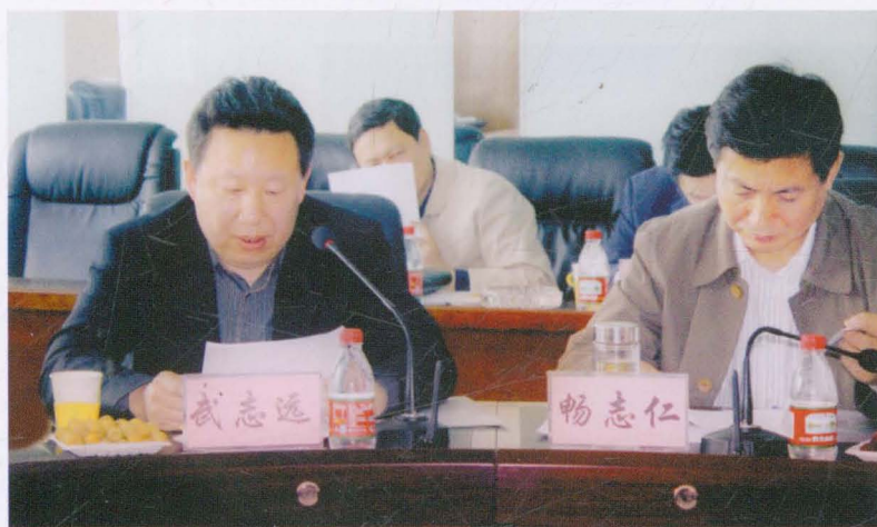
晋中市副市长畅志仁、市财政局局长武志远莅平调研指导工作