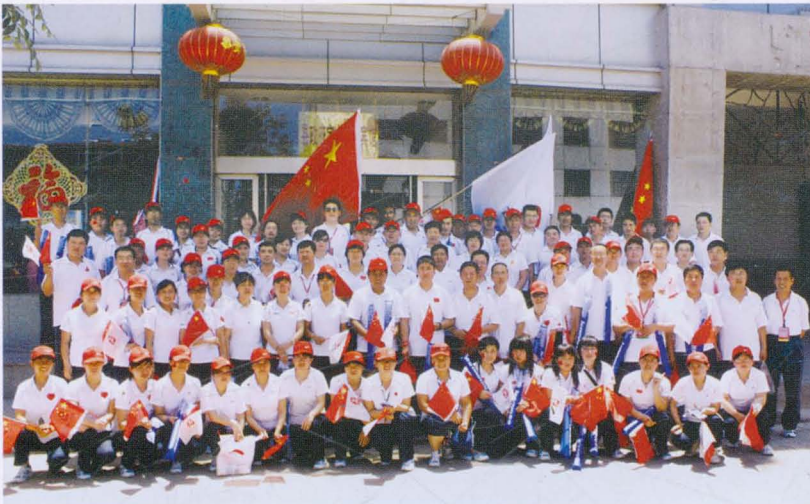
2008年6月平遥县财政局干部参加迎奥运火炬传递活动