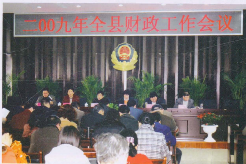
2009年平遥县财政工作会议