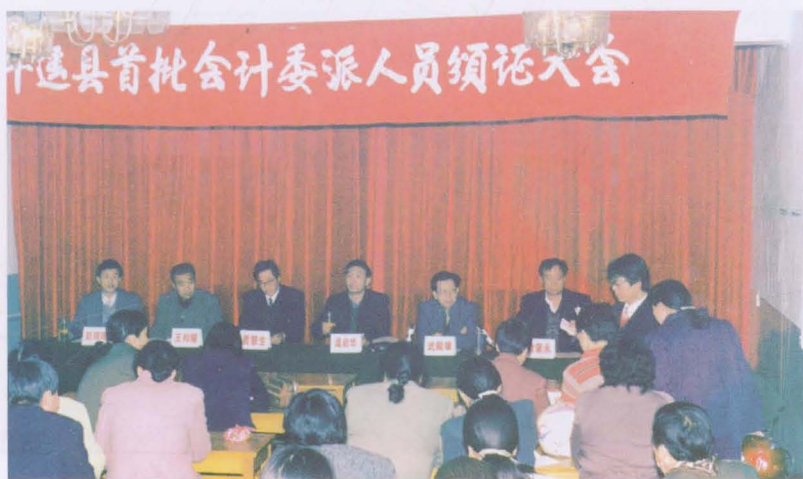
1998年12月平遥县首批会计委派人员颁证大会