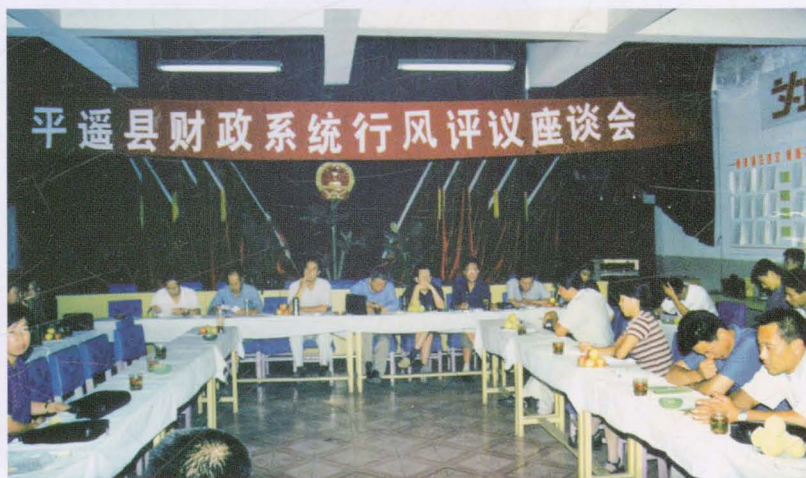
2001年6月召开行风评议座谈会