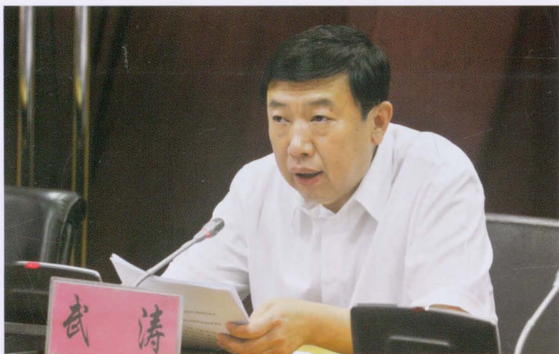
山西省财政厅厅长武涛莅平调研指导工作