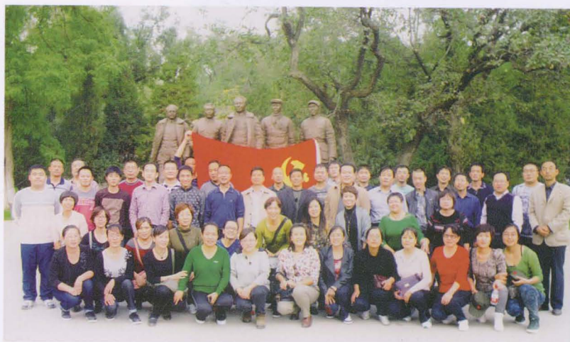
2010年7月平遥县财政局党员赴延安参加红色教育活动