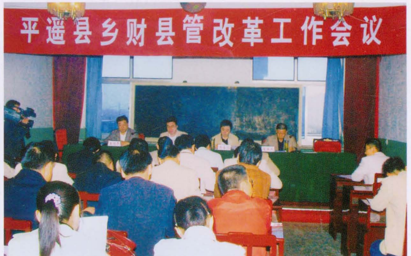
2007年9月召开乡财县管改革工作会议