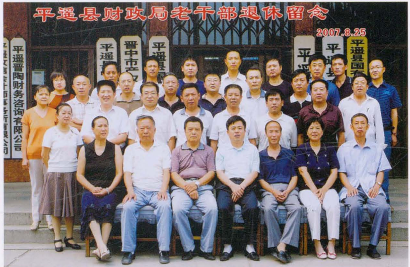
2007年8月平遥县财政局老干部退休留念