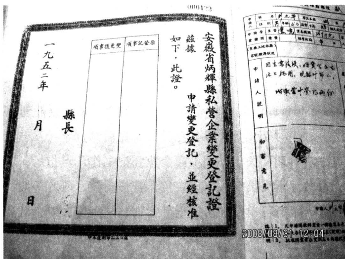
建国初炳辉县（今天长市）的私营企业变更登记证

（各种行业）349户。其中定城有16个行业，个体户480户。定炉两镇工业产值为371万元。经过三年经济