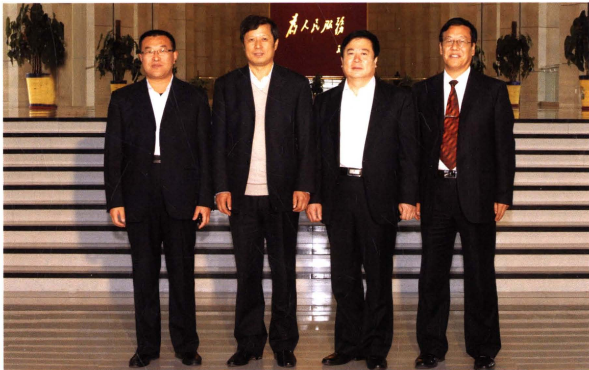
临河区统计局李鹏局长（左一）与国家统计局副局长许宪春（左二）、自治区统计局局长胡敏谦（右二）、巴彦淖尔市统计局局长许多文（右一）合影