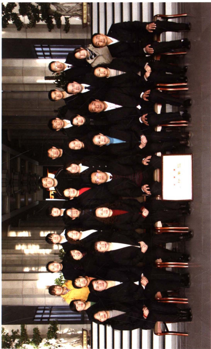
临河区统计局全体干部合影