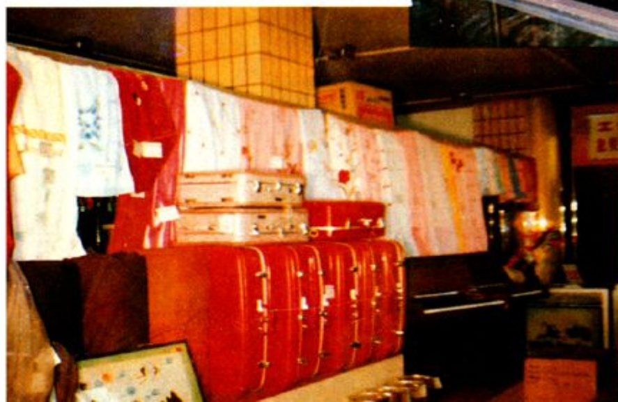
18、纺织品皮箱及 床上用品