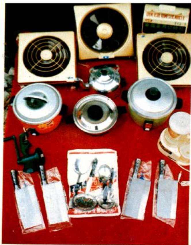
19、换气扇电吹风电饭锅绞肉 及刀铲瓢勺