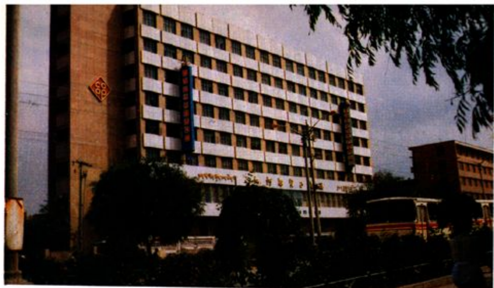
1、江河源贸易 大楼（省土产畜 产品公司展销暨办 公大楼）