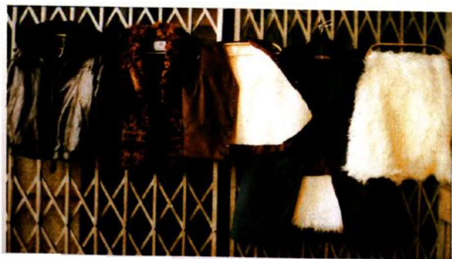
3、皮夹克 及裘皮制品