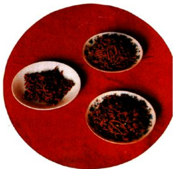
2、青海土特产 — 蕨麻（人参果）