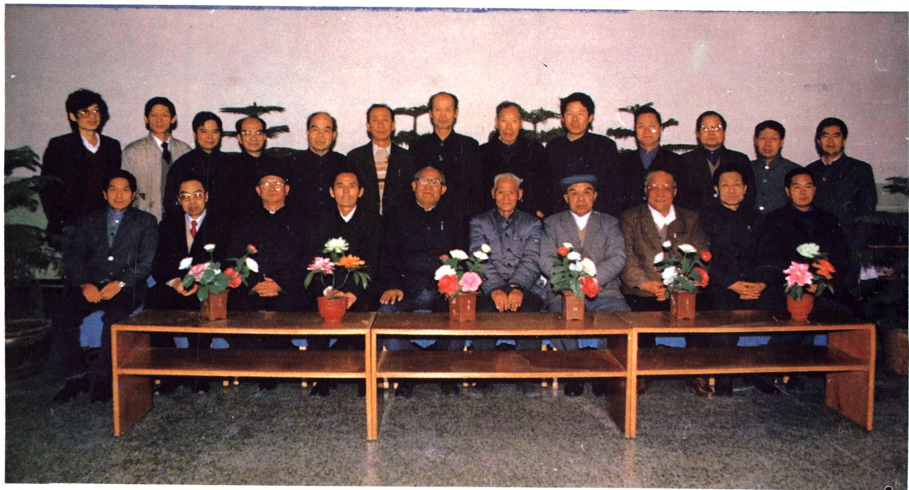
参加《新疆工商税收志》会审会议全体同志合照。