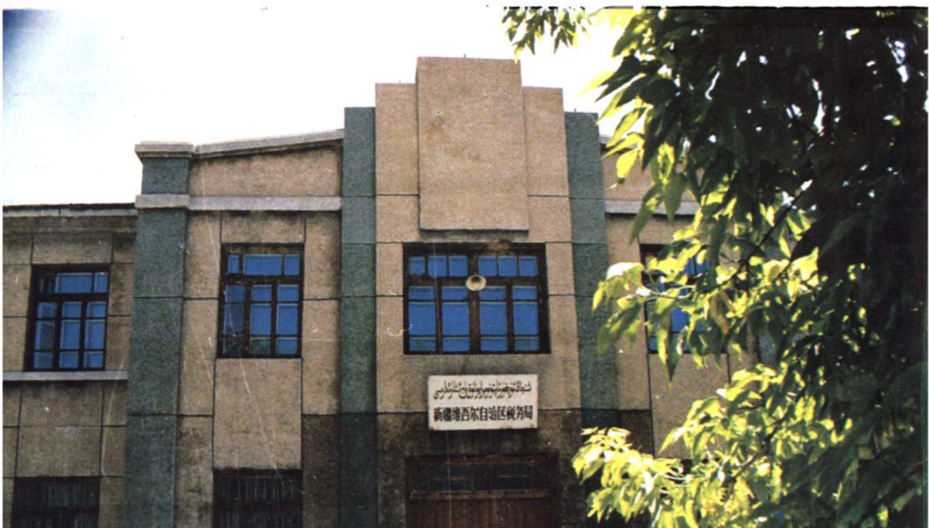
原有办公楼房正面