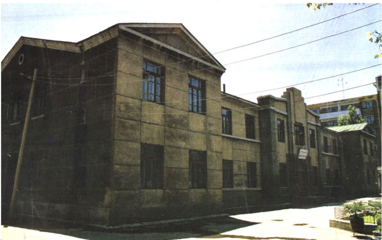
原有办公楼房侧面