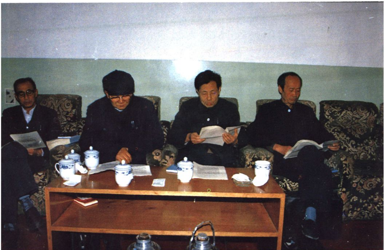
《新疆工商税收志》会审会议进行情况之二。