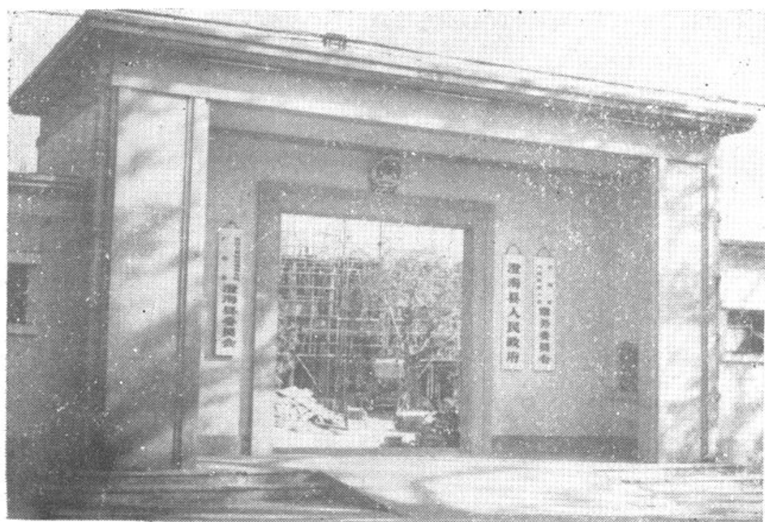
①澄海县人大常委会、县人民政府、县政协机关大门