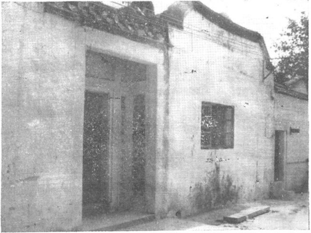
②1980.12—1985.12澄海县政协办公室地址（文祠路7号）