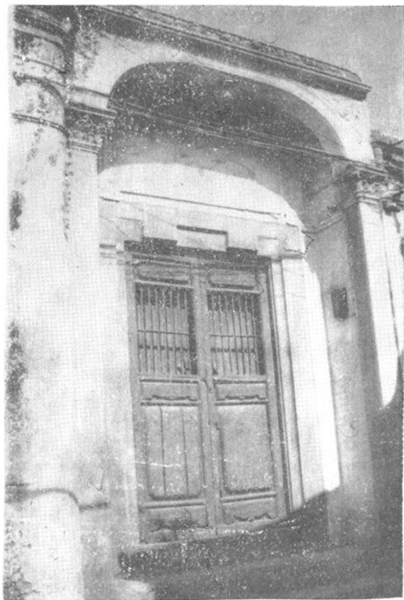
③1986.1—1987.3澄海县政协办公室地址（怀安巷5号，俗称“三格门第”）