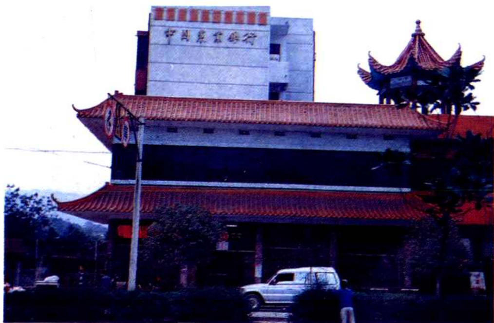
城关信用社营业大楼。