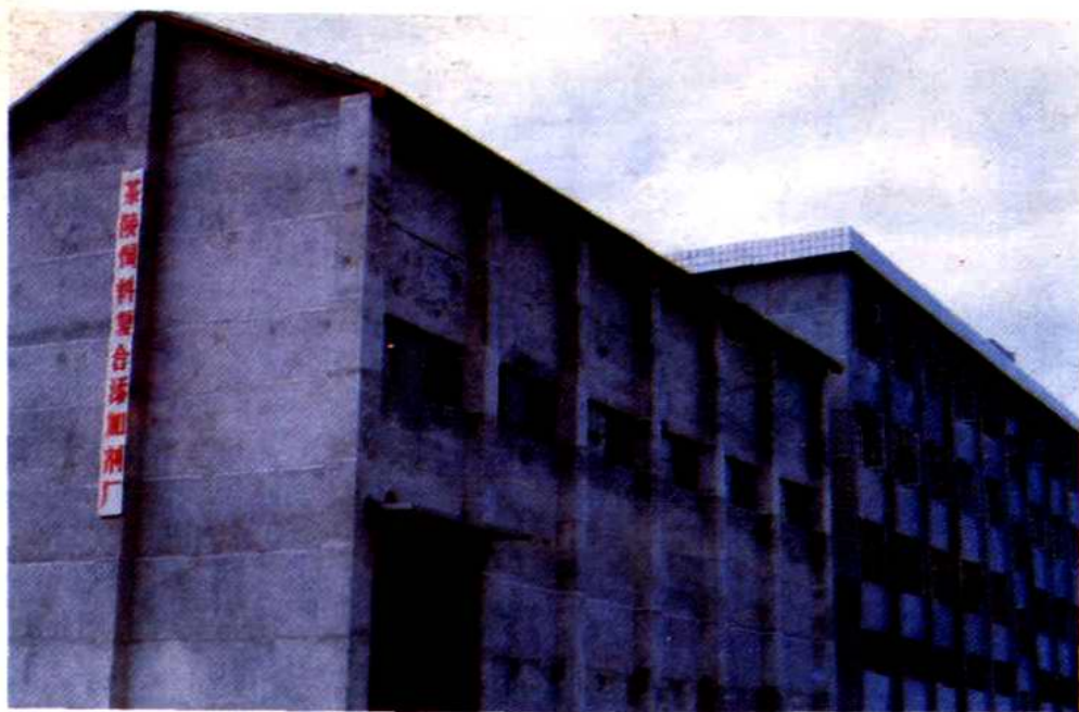
茶陵饲料复合添加剂厂一角。