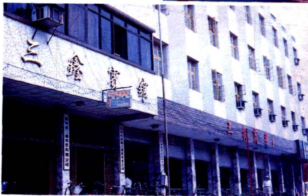
城关镇腊园街三鑫宾馆。