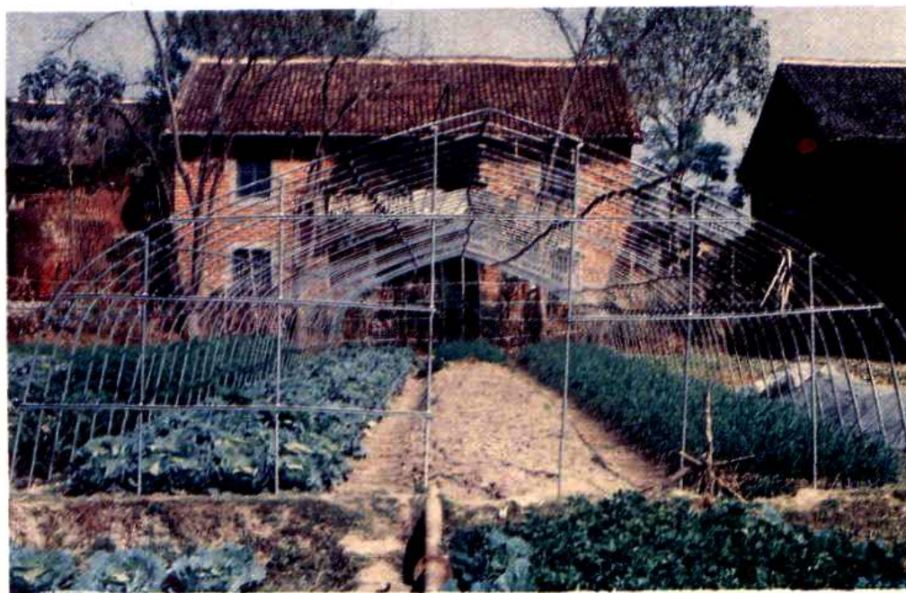
城关镇发展高效农业—蔬菜钢架棚育苗基地之一。