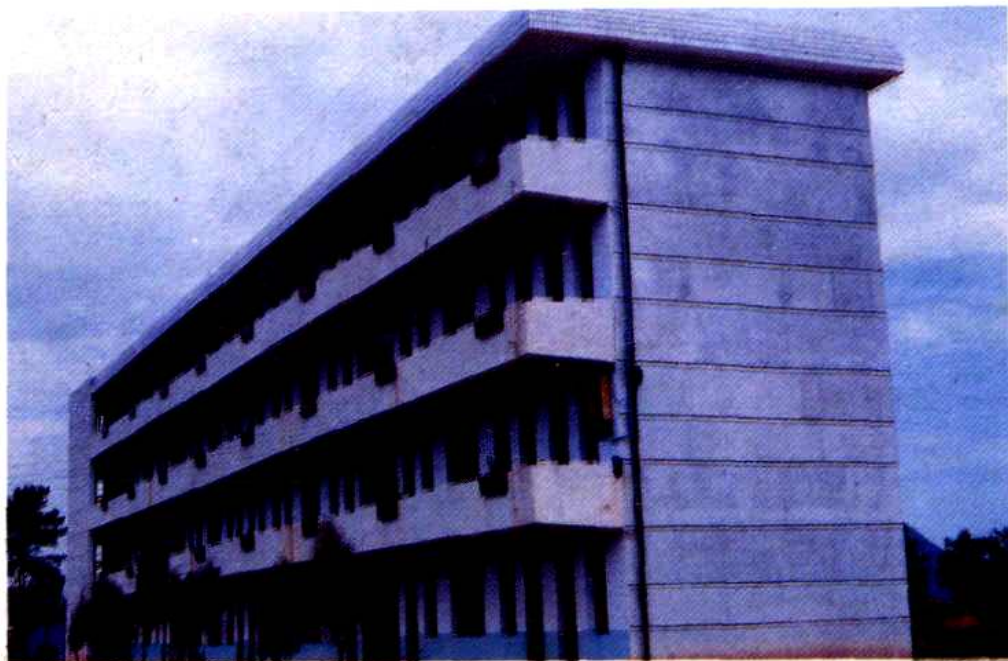
城关中学教学大楼。