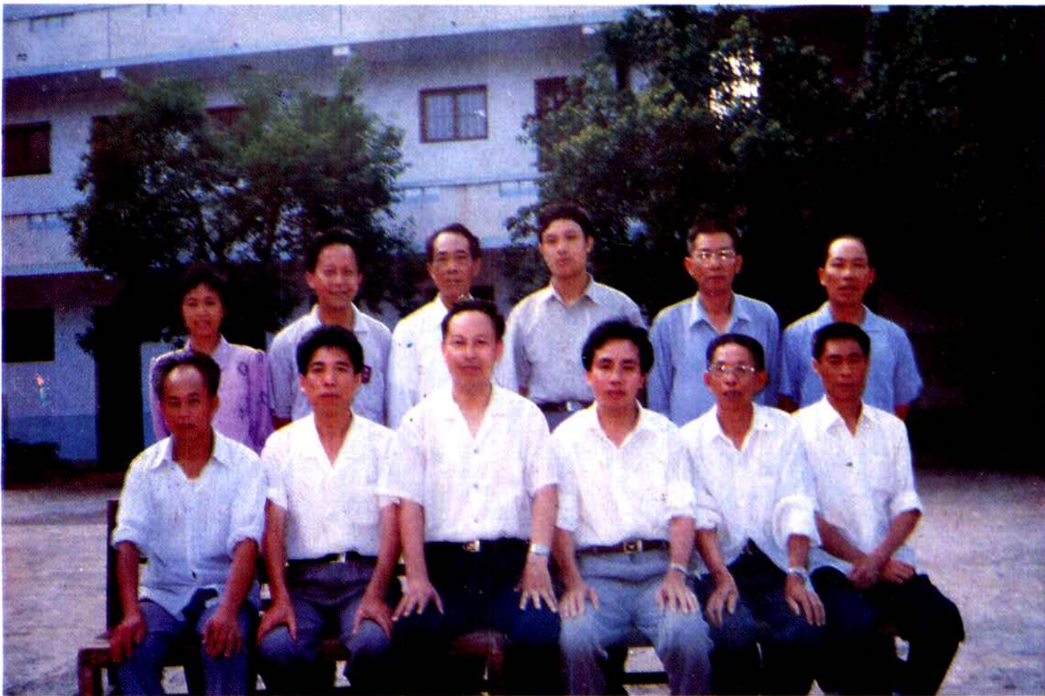
城关镇党委、人大、政府领导成员合影。