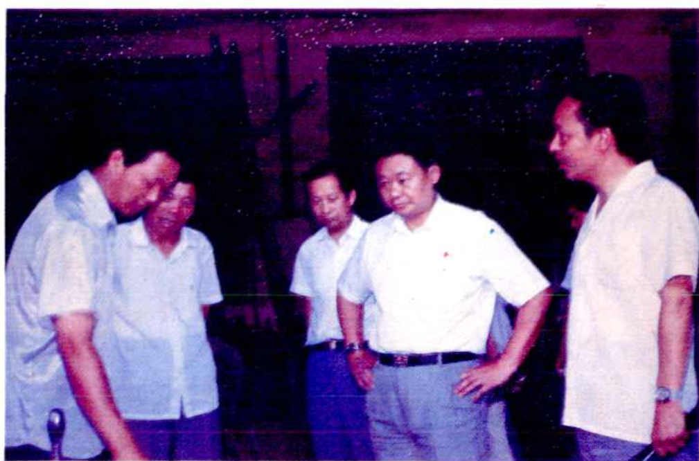
湖南省常务副省长王克英同志于1992年6月视察镇电线厂。