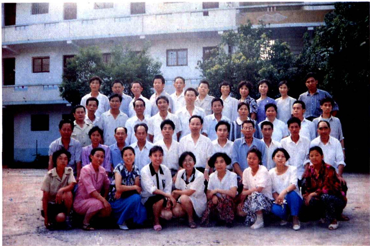
城关镇机关全体干部、职工合影。