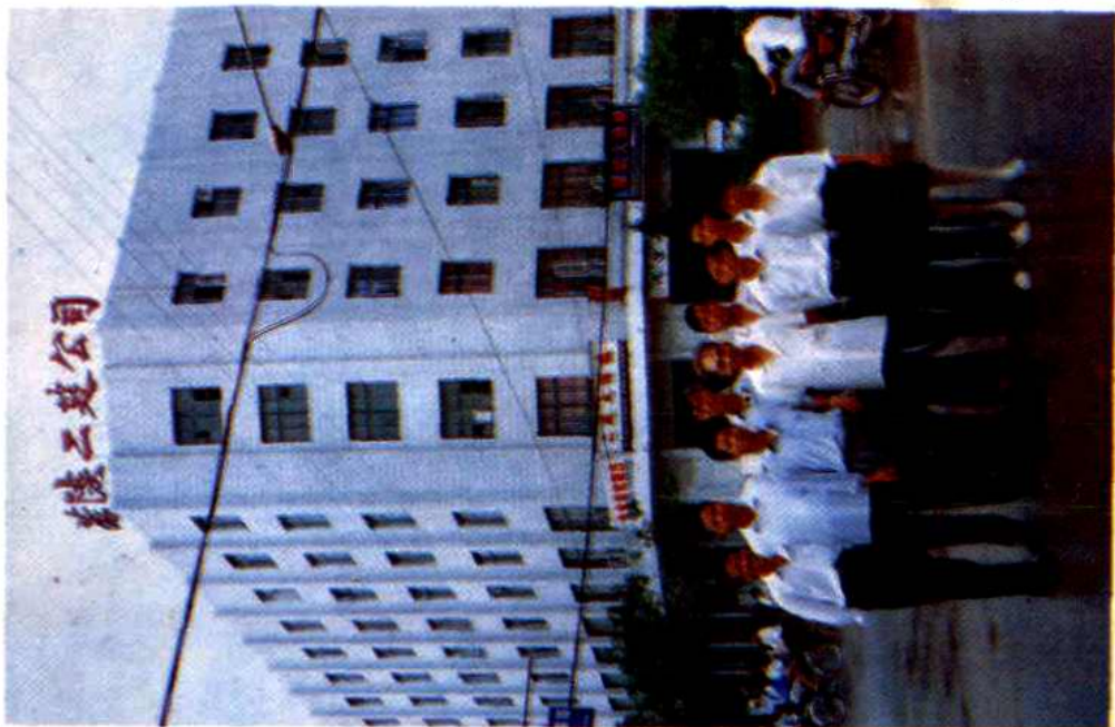
茶陵二建公司全体领导成员留影于综合大楼。