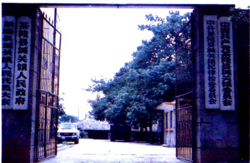
城关镇党委、人大、政府办公楼。