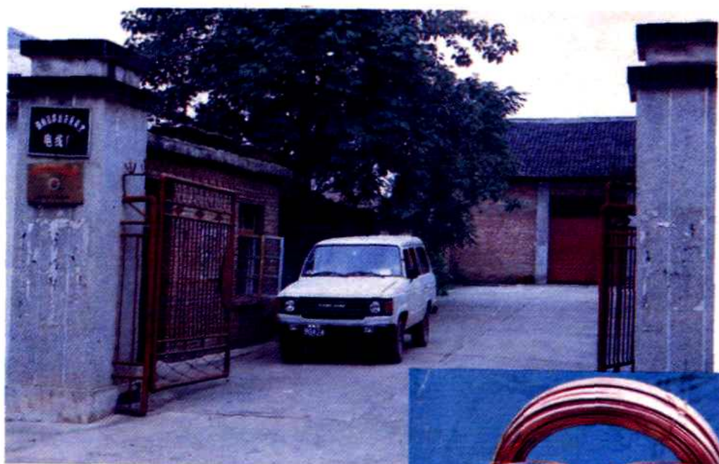
城关电线厂厂部及主要产品。