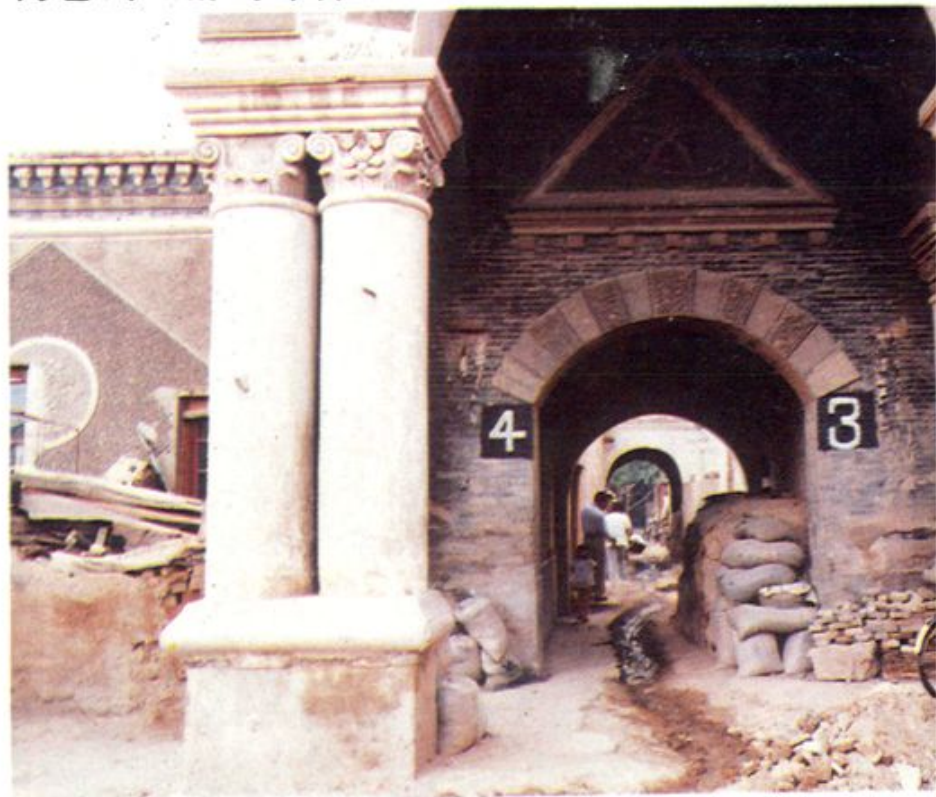
伪包头城防司令部