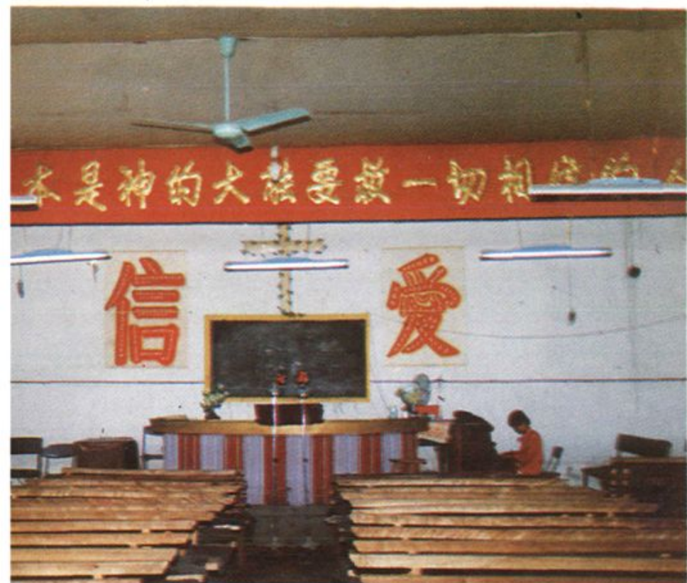
东河区大圪料街基督教堂