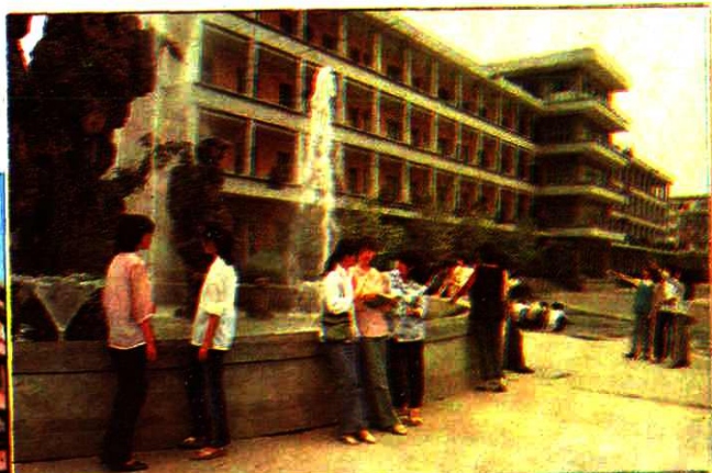
▲ 省重点中学 - 资阳中学校园一瞥