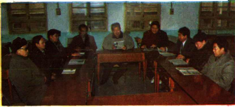
局机关团支部开展活动