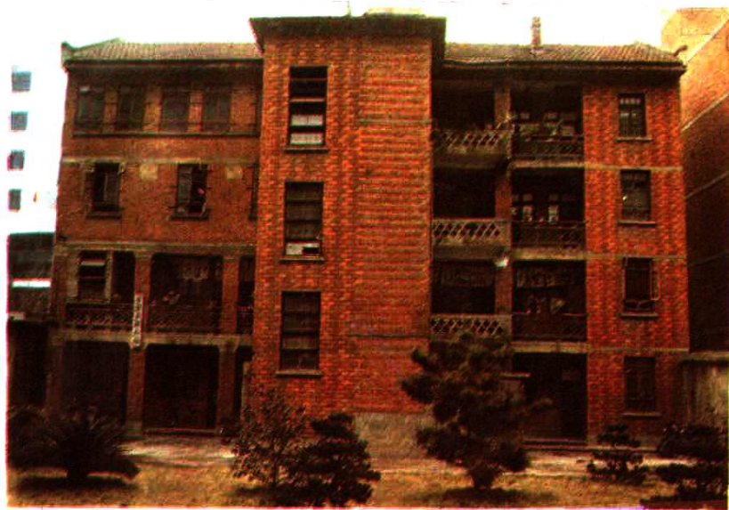
▲ 原资阳县财政局办公大楼