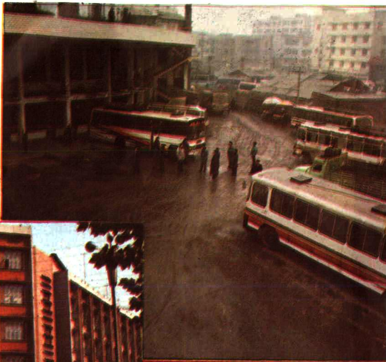
县运输公司 客运中心