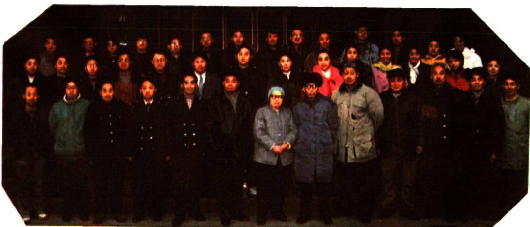
▶ 本志编纂及参予支持 的人员和领导合影