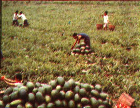
▲ 祥符西瓜生产基地