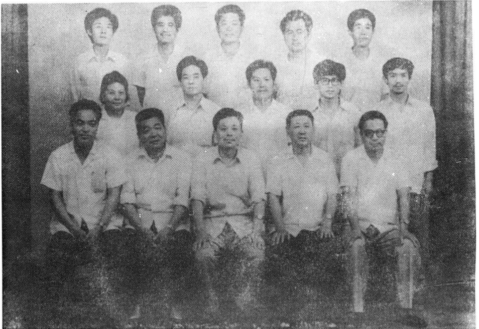
泗水县卫生局全体成员