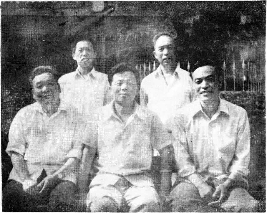
中共泗水县卫生局党委成员（1984年机构改革后）