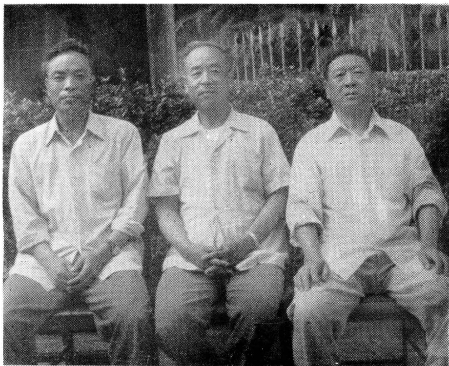
泗水县卫生局领导成员（1984年机构改革前）