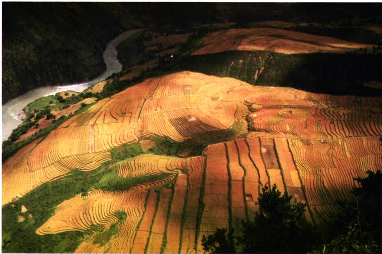
大峡谷深处——丙中洛商品粮基地