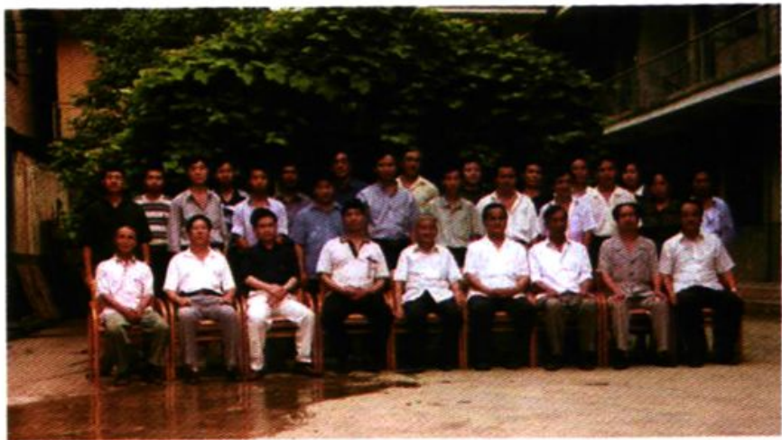
州财政志稿评审会议合影