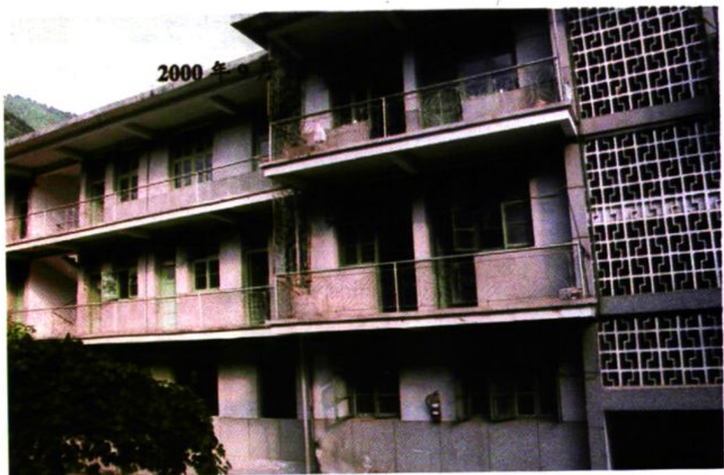
自治州财政局办公大楼