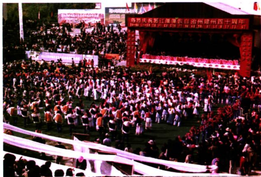
自治州四十周年庆典活动