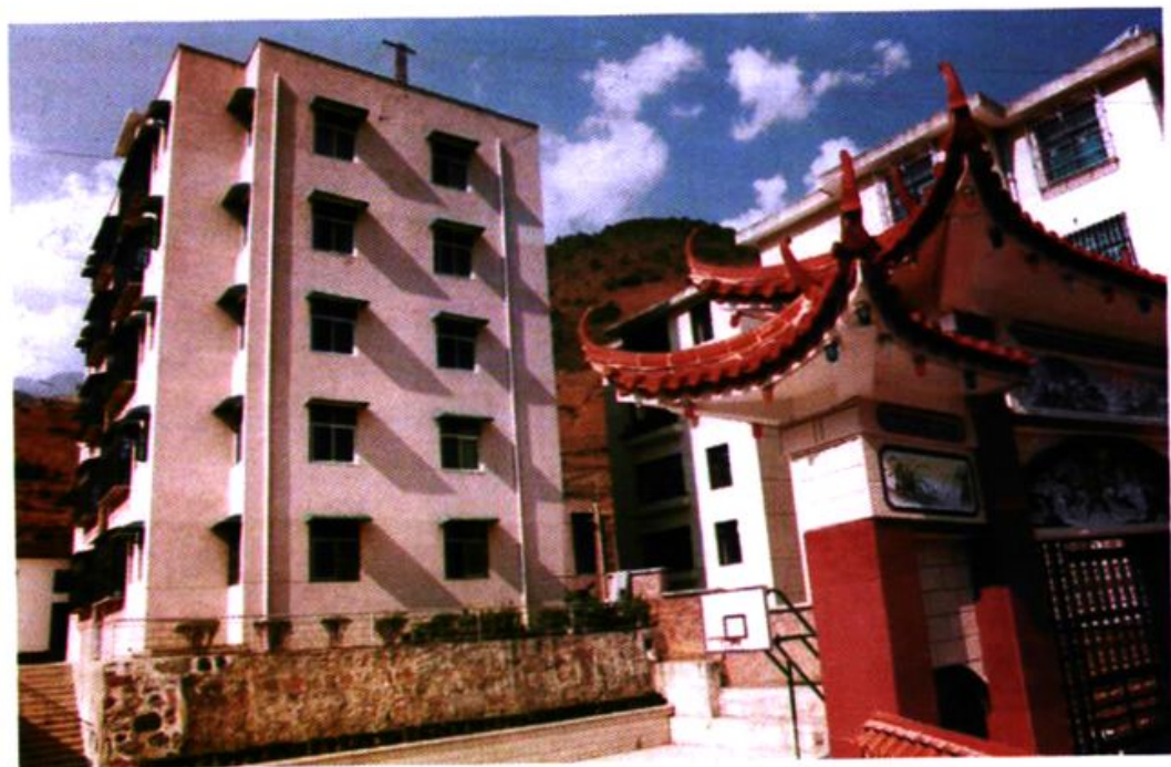
干部职工住宅区一角