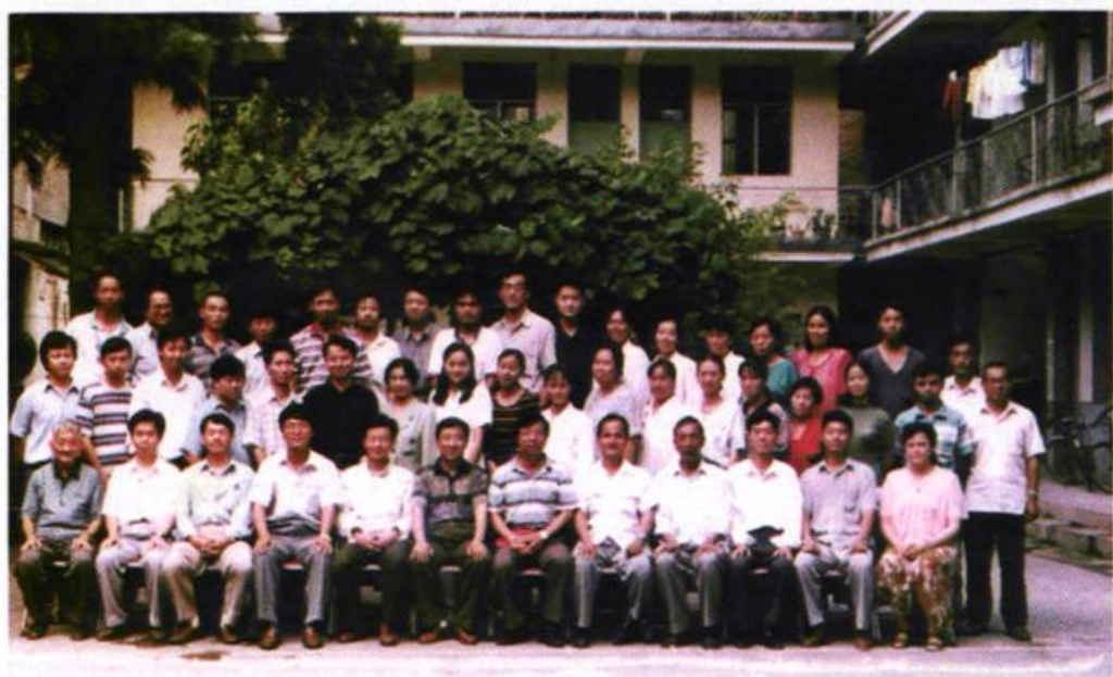
1997年省财政厅副厅长赵钰到怒江州指导工作时与州财政局职工合影