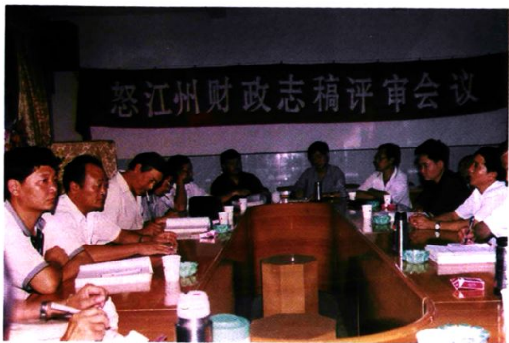
州财政志稿评审会议会场一角