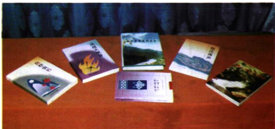
自治州民族印刷厂印刷产品