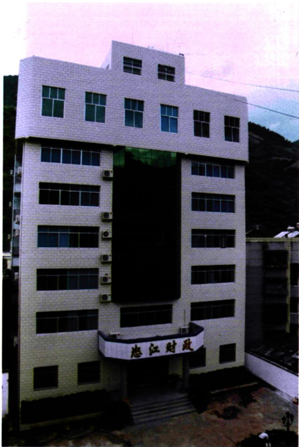
2001年8月竣工的自治州财政局办公大楼