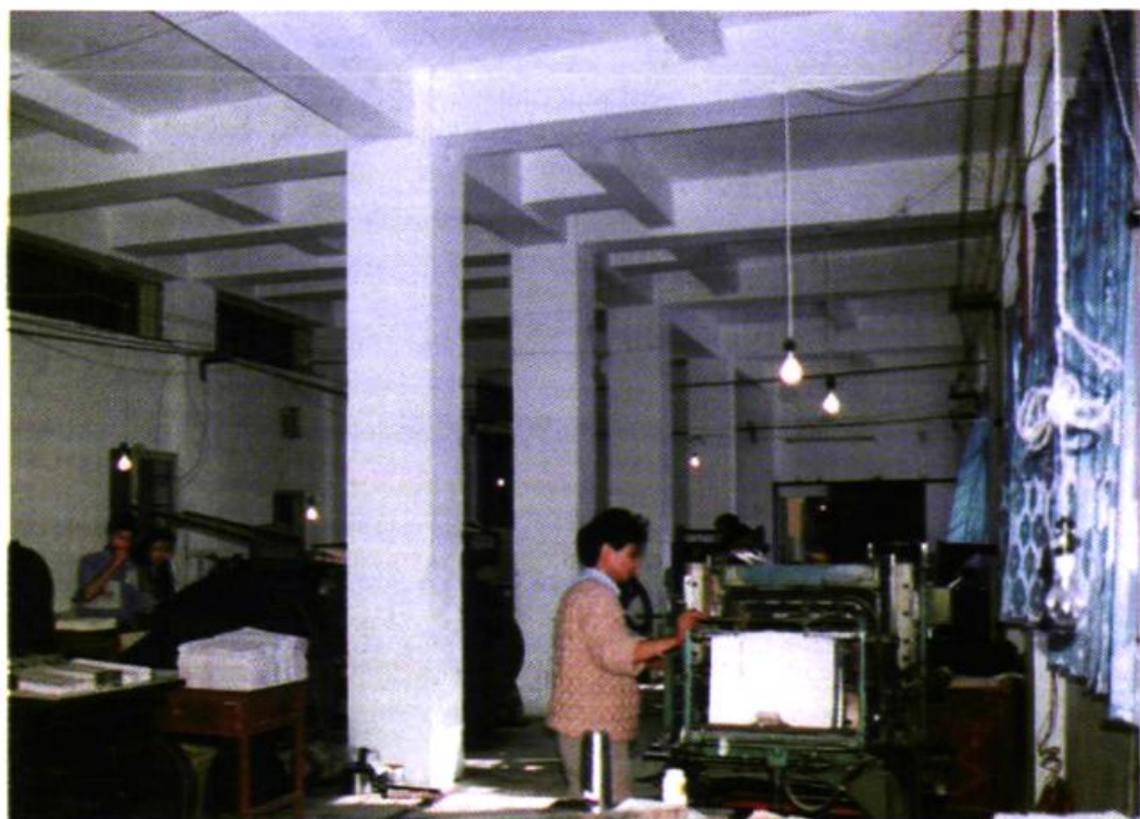
自治州民族印刷厂生产车间