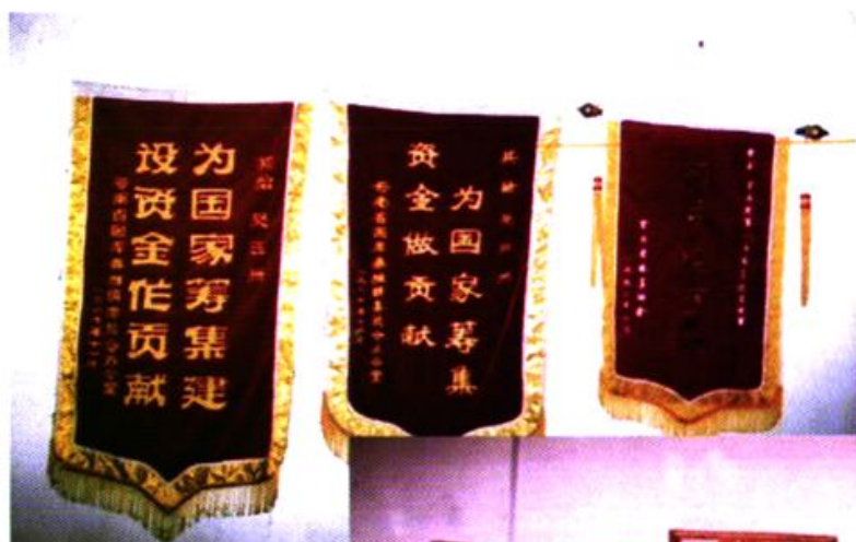
州财政局 获州级以上表 彰的部分奖状 锦旗