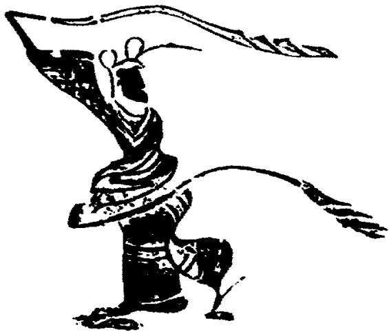
图5-2 河南郑州新通桥西汉晚期空心砖长袖舞

西汉王朝建立后,立即面临着用什么样的政治理论去治理国家,即建设一种什么样的政治文化的问题。秦王朝用法家理论治国,仅仅15年就家破国亡了,这一点西汉统治者已经看得很清楚。然而,自春秋战国以来的诸子百家学说,尽管都是为统治者提供治国的政治理论的,但是除了法家已被证明是失败的之外,