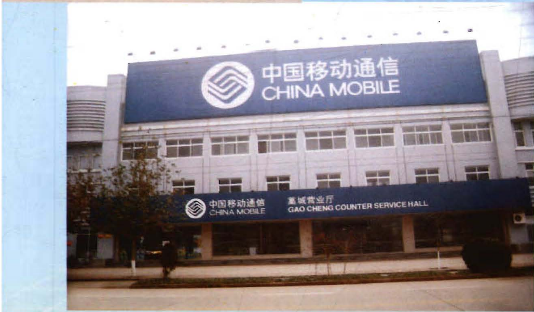
移动通信分公司办公楼