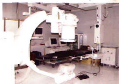
大型C臂血管造影数字减影系统

近年来，医院加大科技投入，重视人才培养。相继开展了肝叶切除术、腹腔镜下行子宫全切术、胆囊切除术、前列腺气化电切术、胆道镜下胆总管取石术、同种异体骨移植术、全髋全膝关节置换术以及各种肿瘤的手术、放疗、化疗、介入治疗术、大小脑膜肿瘤切除术、颅内血肿碎吸术、人工晶体植入术、牙再植术、脑血管造影术、冠脉造影、周围血管造影、心导管下PDCA+支架、先心病伞堵术、射频消融术等。心血管内科被石市卫生局批准为市级医学重点发展学科。特别是各种内窥镜下的微创手术，利用大型C