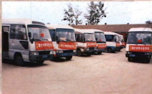
节假日，学校组织车辆免费接送学生，确保路途安全。