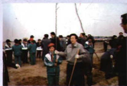
1999年副省长郭庚茂（前中）在藁城参加义务植树活动

全市果树面积20万亩，其中已结果的15万亩。近几年，大力发展林果产业，引进新技术、新品种，重点整治和培育了西四公出口梨基地、南席冬枣、西马村新品种梨、小丰村梨树高接换头、五界村果树设施栽培、北周卦小杂果、黄家庄红色梨、马邱红富士、小果庄科技示范等9个果品基地。全市年出口梨达到1.3万吨，出口16个国家。常安红色梨卖到10元一个，冬枣10元1斤。1999年“天帅牌”鸭梨在昆明世博会上获银奖，红富士苹果、黄冠梨等果品连续三年在廊坊“北方农产品博览会”上获“省优质果品”称号。同时实施省会周围绿化工程、绿色通道工程、标准农田林网工程、退耕还林工程等，全市森林覆盖率达到19%。由于成绩突出，多次被省市及藁城市