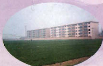
村庄节约耕地建造多层住宅楼