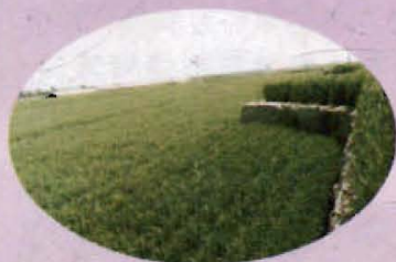
砖瓦窑用地复垦后的麦田

藁城市国土资源局位于廉州路东段，原名藁城市土地管理局，成立于1987年。其主要职责是：贯彻执行国家关于土地管理的方针政策、法律法规；管理全市土地的调（勘）查、登记、统计及征用和划拨工作；制定土地开发、复垦、保护计划；会同有关部门编制土地利用总体规划；参与大中型项目的选址、设计、审定和征地拆迁工作等。