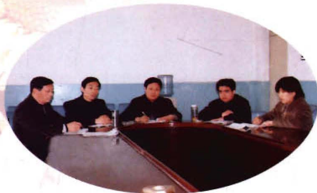
团结务实的领导班子

为“爱婴医院”，1998年被省文明委命名为“五星级文明窗口”，连续8年被石家庄市物价局命名为“物价、计量信得过单位”，多次被石家庄市委、市政府命名为“卫生工作先进单位”，被石市卫生局命名为“医院管理先进单位”，连续三年被石市技术监督局评为“质量服务双满意单位”。2002年被石家庄市委、市政府评为“文明单位”，被藁城市委、市政府评为“实绩突出单位”。