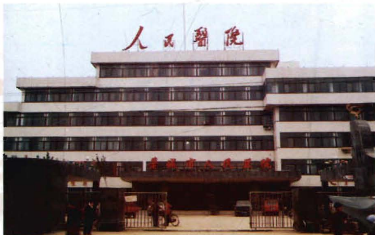
市人民医院门诊楼

藁城市人民医院始建于1947年，占地面积3.3万平方米，是一所集医疗、教学、科研、预防、保健、康复于一体的综合性二级甲等医院。