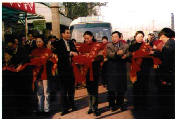
1998年12月16日，由洛阳站发往南峰公司的40路公交车开通，洛阳市政府副市长宗挺轩（右三）和市公用事业局局长杨玉龙（右五）出席开通仪式并剪彩。