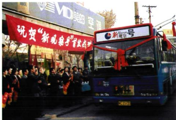
1999年1月1日，洛阳市首台以新闻栏目“新观察”命名的公交车，正式挂牌运营。