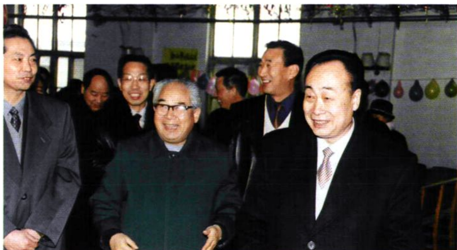
2000年2月6日中共洛阳市委副书记、市长刘典立(右一)、市人大常委会副主任赵文庭(中)等领导到二分公司慰问看望职工。