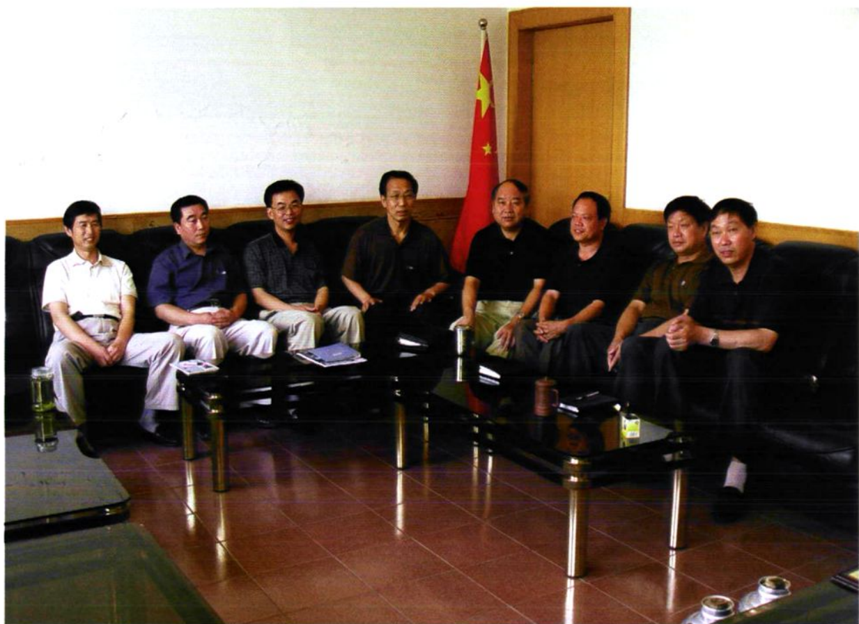
团结奋进，开拓进取的总公司领导班子