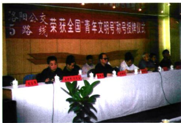
2003年4月30日，二分公司5路线荣获全国“青年文明号”授牌仪式在总公司举行。洛阳市人大副主任赵文庭（右三）、市政府副秘书长肖述金（左一）等领导及相关单位负责人参加了仪式。