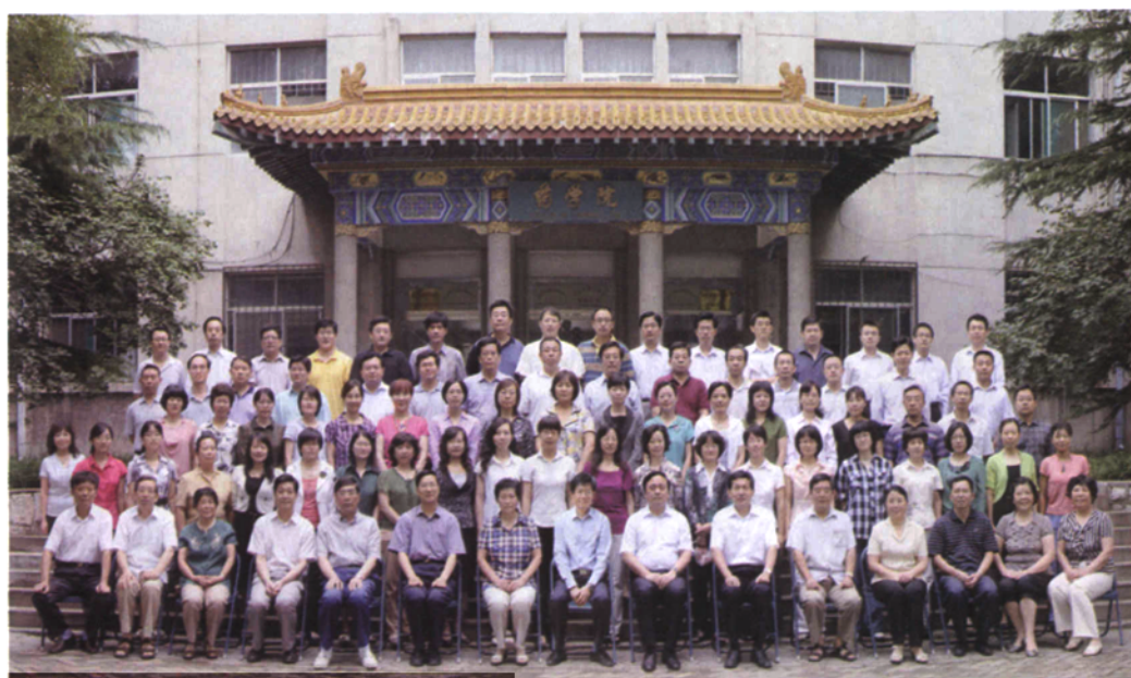
▲ 2011年，山东大学药学院全体教职工合影