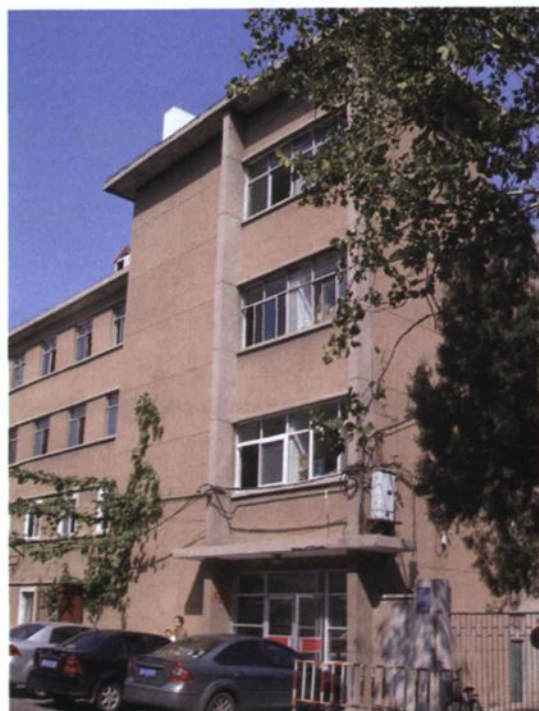
◀ 药学院综合实验楼（原药厂楼）