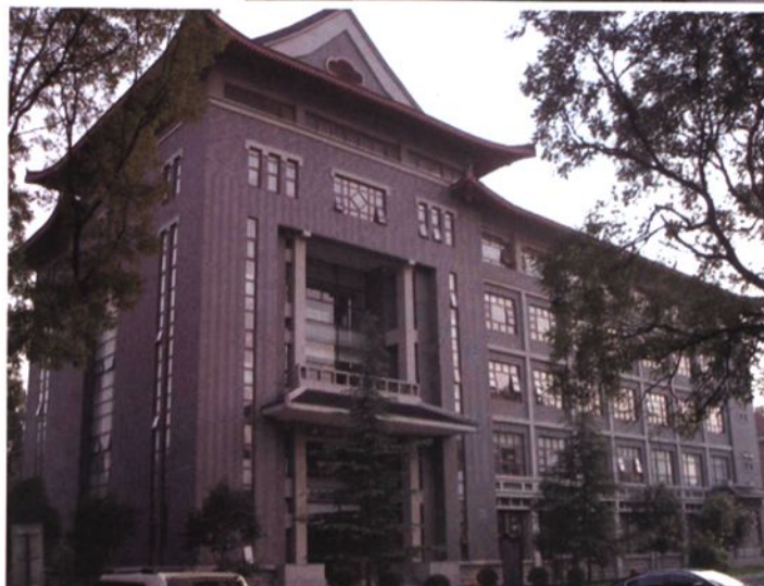
◀ 2006年建成的药学院科研大楼