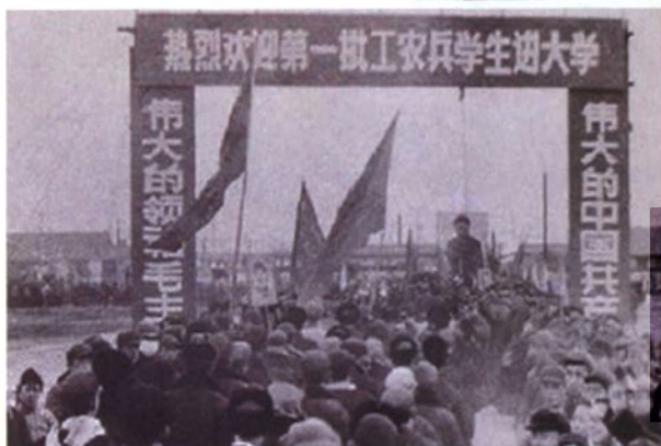
◀ 1971年，迎接第一批工农兵学员入校