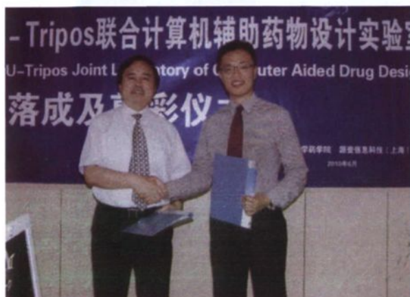
◀ 2010年6月，建立山东大学/TRIPOS公司联合计算机辅助药物设计实验室