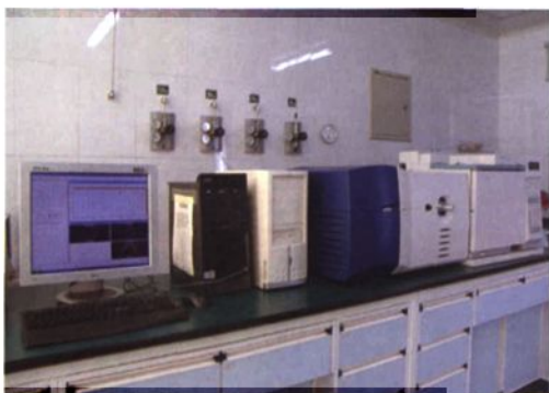
▲ GCT型高分辨气—质联用仪