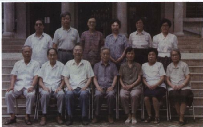
▶ 1971年重建药学系（当时属四大队药学连）时的系领导和部分教师