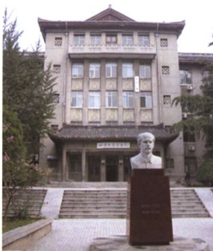
◀ 教学八楼（当时上课在教学四楼和教学八楼）