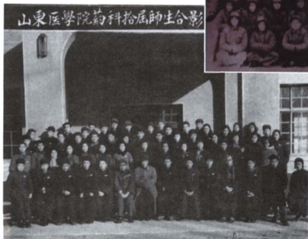
◀ 1951年，山东医学院药科师生合影