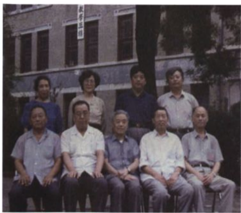
▲ 1973年底，药学系随学校由楼德迁回济南，药学连改为药学系，图为当时的党政领导