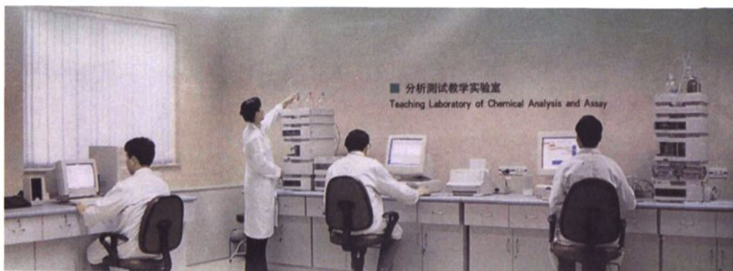
▲ 药物分析测试中心