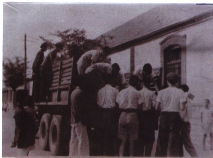
◀ 1955年，全国第二次院系调整，山东医学院药学系撤销，分别并入北京、南京、上海、四川等地院校药学系