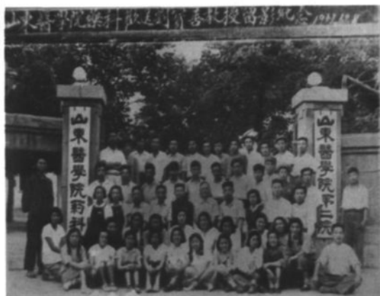
▲ 1952年全国院系调整时，齐鲁大学医学院和山东省立医学院合并为山东医学院，图为当时的校门