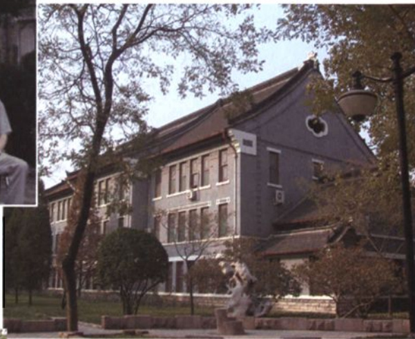
▲ 1973年，药学系党政办公室和化学教研室搬回教学三楼