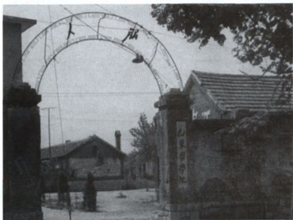
◀ 1971年，山东医学院和山东中医学院合并，药学连迁至新泰县楼德镇办学，图为当时的校门（校门内的平房为当时的教室）