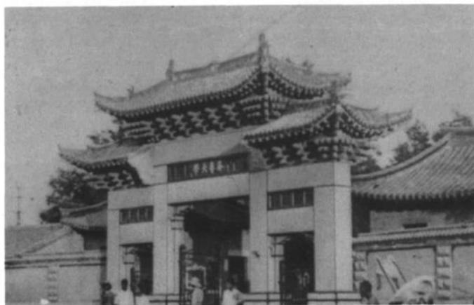
◀ 1924年，齐鲁大学校友捐款建造的齐鲁大学校门，背面刻有“校友门”字样