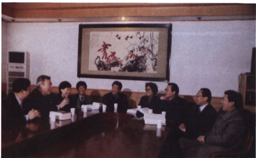
▲ 1999年，山东医科大学药学院领导和部分教师在讨论教学计划