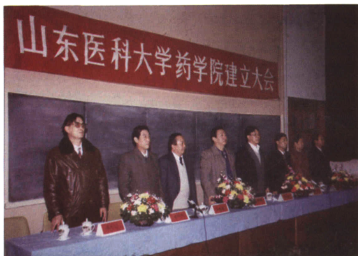
◀ 1997年，山东医科大学药系改为山东医科大学药学院