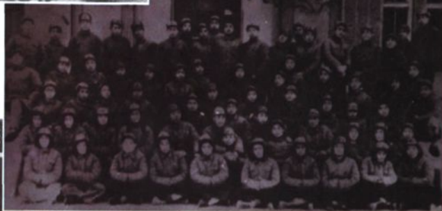
▲ 1950年，华东白求恩医学院药科四班师生合影