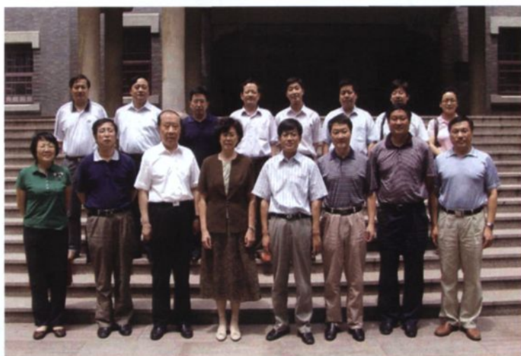
▶ 2009年6月21日，联合省内优秀药学研究力量，成立国家综合性新药研究开发技术大平台，理事会在我院召开