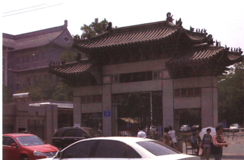
▲ 山东大学西校区（现改称趵突泉校区）校门