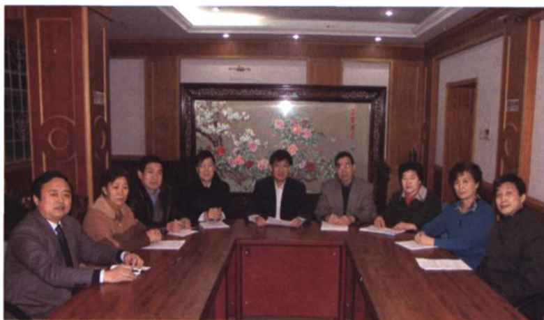
► 2004年，山东大学药学院党政领导讨论发展规划