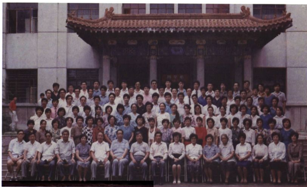
▲ 1991年，山东医科大学药系教职工合影