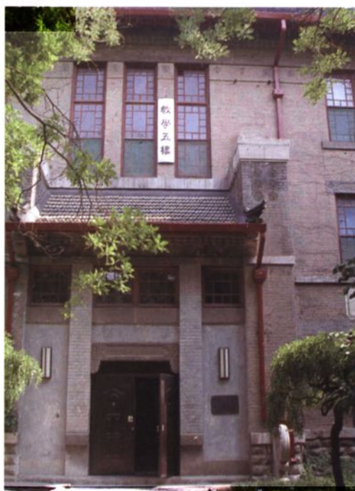
▲ 中草药学教研室搬入教学五楼