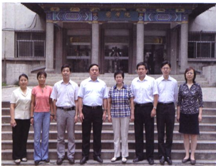
◀ 2011年，山东大学药学院党政领导