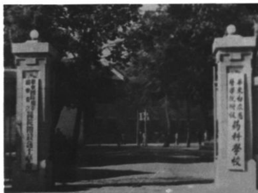
▲ 1948年，华东白求恩医学院附设药科校门