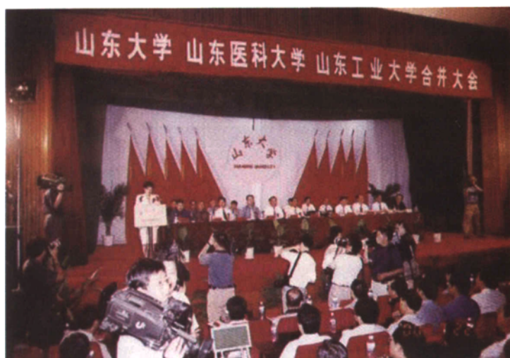
▶ 2000年，国家教育部决定山东大学、山东医科大学、山东工业大学三校合并组建新的山东大学