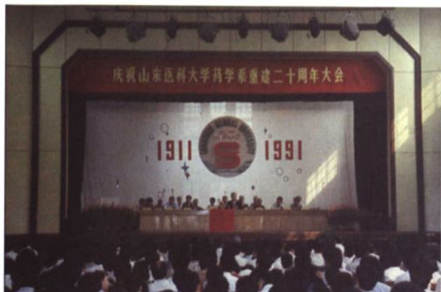
◀ 1991年，庆祝山东医科大学药系重建二十周年