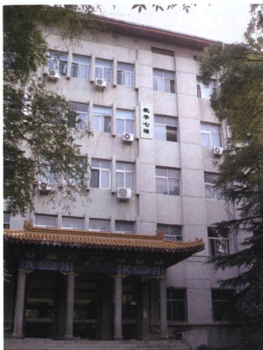
▲ 教学七楼（1987年新建的药学楼）