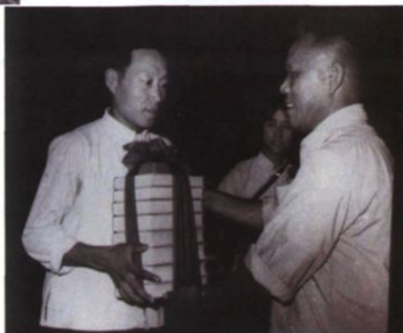
▶ 院领导给工农兵学员送“红宝书”