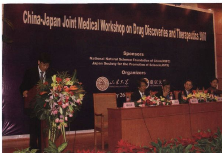
◀ 2007年9月，建立山东大学—东京大学“中日药物筛选中心”