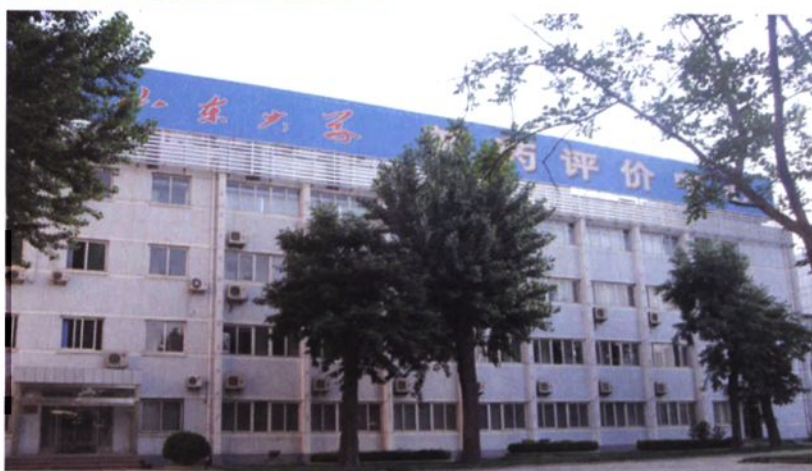
▶ 新药安全性评价中心