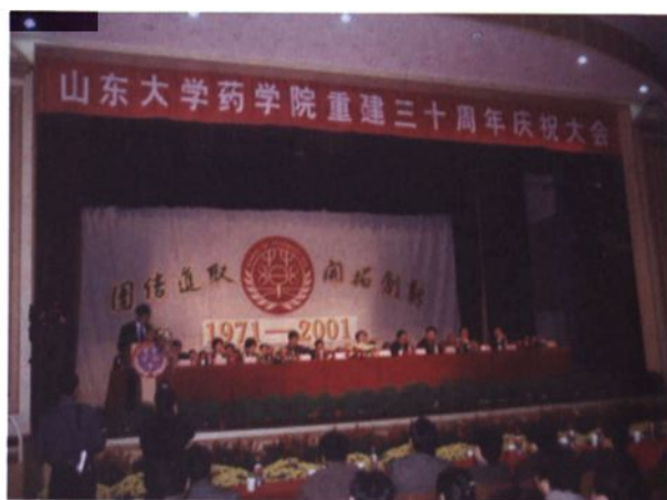
▶ 2001年，庆祝山东大学药学院重建三十周年