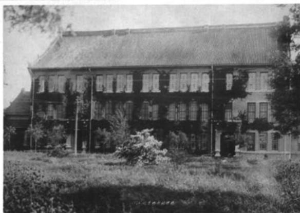
▲ 1924年，齐鲁大学化学楼，时称“柏根楼”（现教学三楼）