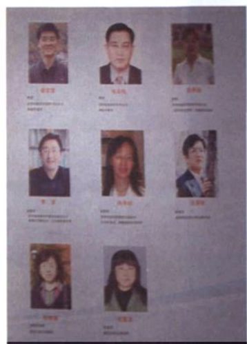
▲ 药物筛选中心研究团队