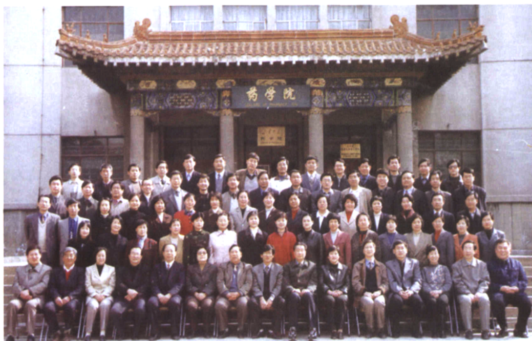
▲ 2001年，山东大学药学院教职工合影