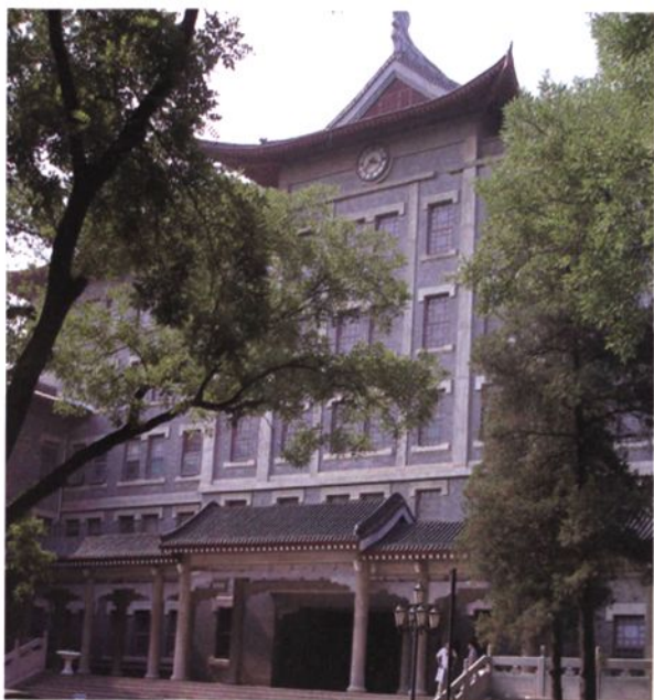
◀ 2001年，药学院党政领导迁入新建的综合办公楼