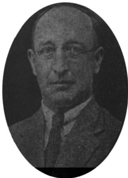
▲ 1920年，齐鲁大学设立药科，图为药科创始人裴威廉（Pailing）