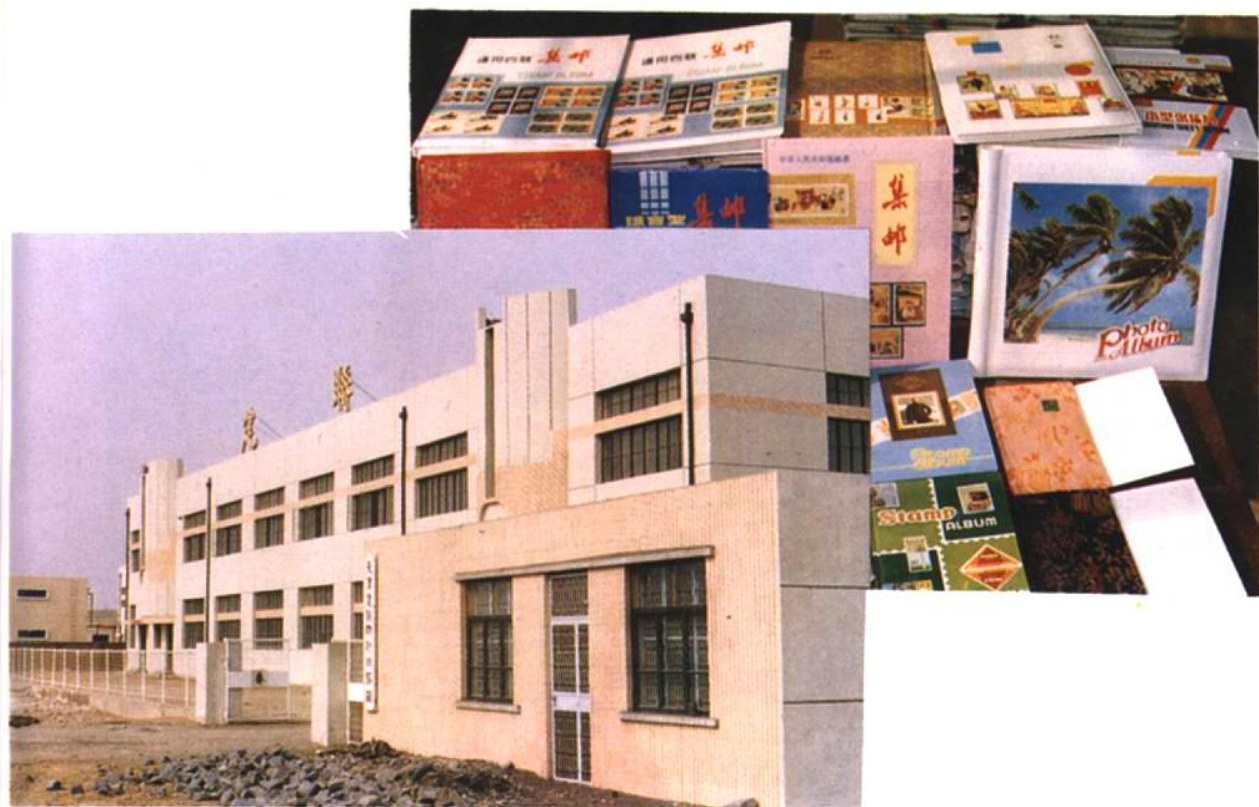
乡办企业及其部优产品