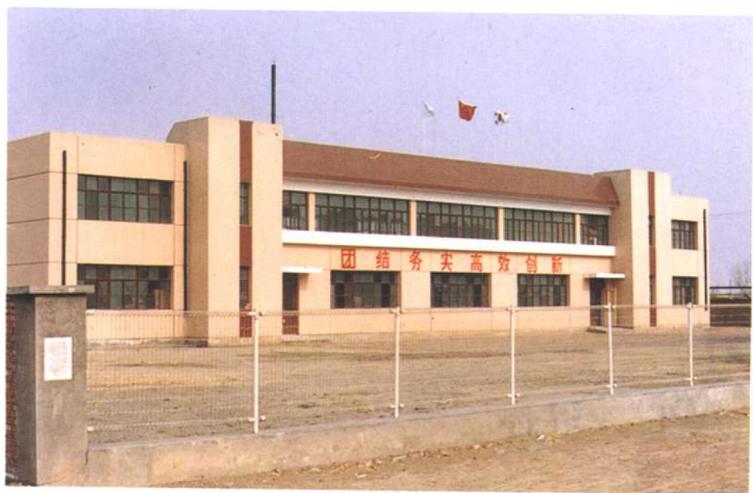
辛庄乡第一家外资企业外貌