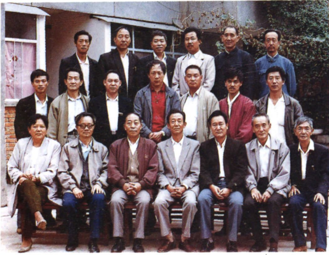
《曲靖地区副食品志》编纂领导小组成员合影