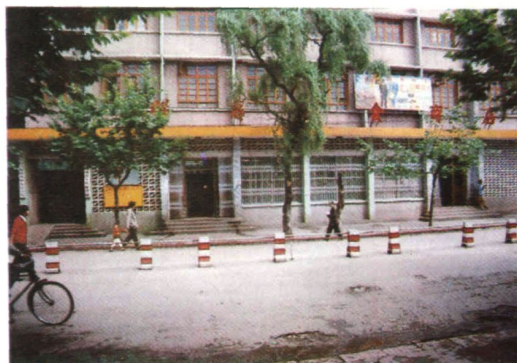
富源县糖烟酒副食公司办公楼、门市