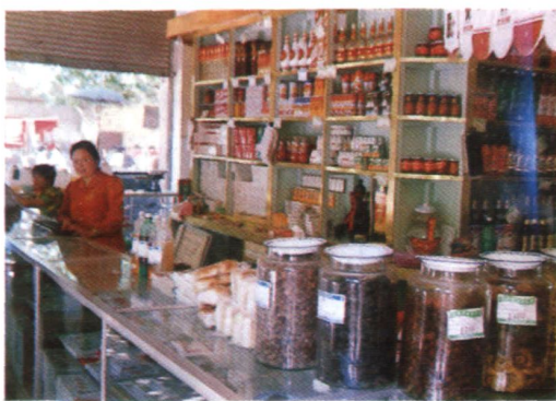
沾益糖酒茶公司另售商店之一