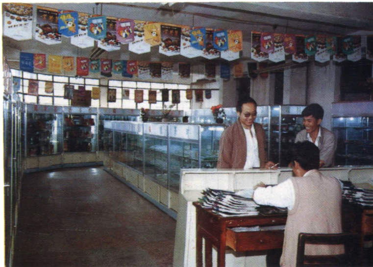
地区副食品公司批发部