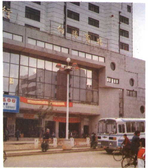
曲靖市贸易公司向阳商店