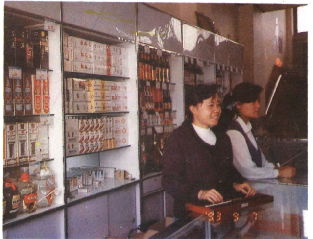
曲靖市贸易公司零售商店