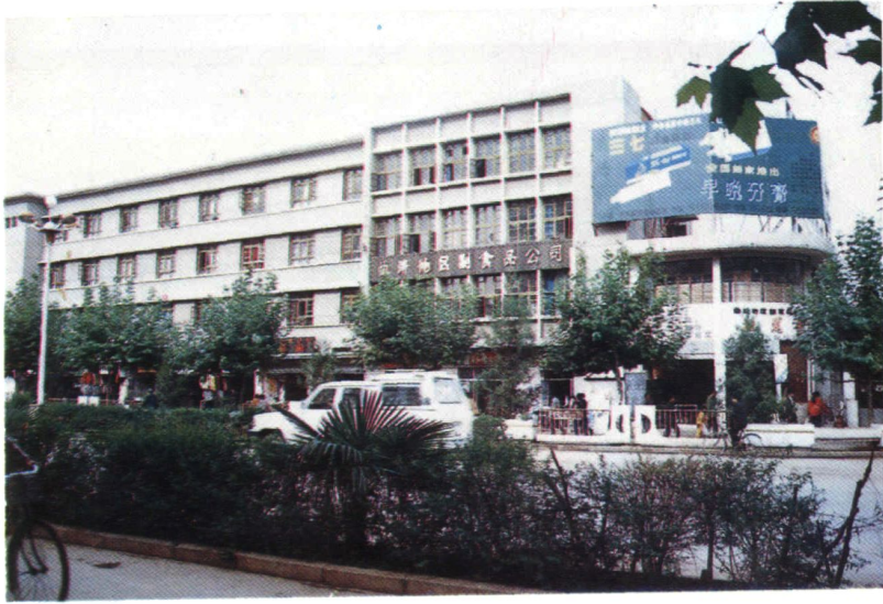
曲靖地区副食品公司 办公大楼