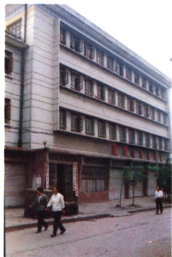
罗平县糖业烟酒副食公司 办公大楼及门市