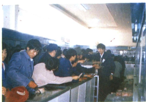
师宗县糖烟酒公司零售门市之二