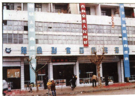
陆良县蔬菜副食公司办公楼及门市部