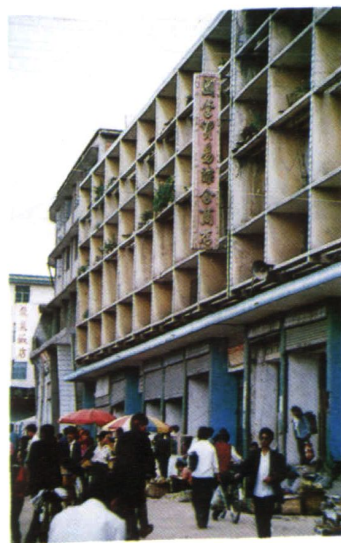
马龙县糖业烟酒公司大楼、门市