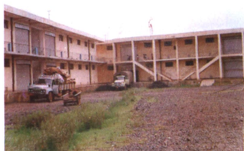
宣威县糖烟酒公司仓库之一