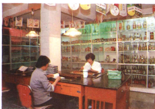
会泽县副食品公司批发部