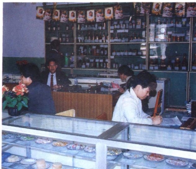
富源县糖烟酒副食公司批发部