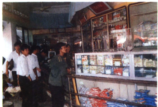
罗平县糖业烟酒副食公司零售商店