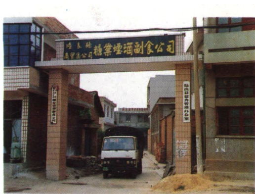
陆良县糖业烟酒副食公司大院