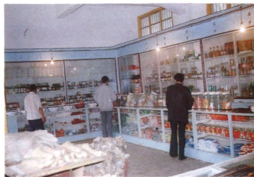
罗平县蔬菜公司副食品门市