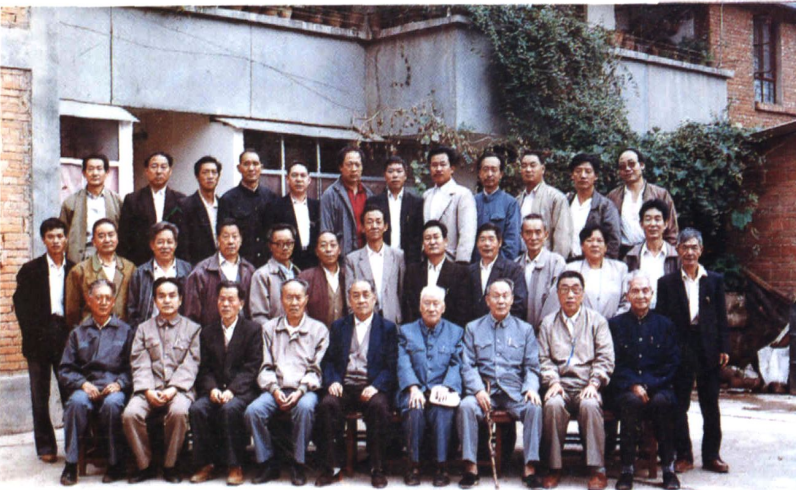
审稿会议全体同志合影