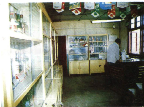
马龙县糖业烟酒公司批发部