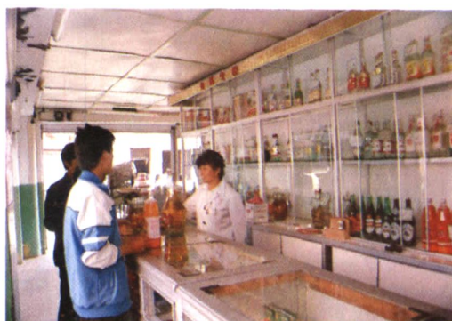
会泽县副食品公司零售商店之一