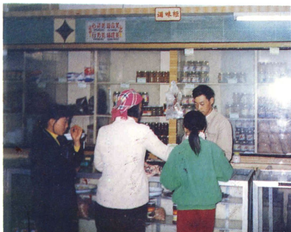
师宗县糖烟酒公司零售门市之一