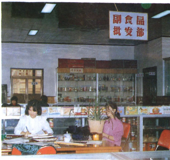
曲靖市糖酒茶副食公司批发部