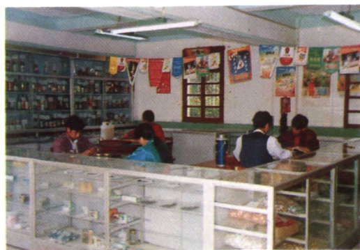
陆良县糖业烟酒副食公司批发部