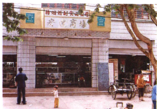
宣威县糖烟酒公司宏达商场