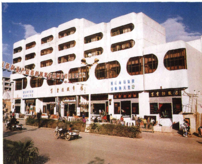
曲靖市蔬菜公司办公大楼紫云商场