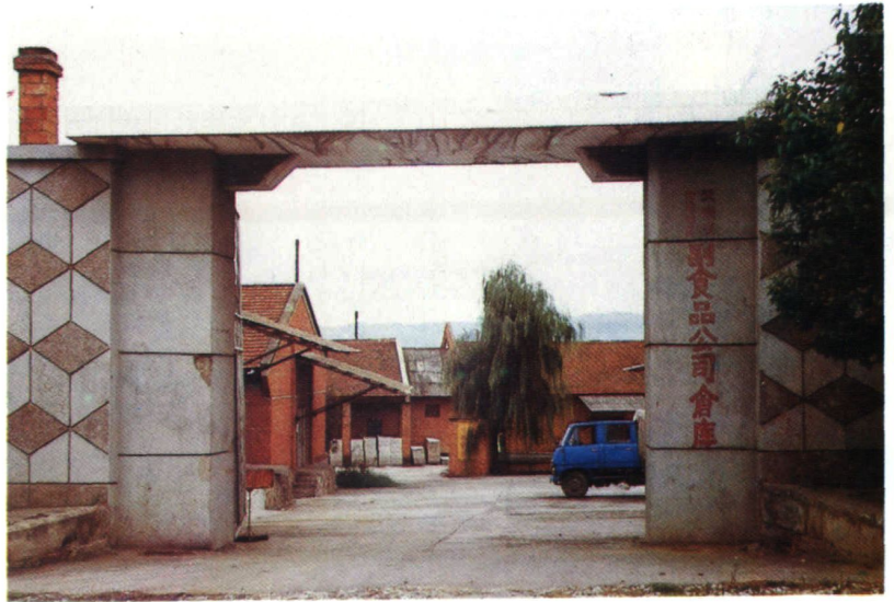
地区副食品公司 大坡寺仓库