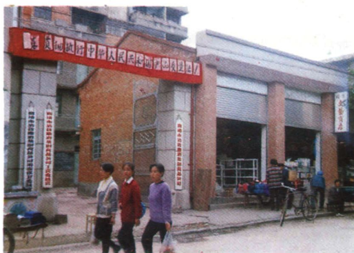
沾益糖酒茶公司办公大楼、门市