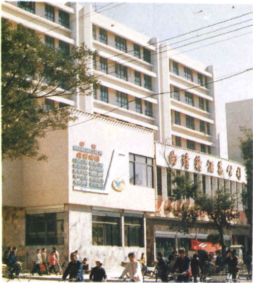
曲靖市糖酒茶副食公司大楼