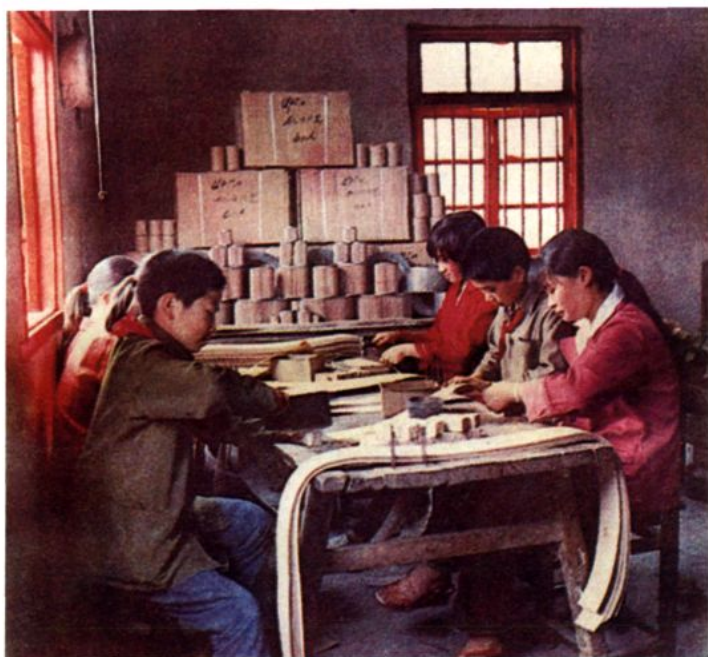
中心校学生在校办滤芯厂参加劳动。