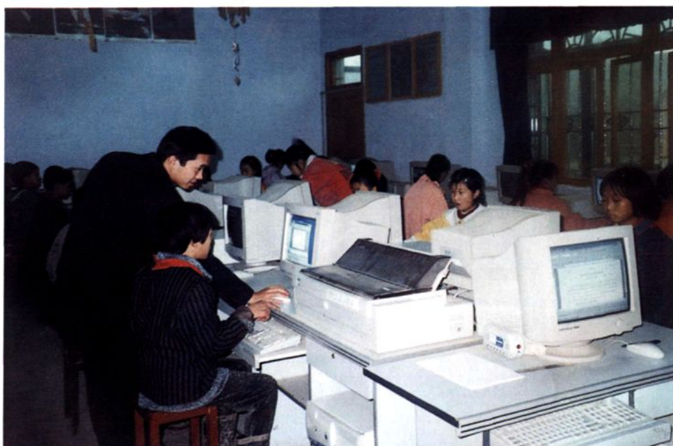
中心校学生在微机室上微机课