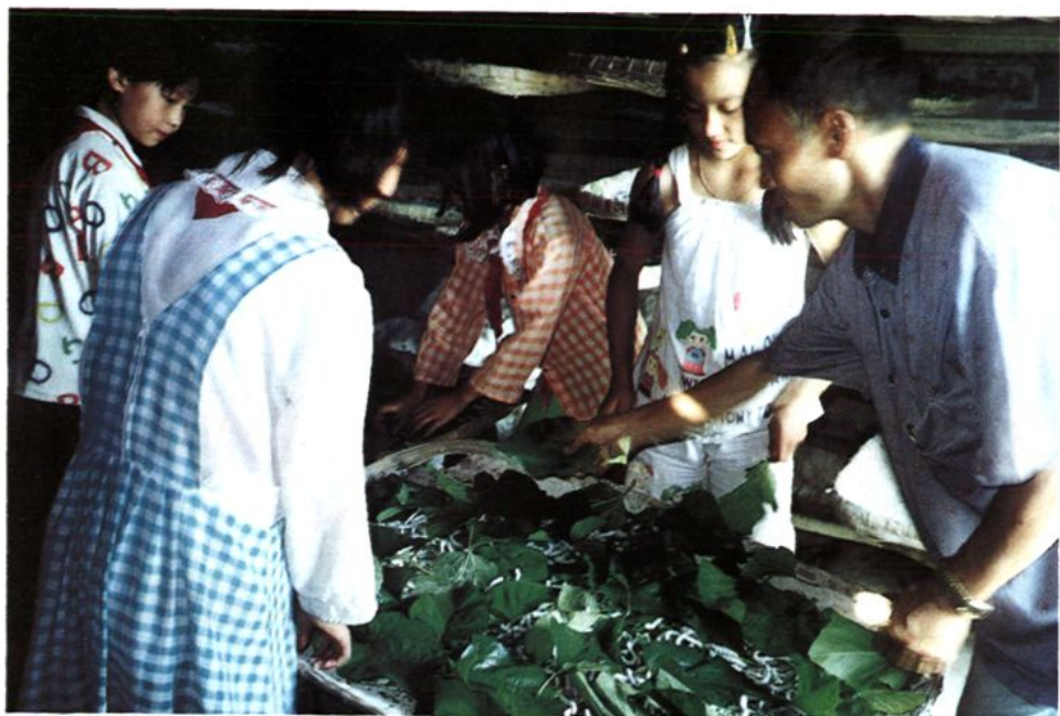
桥亭村小师生在饲养种蚕