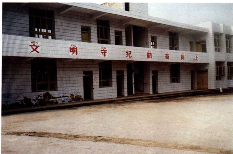
中心幼儿园教学楼