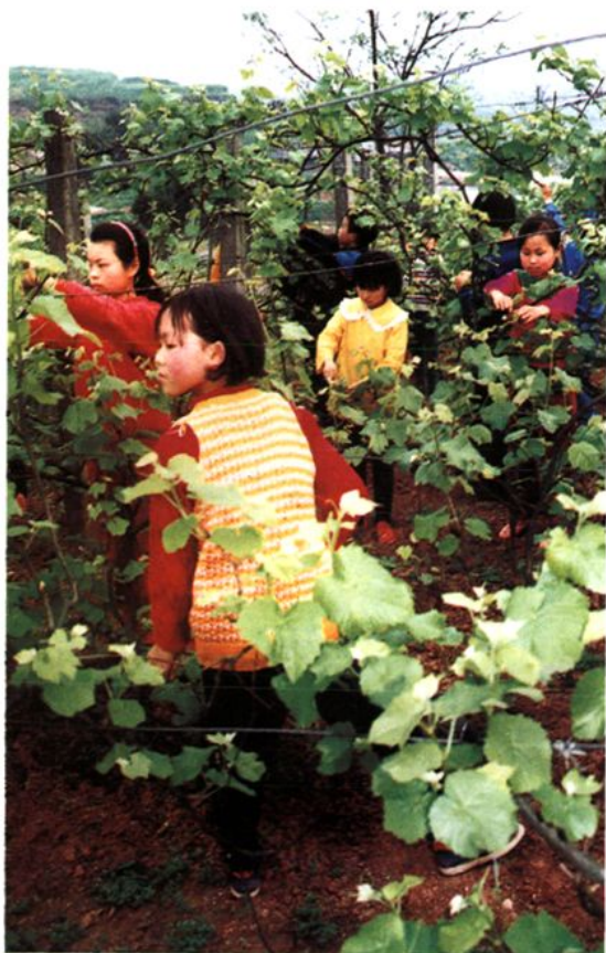
花园村小学学生在葡萄园进行夏季管理