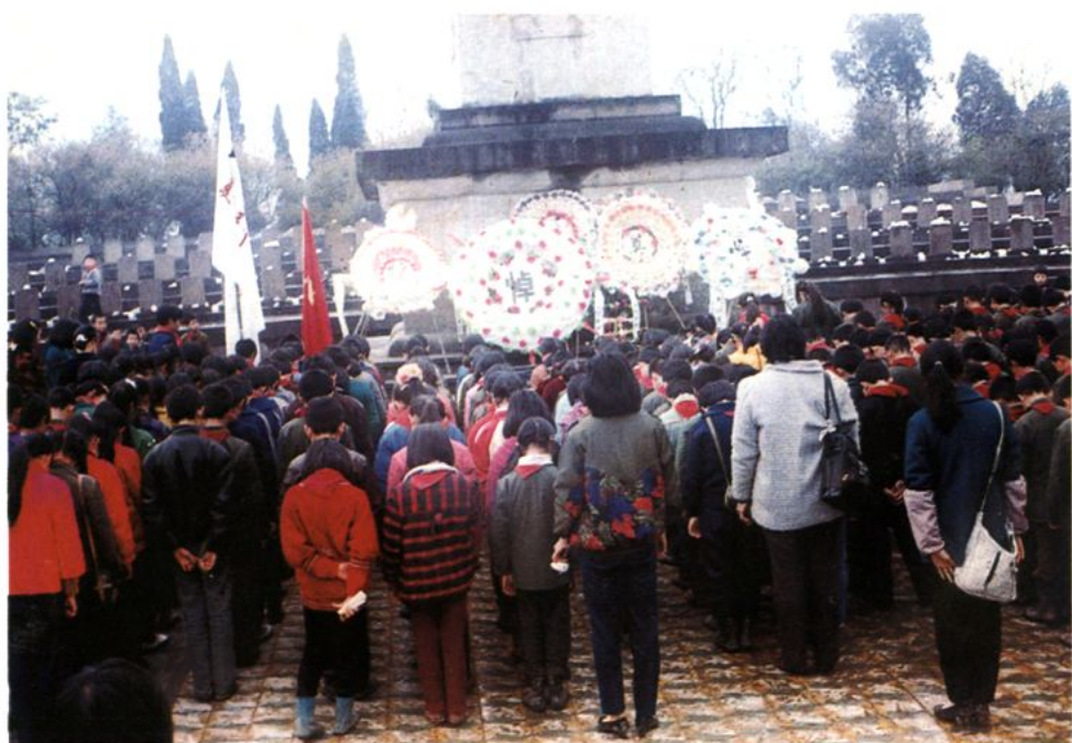
师生到烈士陵园扫墓