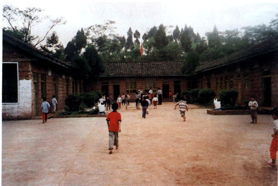
五里冲村小学校貌