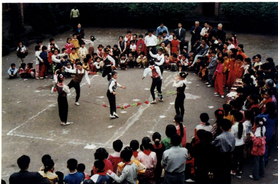
学校开展“四跳”运动会