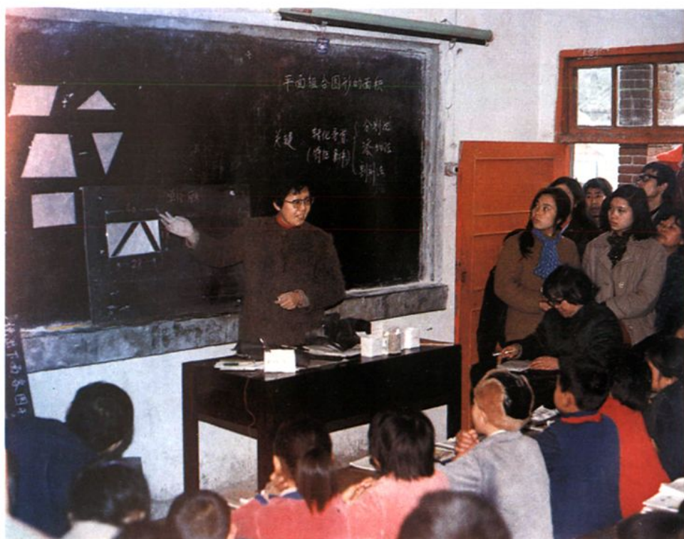
市中区第一实验小学教师来校上示范课