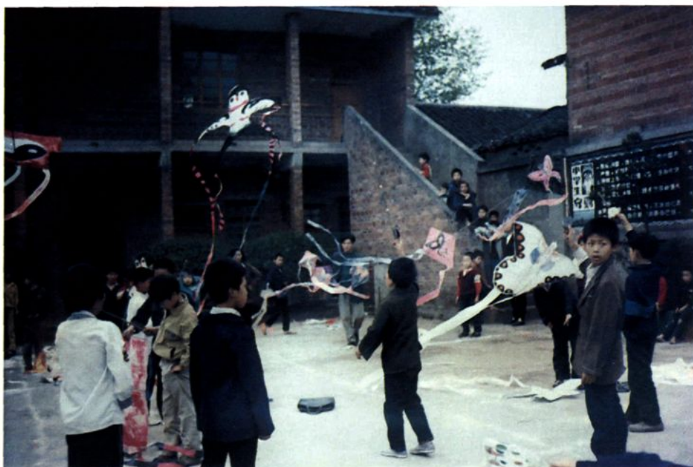
学校开展一年一度的风筝制作、放飞比赛