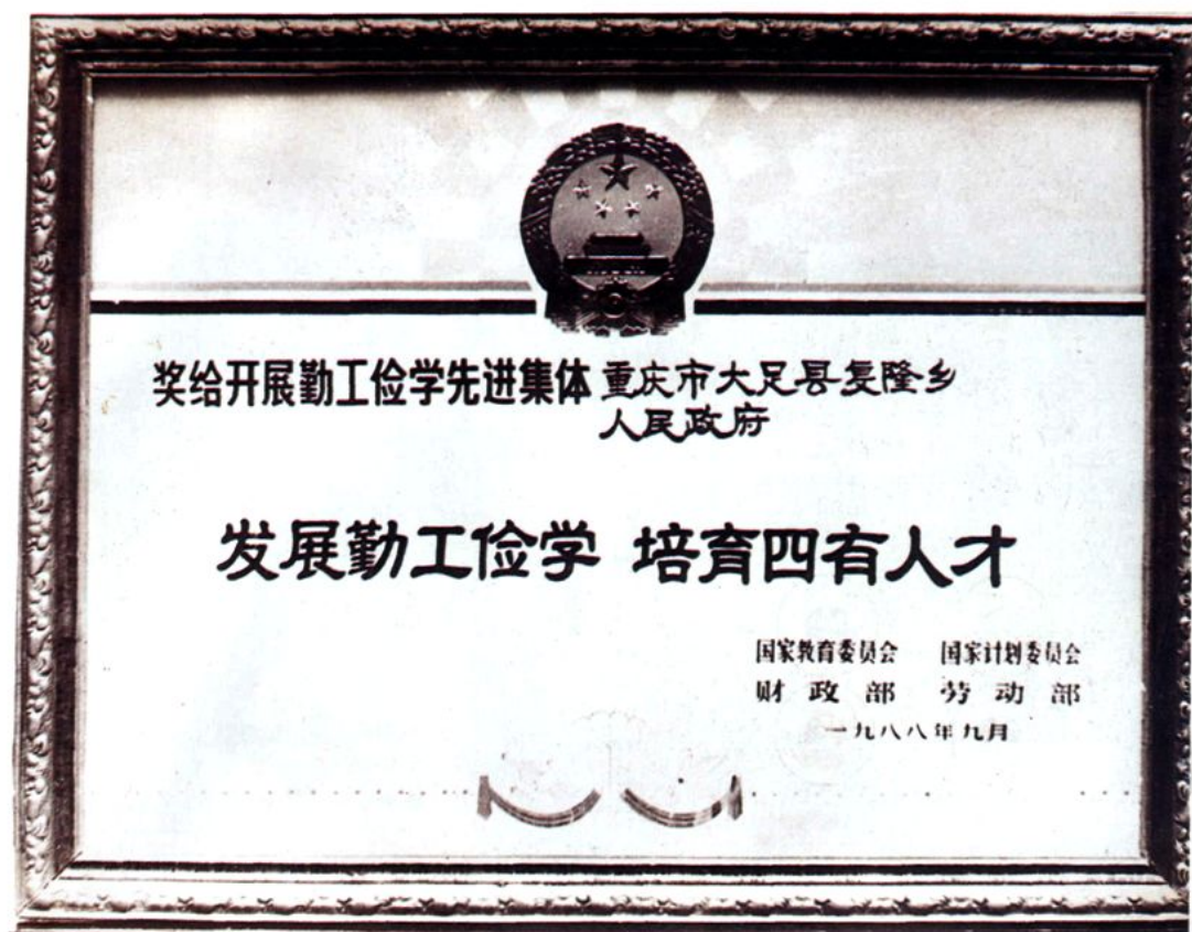
学校被评为全国勤工俭学先进集体。