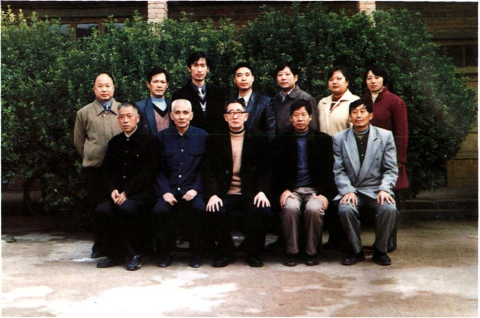
校志领导小组和编写组人员合影