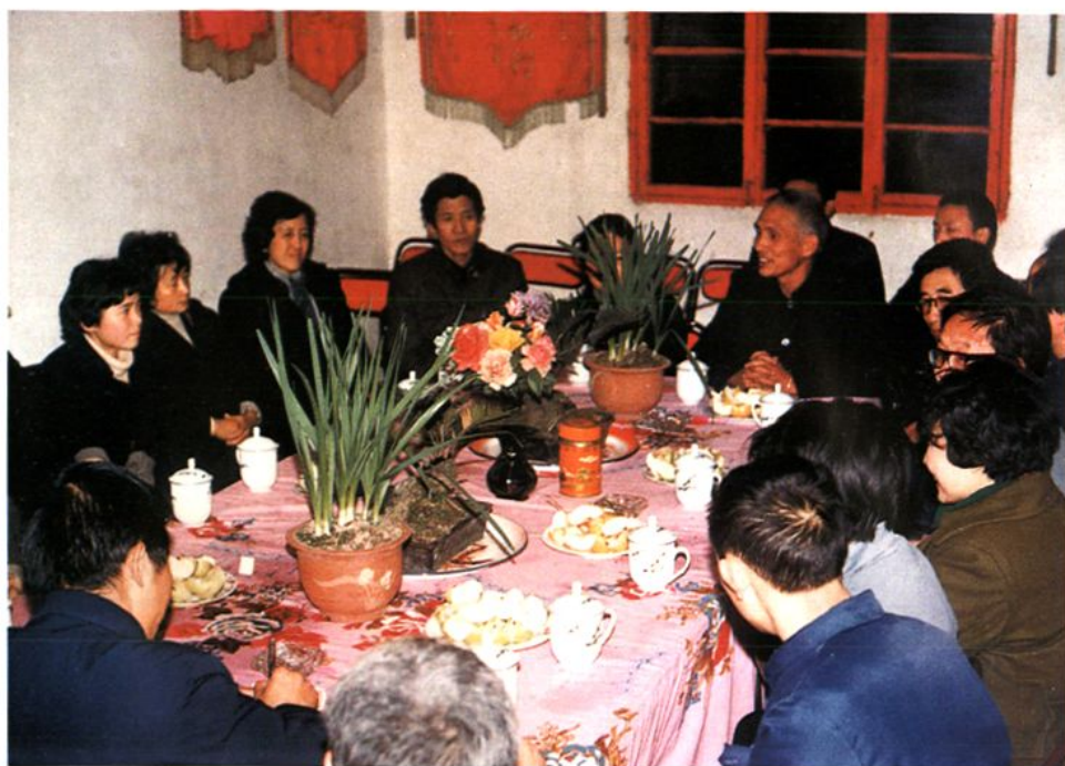
重庆市中区第一实验小学领导和教师来校交流教育教学改革经验。