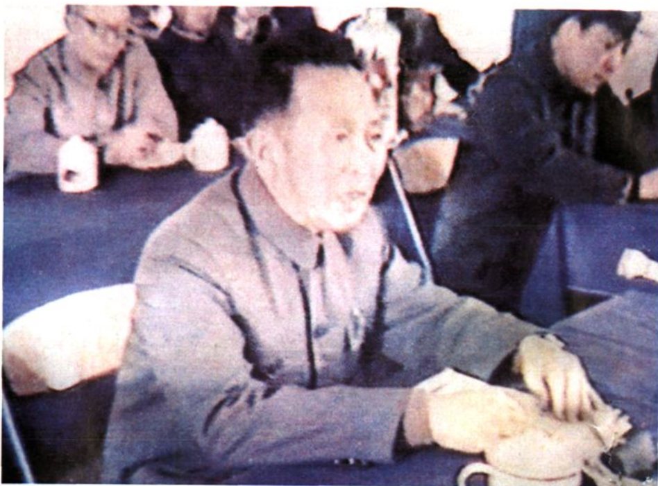
1984年4月，重庆市副市长冯克熙在复隆乡召开的全市集资办学会上讲话。