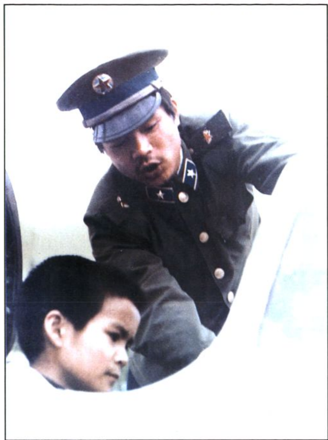
校外辅导员驻足部队机械师在飞机上给学生讲操作原理。