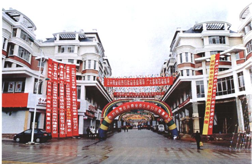
云县锦源房地产公司建设的云兴商业街