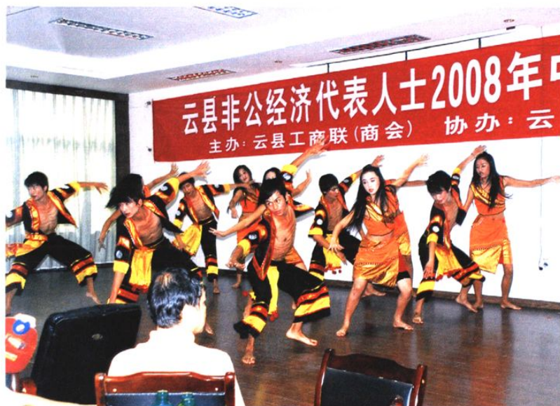
在2008年6月云县工商联(商会)召开的非公经济代表人士中秋茶话会上县歌舞团演员为参会人员演出