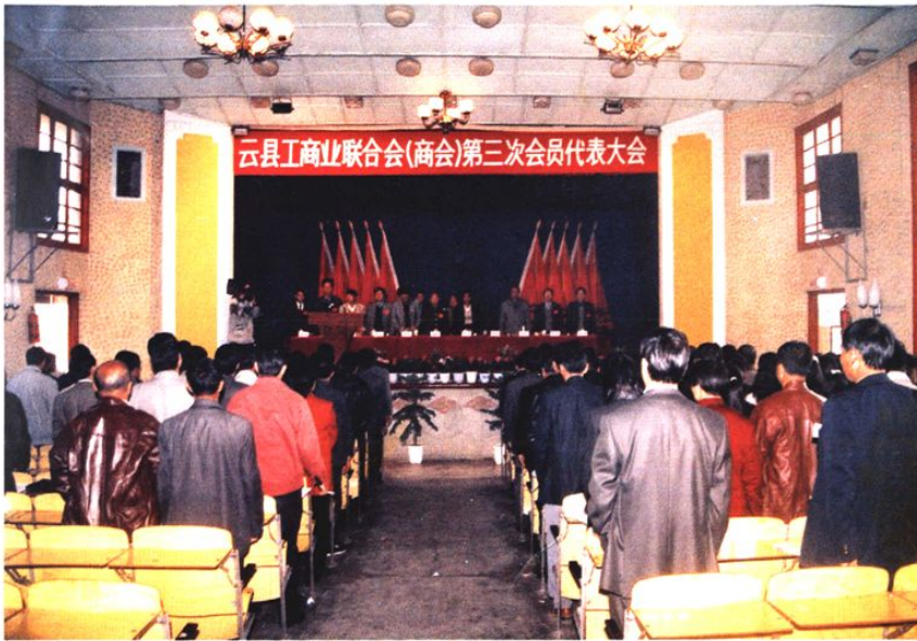
2001年12月召开云县工商联（商会）第三届会员代表大会