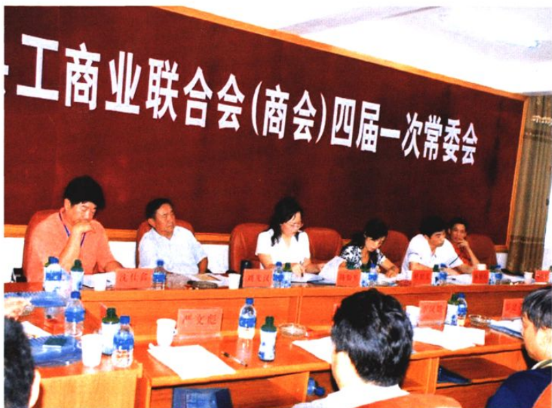
2008年8月云县工商联(商会)召开四届一次常委会