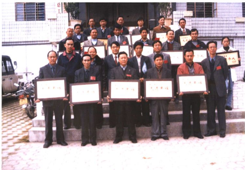
在2002年10月召开的云县工商联（商会）第三届代表大会上受表彰的光彩事业先进集体和个人