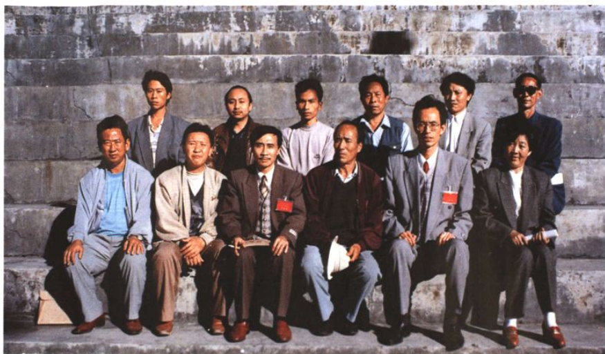
云县工商联（商会）第二届执委会全体委员