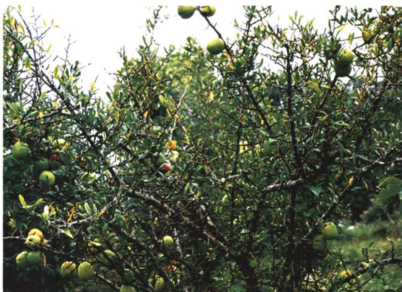
云南茅粮集团建设的30万亩白花木瓜基地