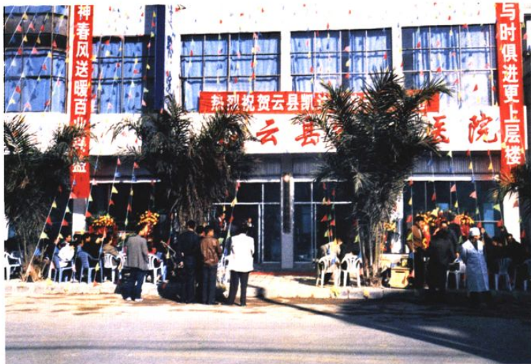
2003年1月18日临沧市第一家非营利性民营医院——云县凯达医院举行开业庆典