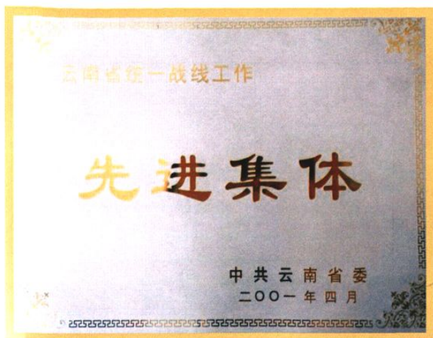
县工商联荣获的荣誉匾牌