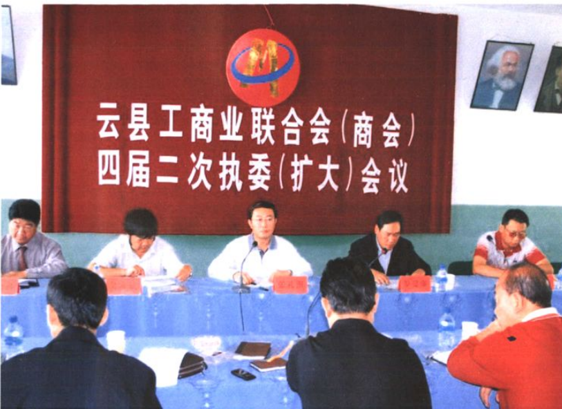
2007年6月云县工商联（商会）召开四届二次执委（扩大）会议