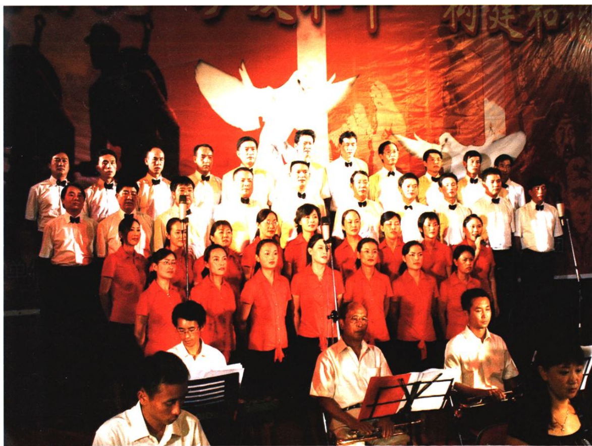
2007年7月30日，云县工商联全体干部职工参加县委组织的庆祝建军80周年暨抗日战争胜利70周年歌咏比赛