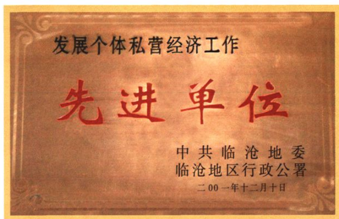
县工商联荣获的荣誉匾牌