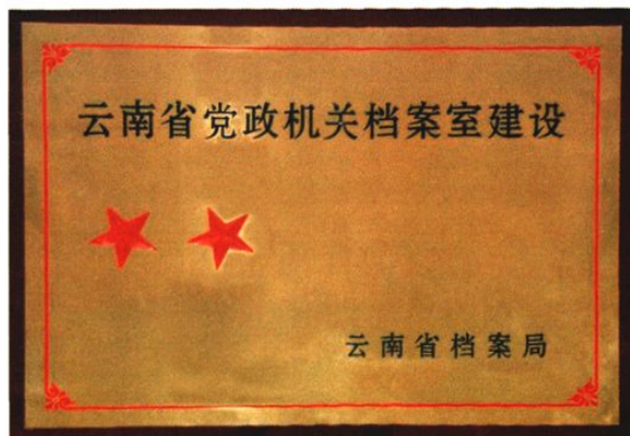
县工商联荣获的荣誉匾牌