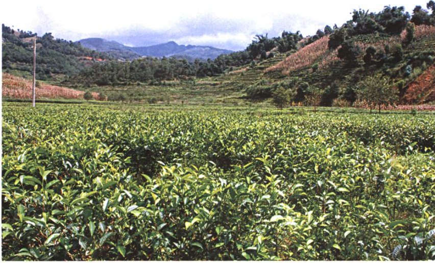
云南澜沧江啤酒企业集团建设的茶叶谷