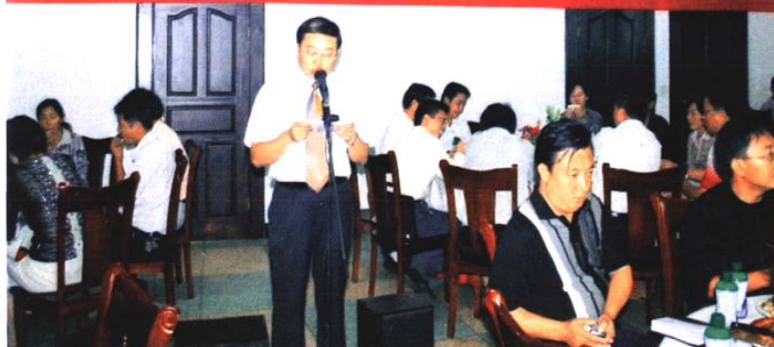
在2008年中国·云县澜沧江啤酒狂欢节上云县工商联承办的和谐云县千村长街宴