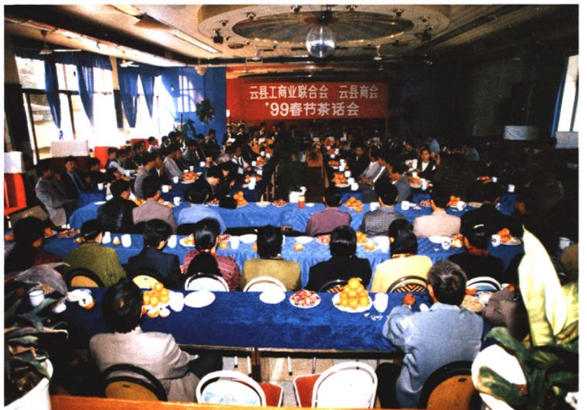
云县工商联（商会）召开非公经济人士2000年春节茶话会