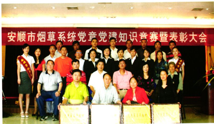
市局首届党建知识竞赛