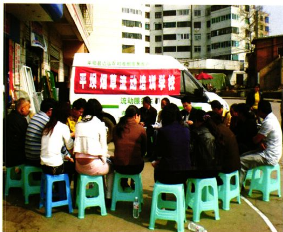
平坝农网客户流动服务车