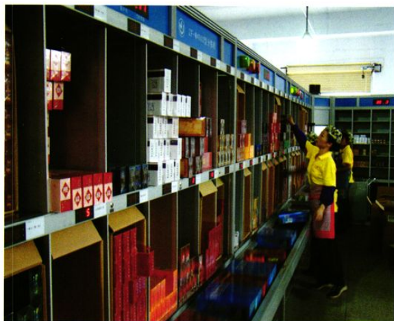
物流中心分拣现场