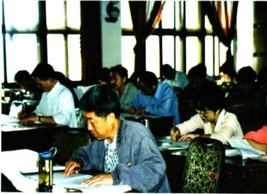
一、职工参加国家烟草局第二号令考试