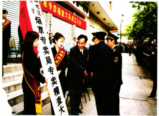
烟草专卖稽查大队授牌仪式