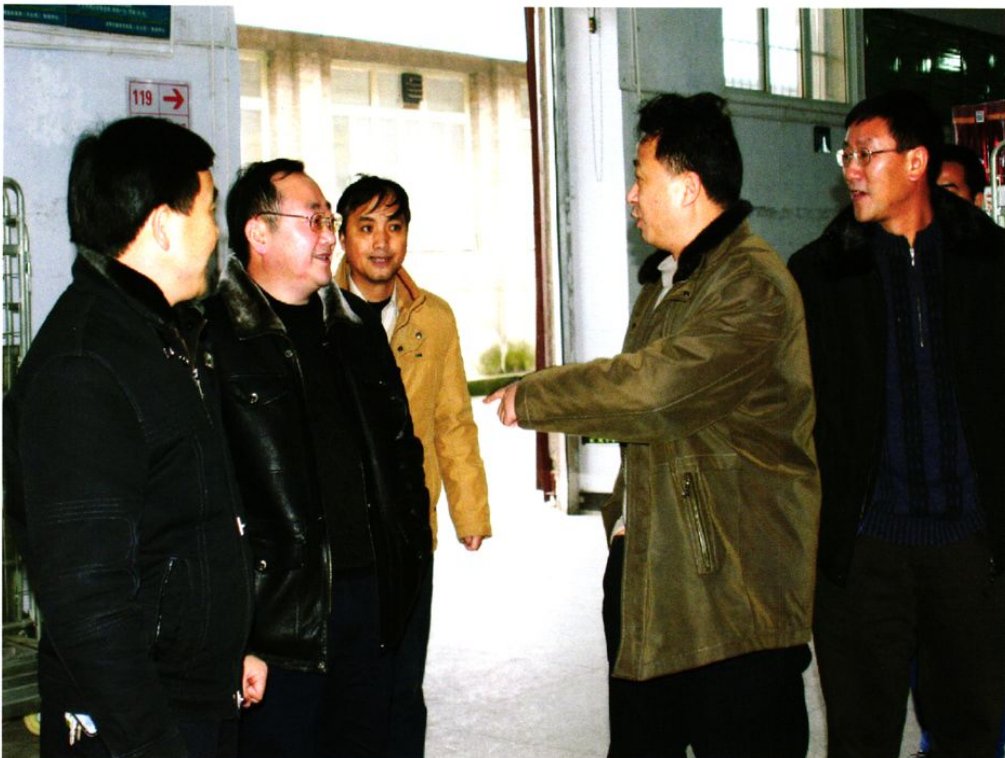
省局副局长杨俊在安顺视察工作