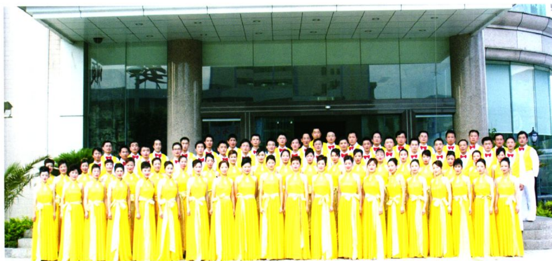
参加歌咏比赛合影