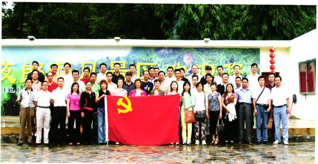
机关党支部参加户外活动