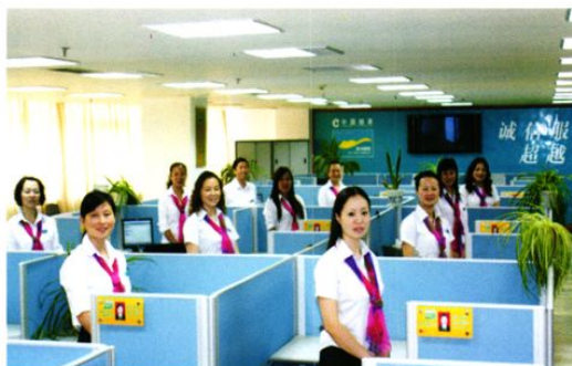
营销中心电访队伍风采