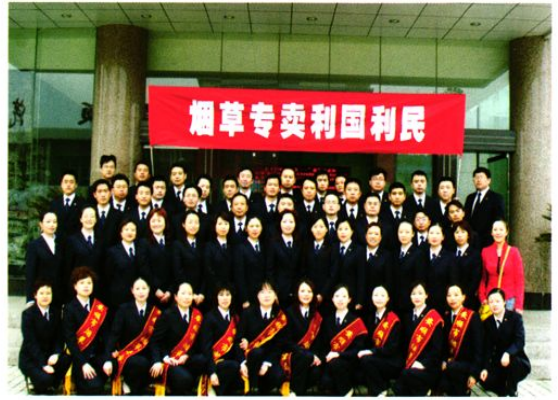
参加烟草专卖法宣传人员合影