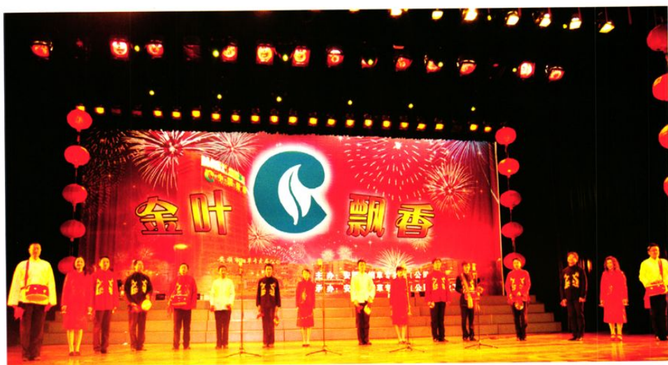
市局（公司）举行首届金叶飘香迎新春晚会