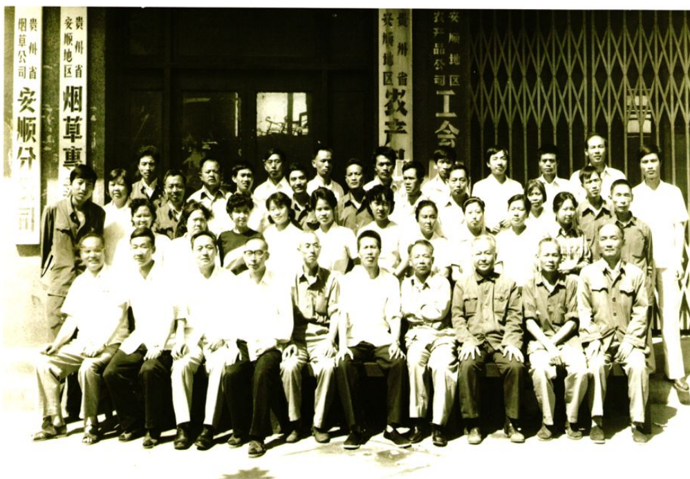
1984年机关全体干部职工留影