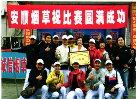
我局职工参加广播操比赛