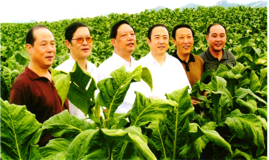
国家局局长姜成康（左三）在安顺视察工作