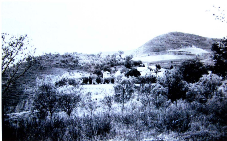
老照片记忆着聪慧的信士保护了这块神圣的净土。