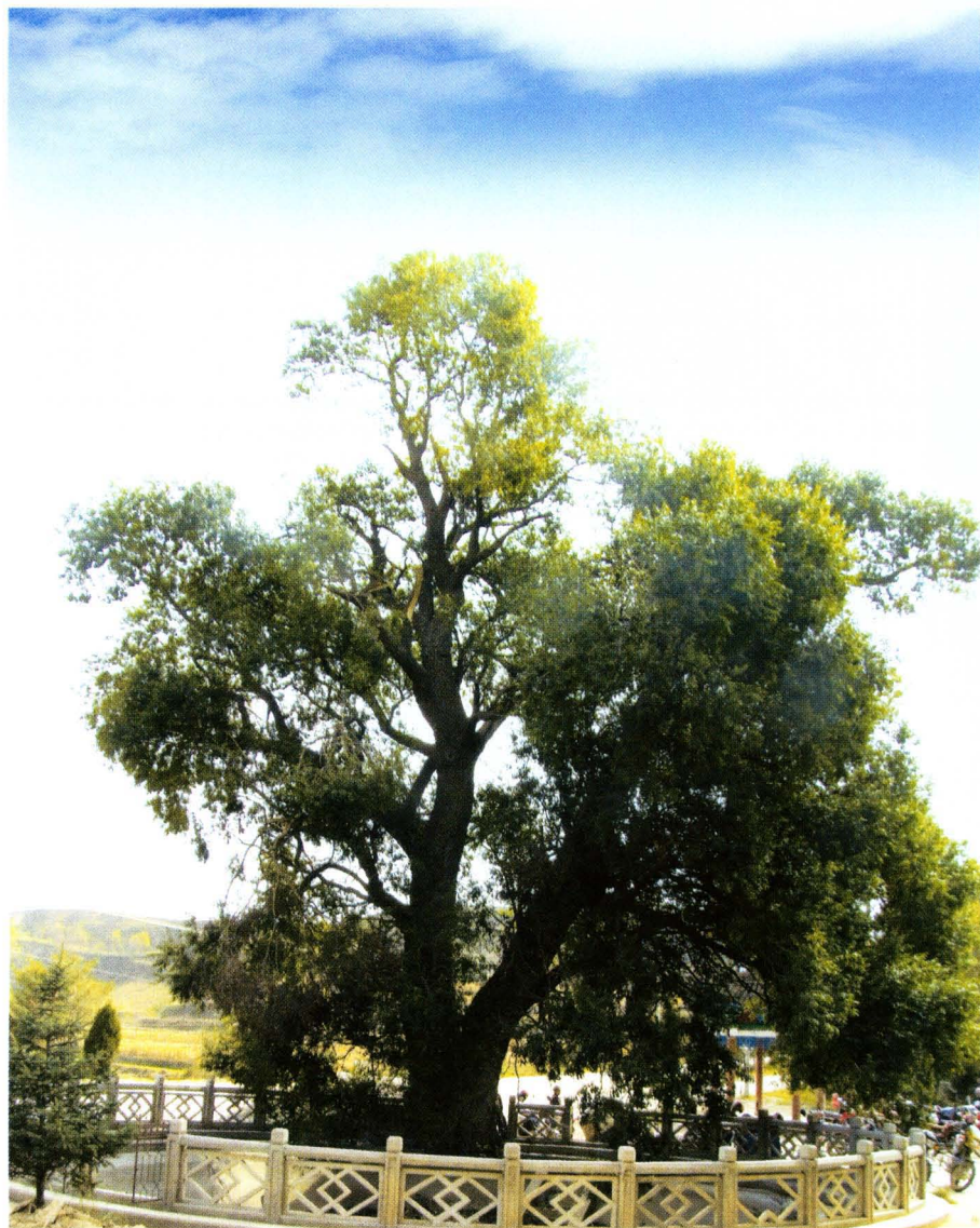
苍翠环绕着久远的歌谣,570余年的箭杆柳昭示着古老的太白庙。