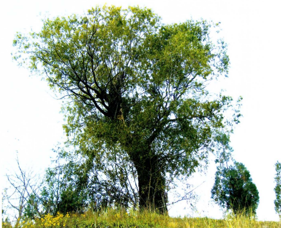
有了树的护佑,太白庙的神气更加浓烈。