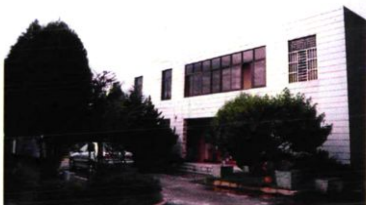
大关邑村民 委员会办公楼