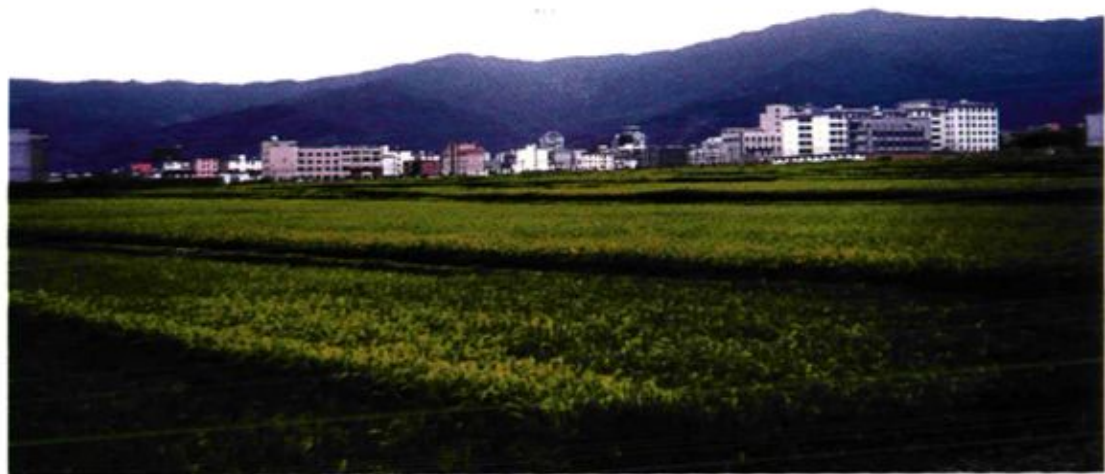
大关邑农田、村庄远景