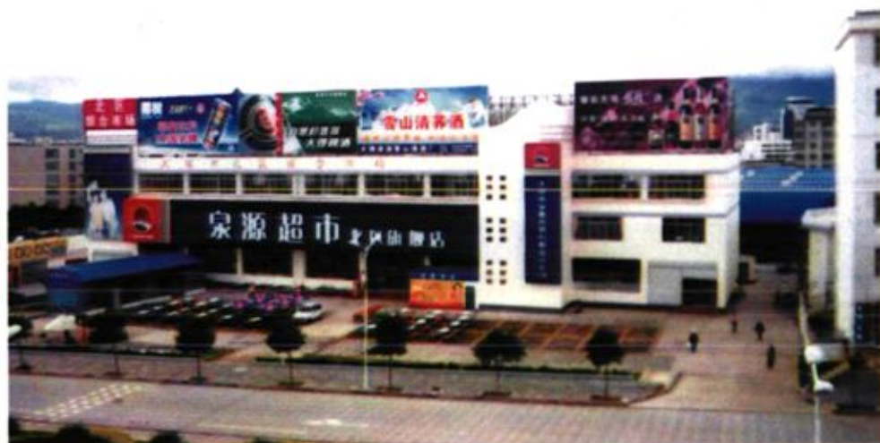
一万多人的摊位大棚 北区综合市场容纳