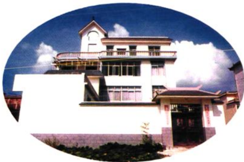
大关邑村新建村庄的一角