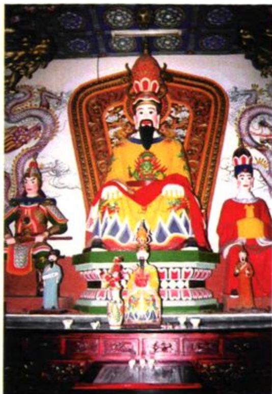
大关邑村本主张乐进术