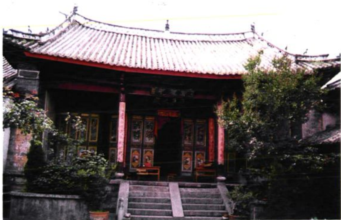
大关邑八村本主庙宝林寺