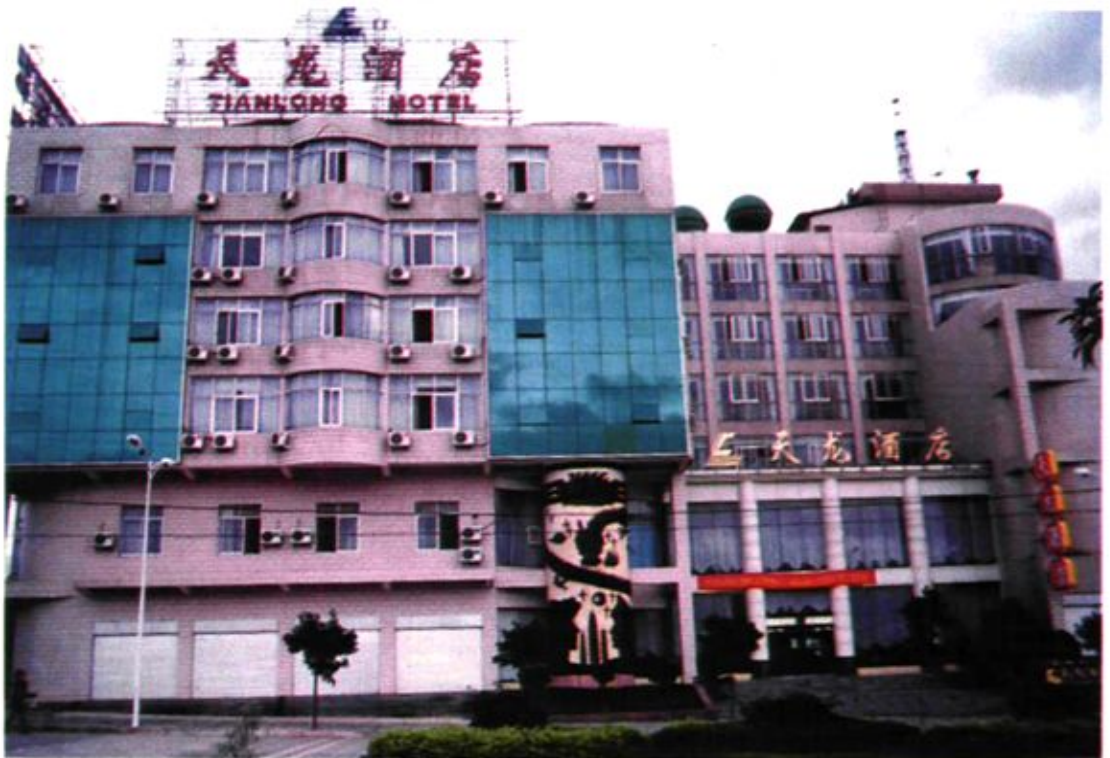
在大关邑村新建的天龙酒店