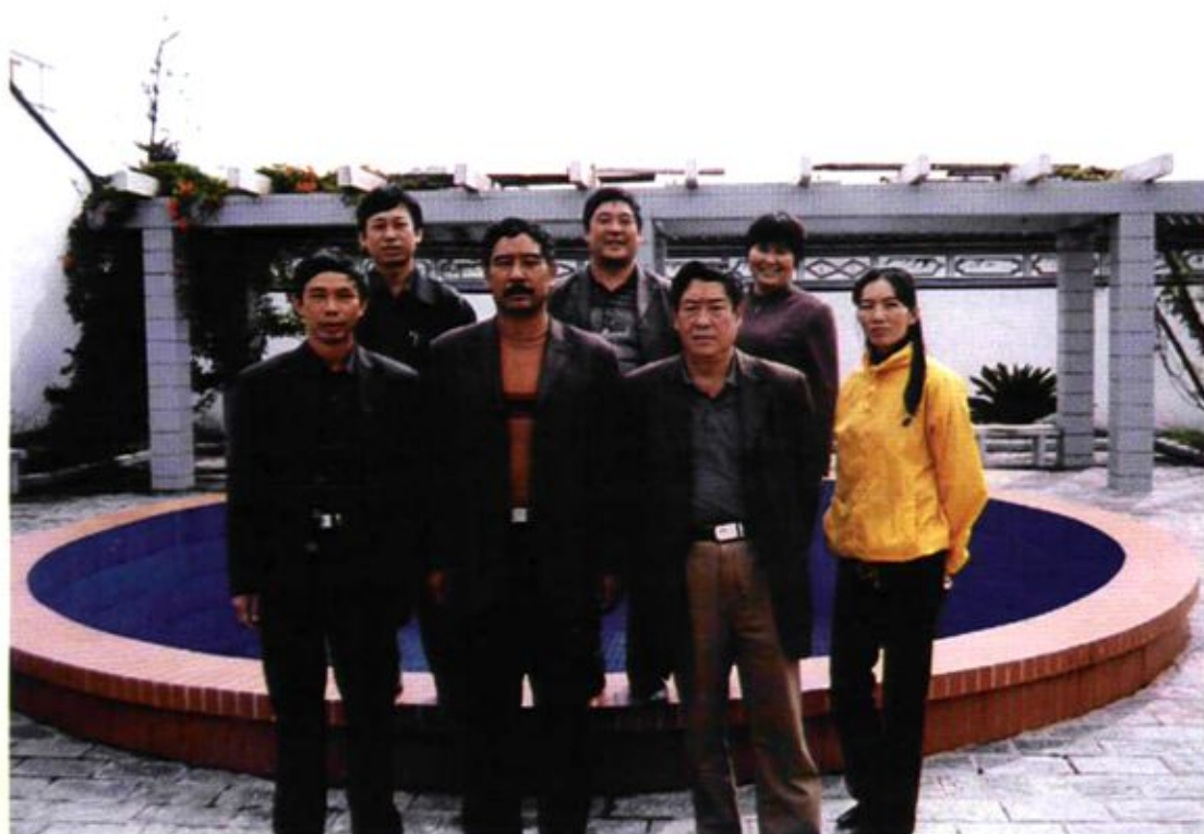
大关邑村民委员会班子