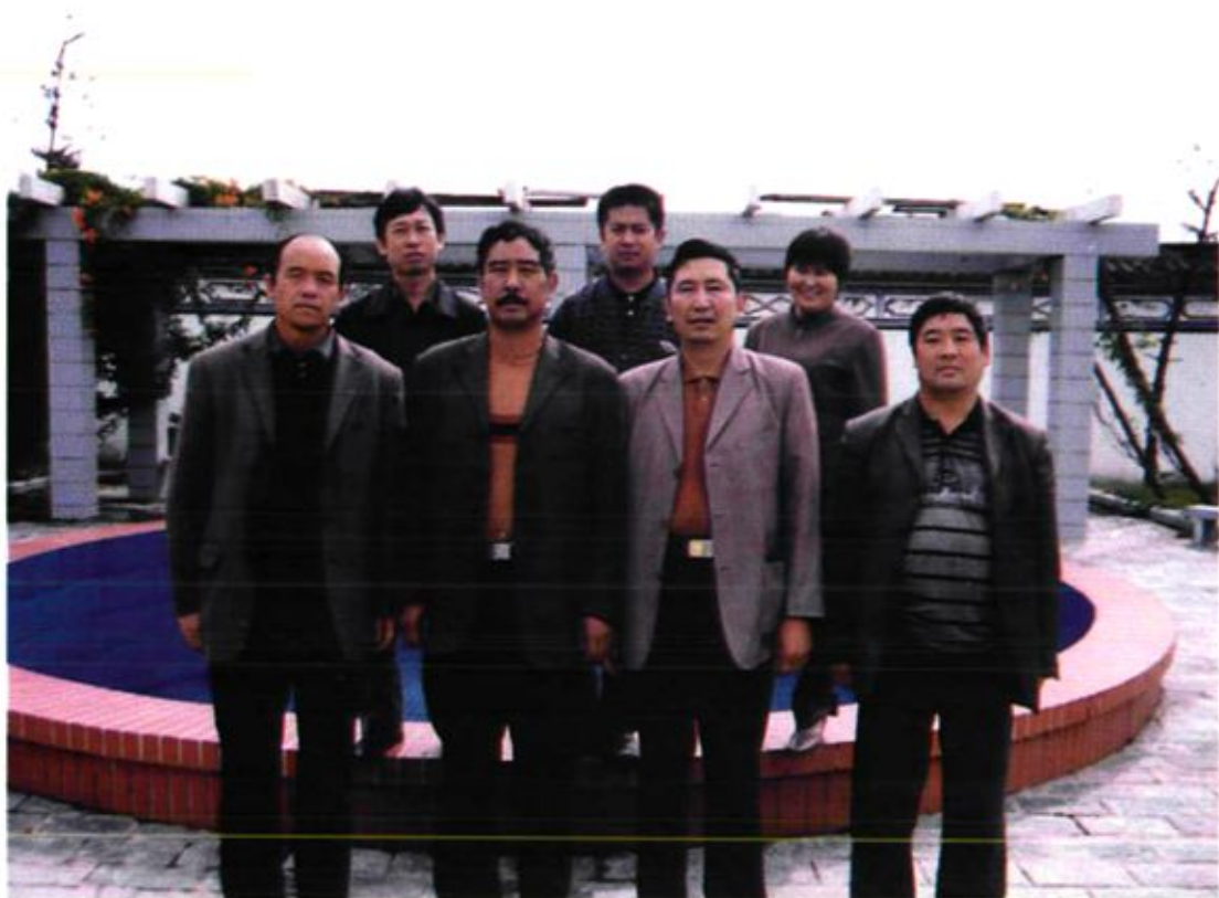
大关邑村党总支委员会