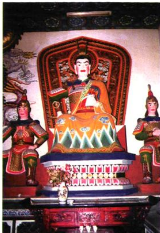
大关邑村二本主李公子