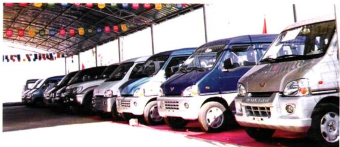
开设在大关邑村商业区的各家汽车销售市场