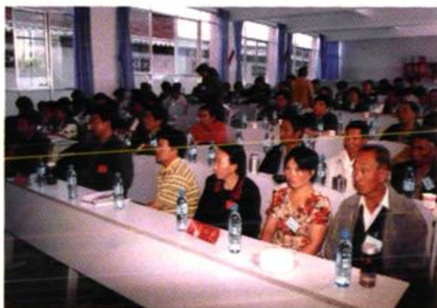
大关邑村民委员会 妇联计划生育工作会