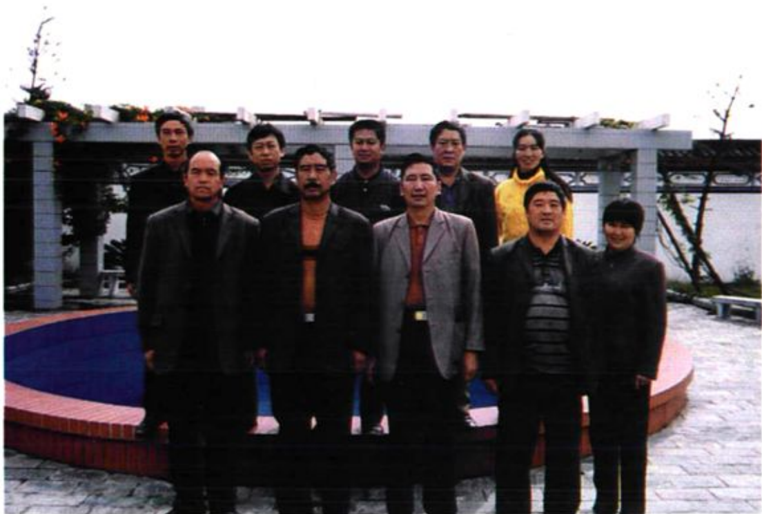
大关邑村“两委”班子