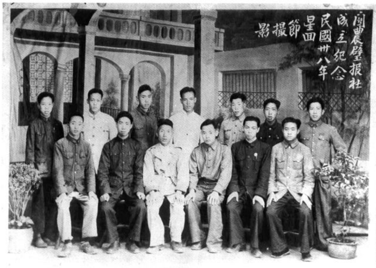
解放初期，中共地下党在大关邑村开办“关农壁报”的编辑人员