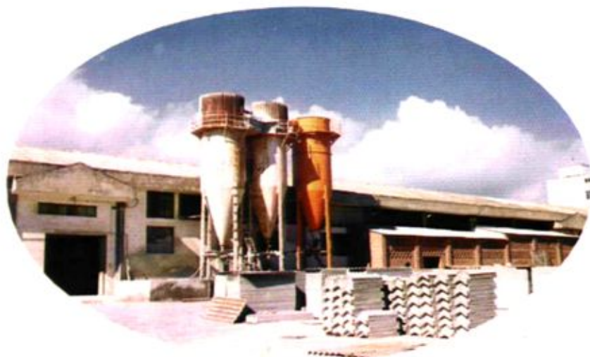
业「石棉瓦厂」 大关邑村村办企