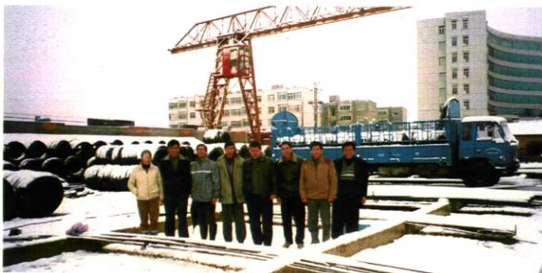
大理州大华经贸有限责任公司钢材市场全景