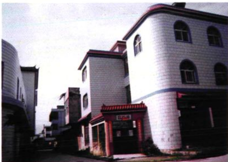
大关邑村 新村大道