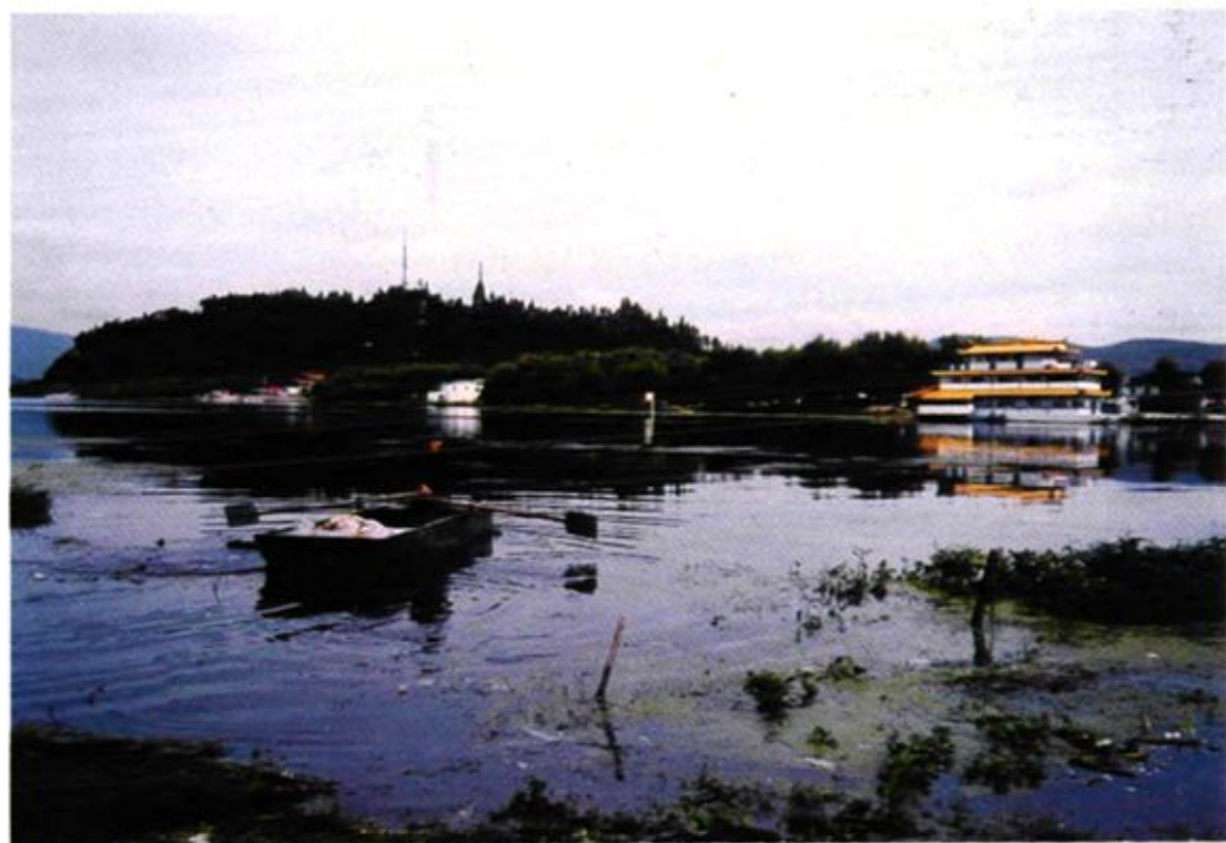
解放初期中共地下党开通在大关邑村的“红色渡口”