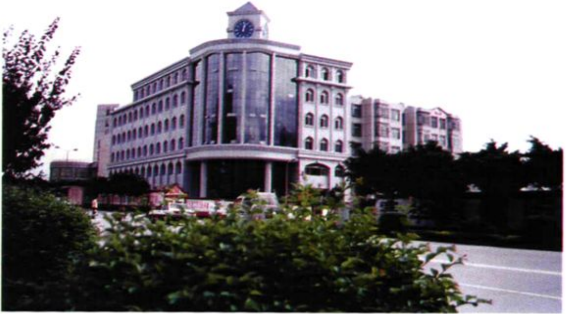
在大关邑村新建的市区街道