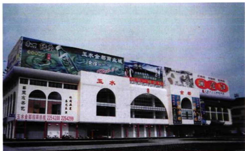
在大关邑村新建的商 业城「玉水金都」