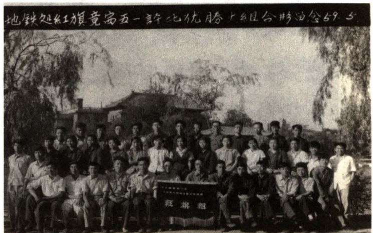
地铁设计处红旗竞赛五一评比优胜合影