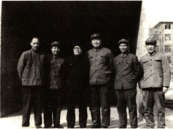
北京市赵鹏飞副市长在隧道模试验现场