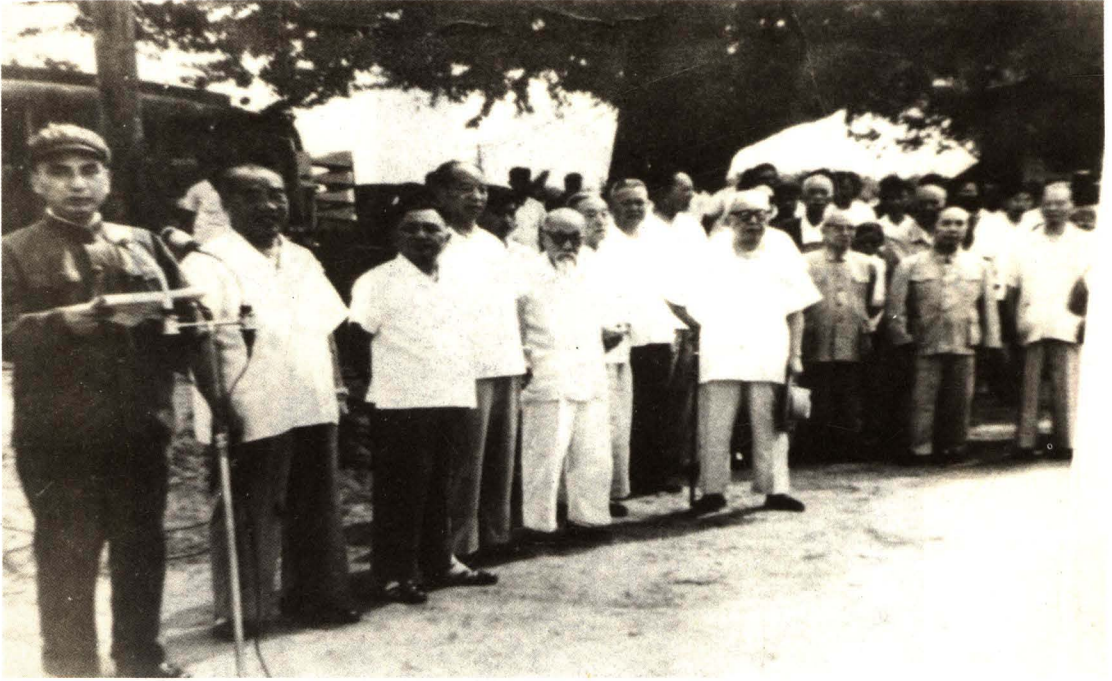
1965年7月1日党和国家领导人参加北京地下铁道工程开工典礼