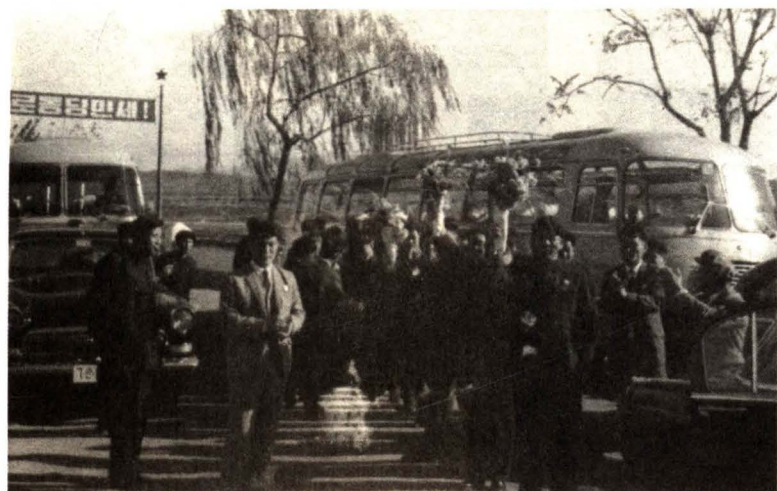
援建平壤地铁工作组在朝鲜参观访问