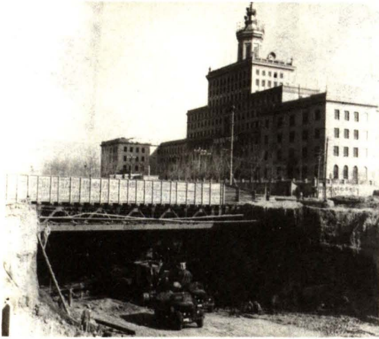
北京地铁一期工程施工现场