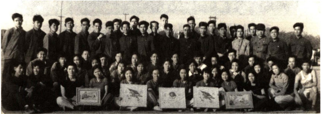
地铁设计处参加运动会后合影