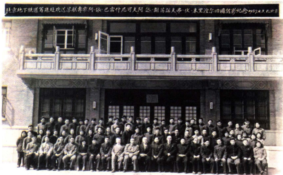
北京地铁筹建处欢送苏联专家回国(1957年4月)