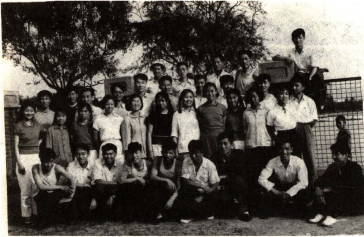
地铁设计处(天津)部分人员