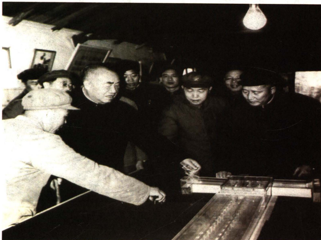
朱德同志听取北京地下铁道工程汇报