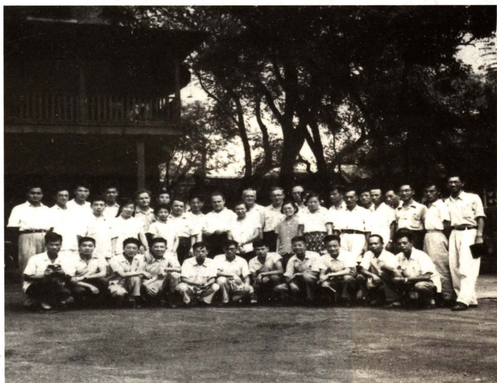
北京地铁设计处欢送苏联专家回国(1960年8月)