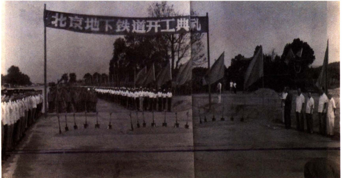
北京地下铁道开工典礼