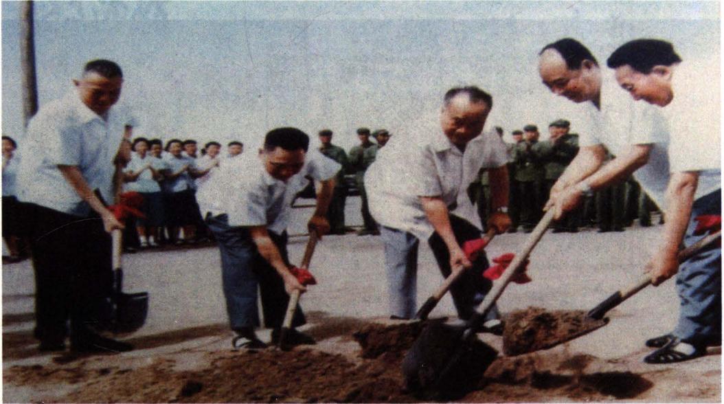
朱德、邓小平、彭真、李先念、罗瑞卿等为北京地下铁道工程奠基