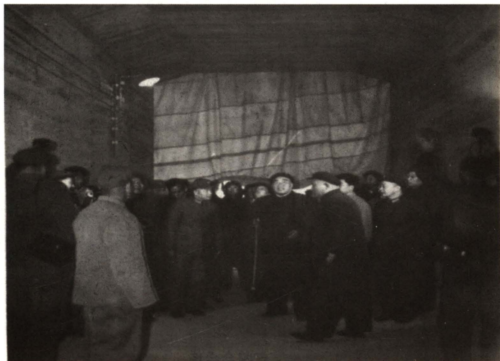
朱德同志在北京地铁工地视察