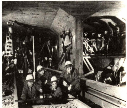
北京地铁铺轨施工检测