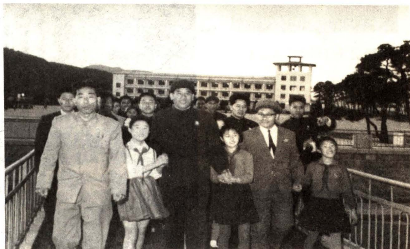
援建平壤地铁工作组在朝鲜受到热烈欢迎