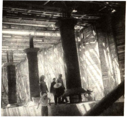
北京地铁一期工程钢管柱安装就位