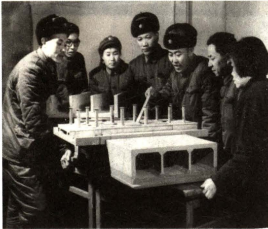
设计院技术人员研究设计方案