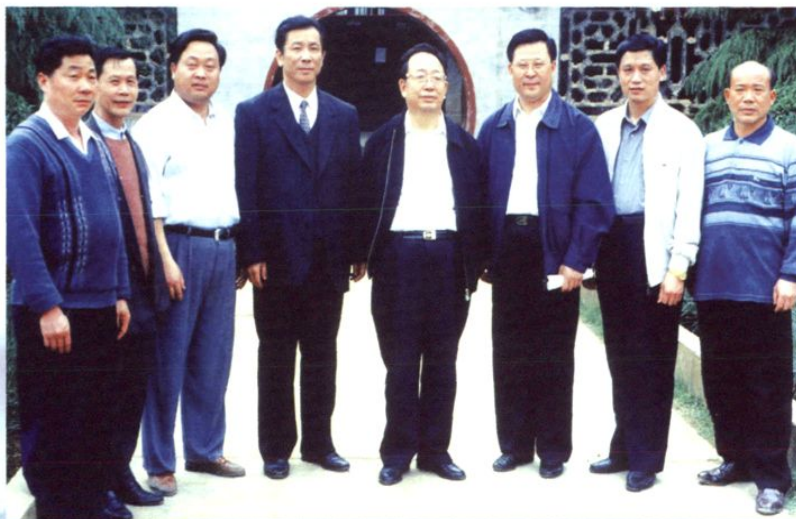
湖南省委书记 杨正午（左五）视 察耀祥中学