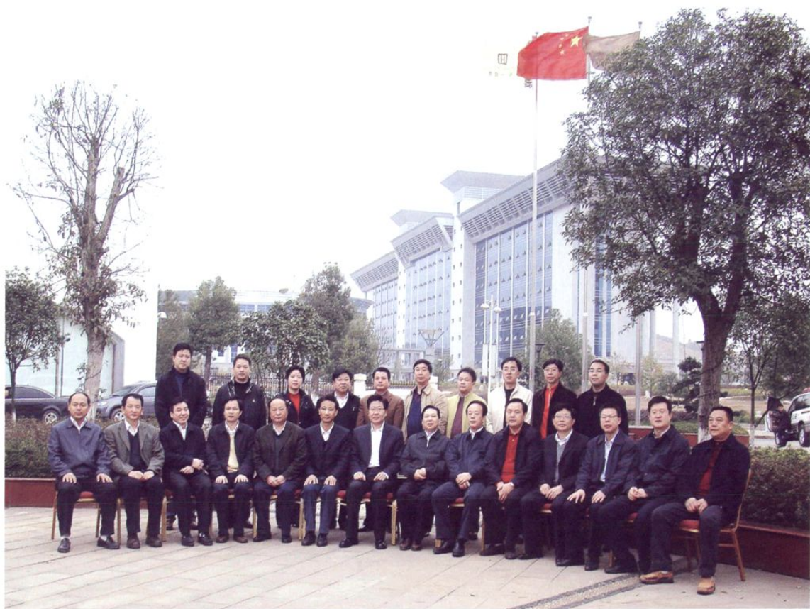
湖南省委书记张春贤（前排左七） 视察东安