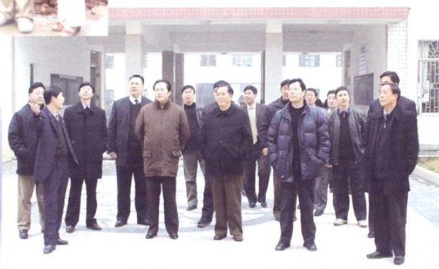
湖南省副省长唐之享（左五）视察东安一中