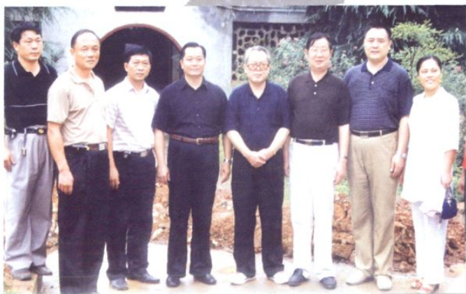
湖南省委副书记文选德（左五）视察耀 祥中学