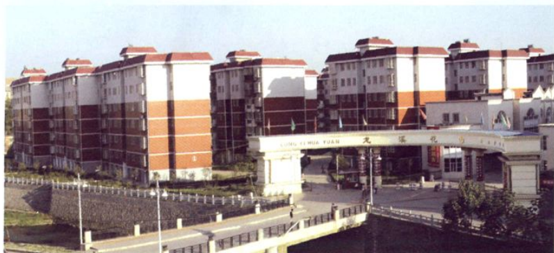
居民住宅小区—龙溪花园