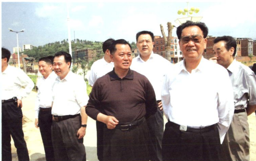
原国家政协副主席毛致用（右二）视察东安县城建设