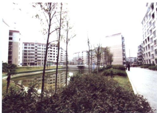
居民住宅小区—如意山庄