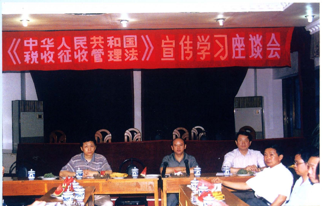
2001年7月23日州国家税务局和州地方税务局联合召开学习《中华人民共和国税收征收管理法》座谈会。