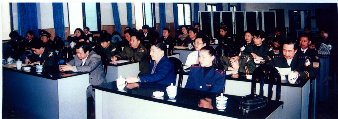
1998年3月20日州地方税务局对全州公安干警进行税法知识培训学习。