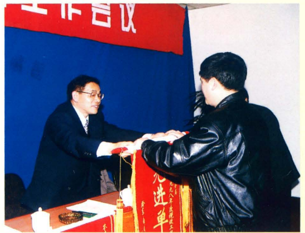
副州长杨东胜为荣获1998年度税收工作先进单位的凯里市地方税务局颁奖。