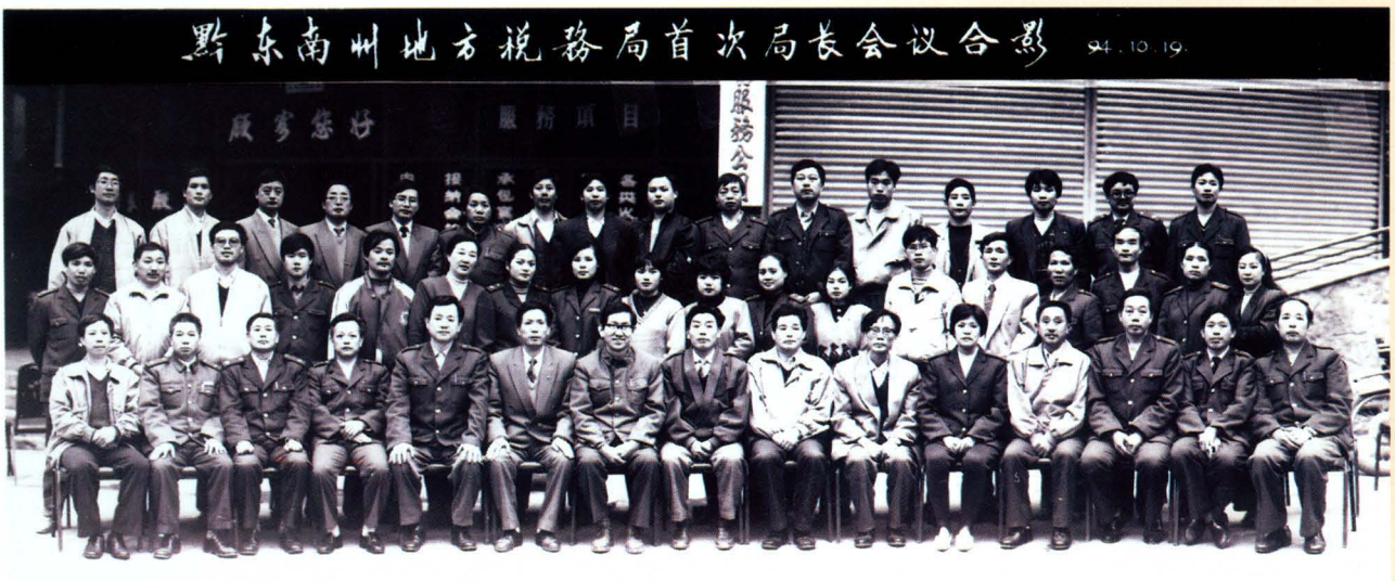
1994年地税机构分设，全州地税系统第一次局长会议与会人员合影。