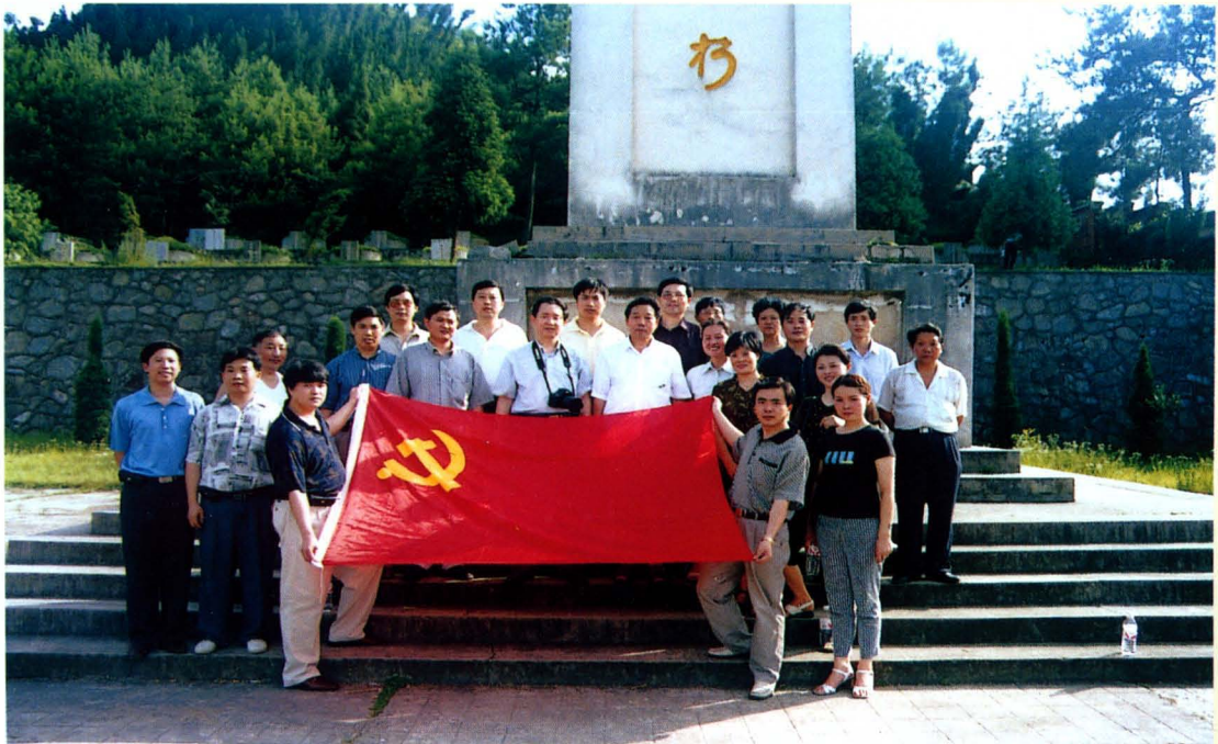
2001年6月9日中共黔东南州地方税务局党支部在凯里市金泉湖烈士陵园开展重温入党誓词活动。