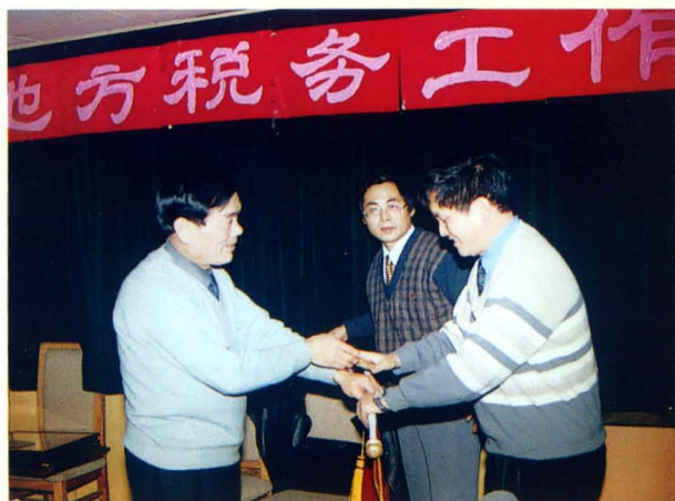
副州长邓锦洲（左一）为荣获1999年度地方税务工作先进单位颁奖。