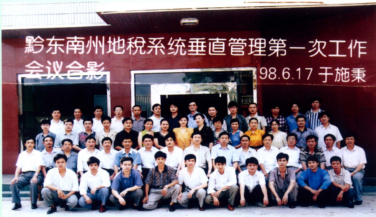
1998年6月16日州地税系统在施秉县召开垂直管理工作会议，图为与会人员合影。