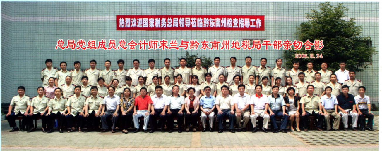
2006年8月24日国家税务总局党组成员总会计师宋兰（前排中）到黔东南州检查指导工作并与黔东南州地税局干部亲切合影。