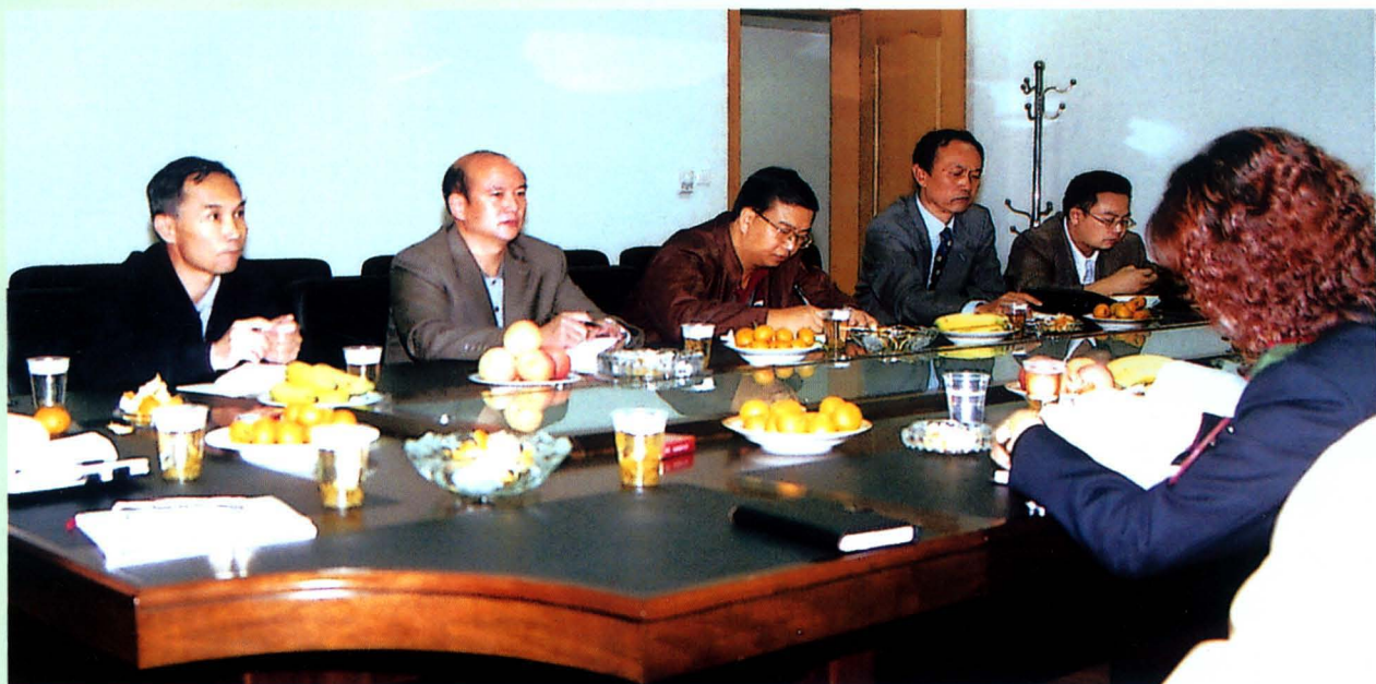
2004年12月州长刘晓凯（左三）、副州长龚绍涛（左二）在州地方税务局指导工作。