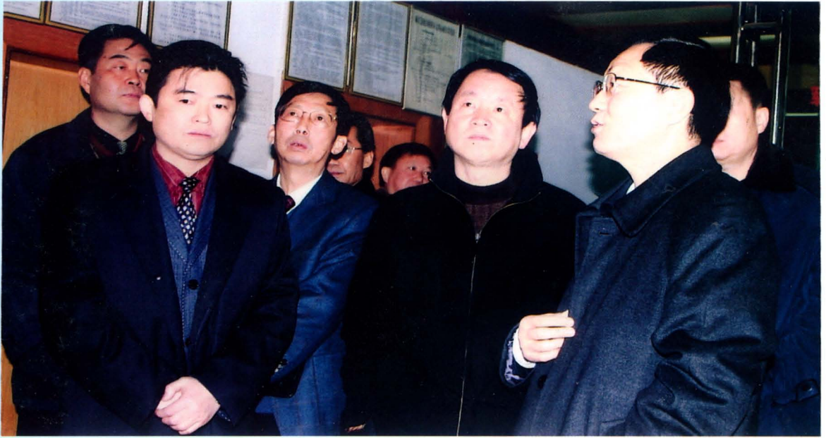
2006年1月25日国家税务总局局长谢旭人（前排右一）来到麻江县地方税务局看望和慰问干部职工，州地方税务局局长戴传江（前排右三）、党组书记李效明（前排中）陪同。