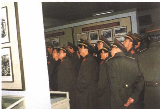
检察干部参观 116 师荣誉室

1994年3月7日,鞍山市人民检察院副处级以上干部一行60余人到中国人民解放军驻海城部队116师参观学习