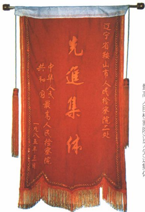
1985年，市检察院二处被 最高人民检察院评为先进集体