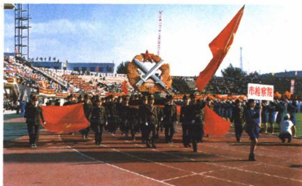
1994年在市直机关运动会入场式上