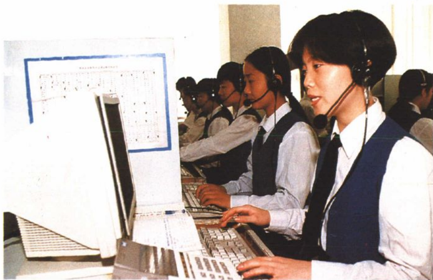
双剑通讯公司的传呼小姐正在工作

为了配备现代化的通讯设备,提高办案效率,解决办案资金不足,改善干警待遇,市检察院劳动服务公司先后创办了鞍山市双剑通讯公司等企业