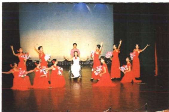
1989年在庆祝建国四十周年时的文艺表演