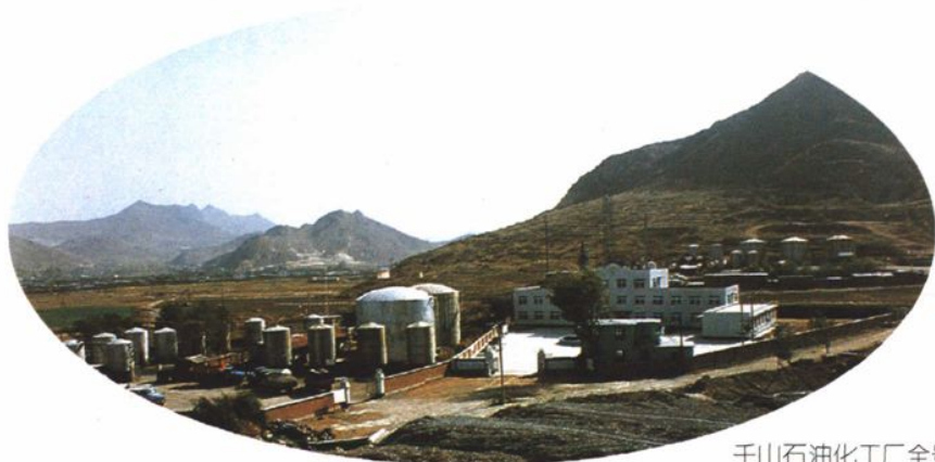
千山石油化工厂全景