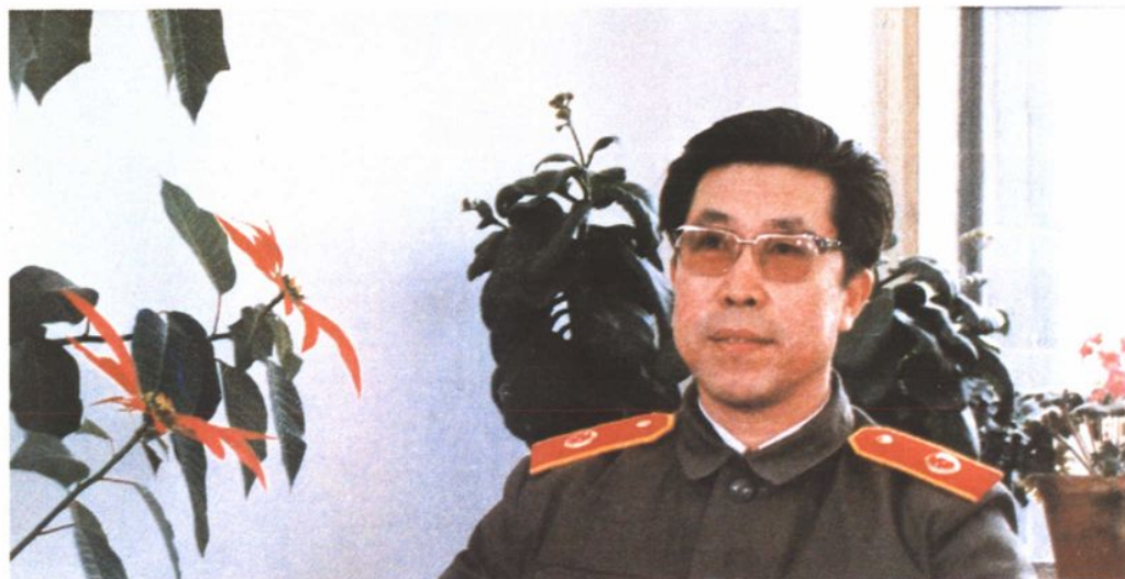
屈润芳 1992年至今 重新出任鞍 山市人民检 察院检察长