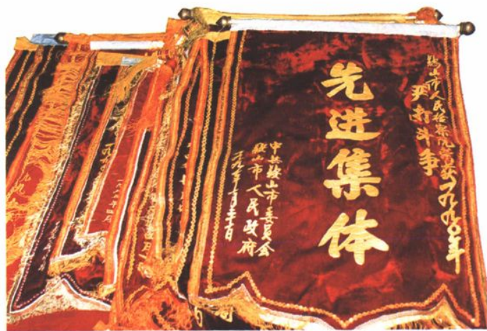
自1978年检察机关重建以来，市检察院在各项工作中取得突出成绩，多次获得各种表彰和奖励。图为部分获奖锦旗和奖杯