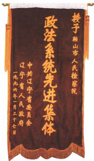
1995年度，市检察院被辽 宁省委、省政府评为政法系统 先进集体