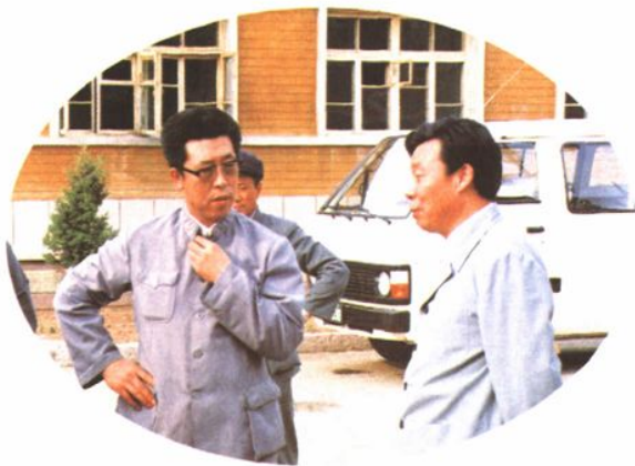
1986年，最高人民检察院副检察长王晓光来鞍检查乡镇检察室工作，图为王晓光副检察长（右）与市院屈润芳检察长交谈