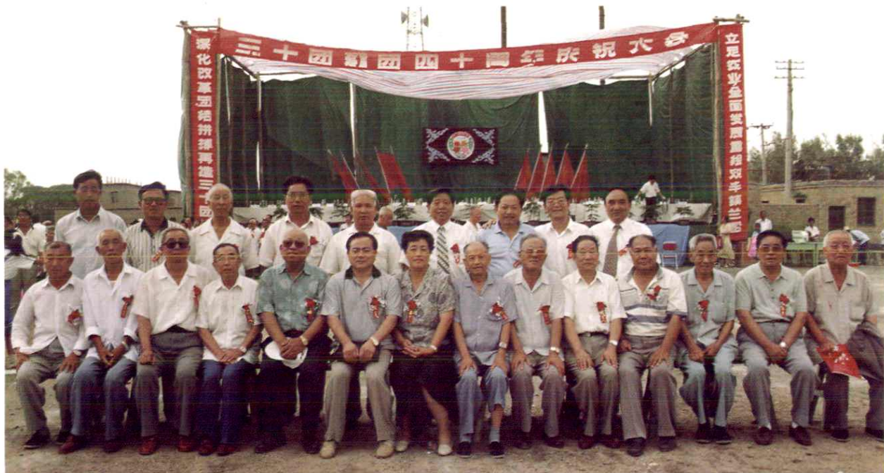
新老领导欢聚一堂