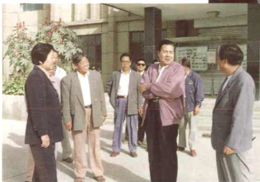
兵团金云辉司令员慰问三十团干部职工