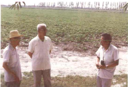
自治区政协副主席赵干卿及兵团司令员刘双全视察三十团农业生产