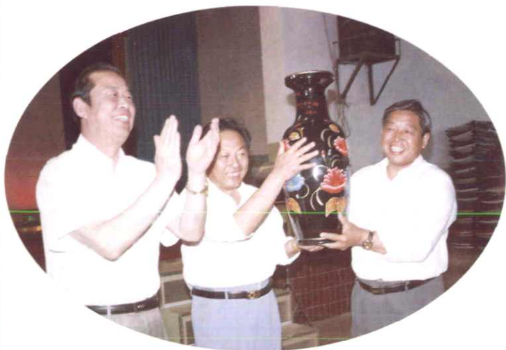
兵团副政委王贵振代表兵团党委向三十团双丰镇儿童文化园赠送礼品