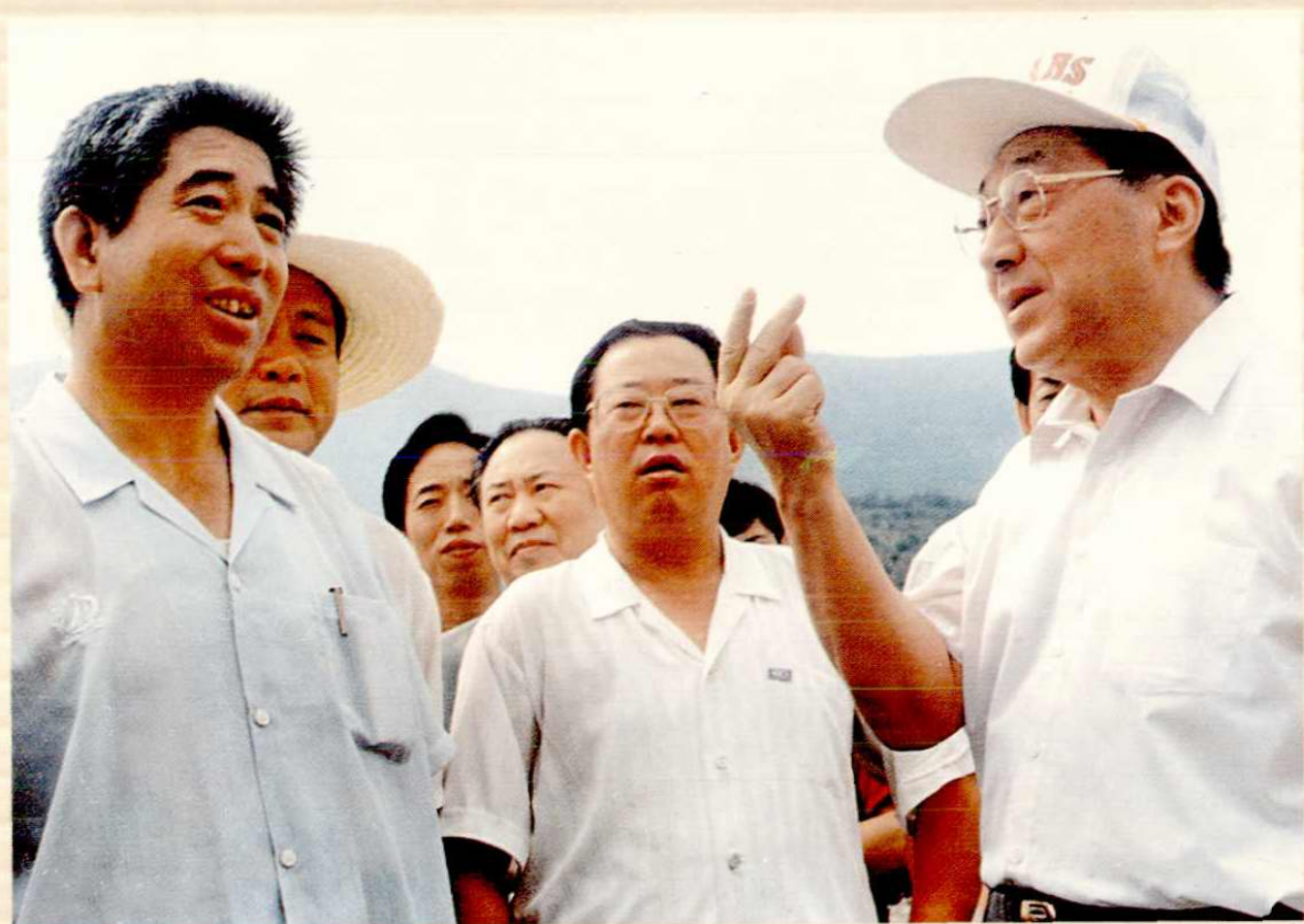
● 1996年7月4日，中共中央政治局委员、国务院副总理李岚清莅临理家庄村视察。