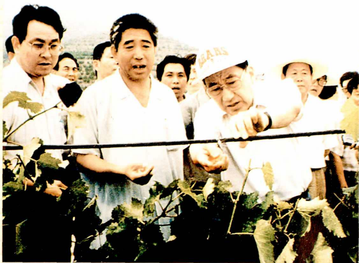
● 国务院副总理李岚清在双千亩果园视察