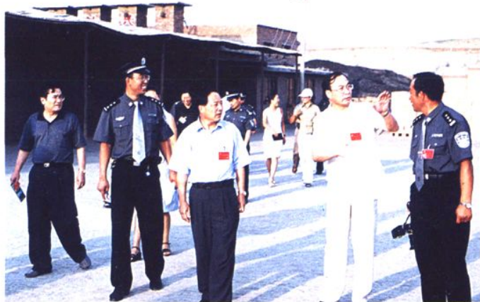
2001年8月15~16日，第13次全国司法外事工作座谈会在锡林浩特召开。会议期间，司法部副部长范方平（左三）和自治区副主席牛玉儒（右二）视察锡林郭勒盟劳教所