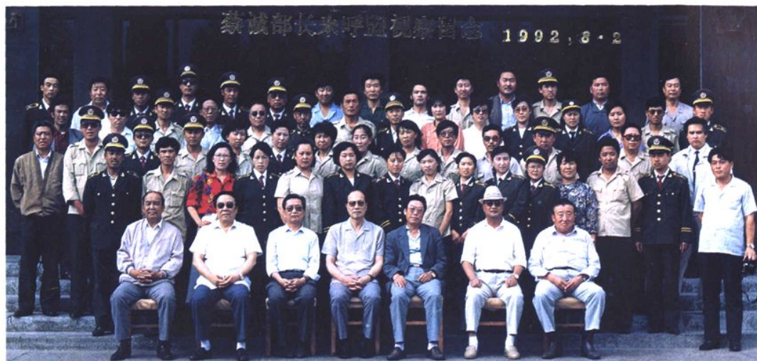
1992年8月2日，司法部部长蔡诚（前排左四）视察海拉尔劳教所并与民警合影

2002年12月3日，自治区党委书记储波（右一）视察司法行政工作。图为储波书记接见司法厅领导成员