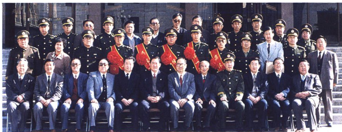
1996年10月22~23日，司法部在呼和浩特召开乌海市劳教所荣记集体一等功庆功大会。司法部副部长肖建章（前排左六），自治区副主席云布龙（前排左七），自治区党委常委、政法委书记万继生（前排左五）到会并和与会人员合影