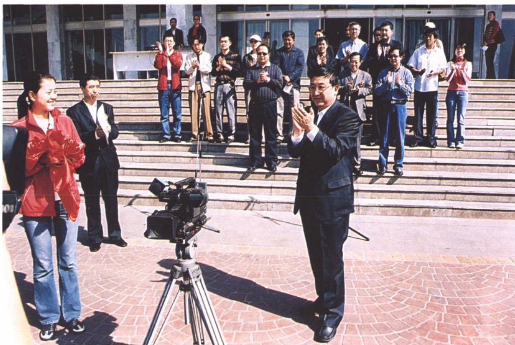
2005年5月20日，自治区司法厅、内蒙古电视台举行“法律援助在行动” 大型节目开播仪式