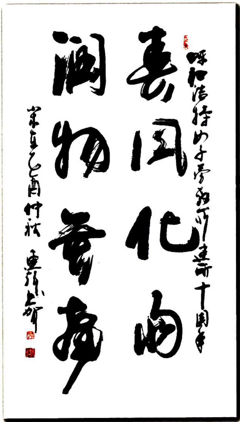
2005年，内蒙古自治区副主席连辑题词