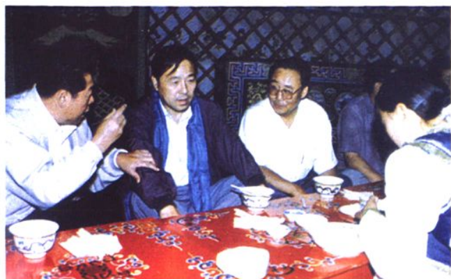
2002年10月，司法部部长张福森（左二），在自治区人大副主任王凤岐（左一）、乌兰察布盟盟长赵世亮（左三）的陪同下向牧民群众了解普法工作情况