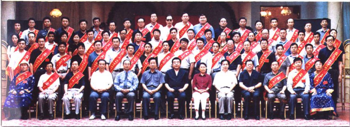
2001年7月9~10日，自治区党委、政府在呼和浩特召开全区依法治区工作会议。自治区党委书记刘明祖（前排左七）、自治区主席乌云其木格（前排左八）以及其他领导同志接见“三五”普法依法治理先进集体先进个人代表