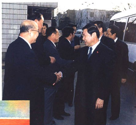
自治区党委书记储波（左）慰问自治区第一监狱离休干部

2002年12月3日，自治区党委书记储波（右一）视察司法行政工作。图为储波书记接见司法厅领导成员