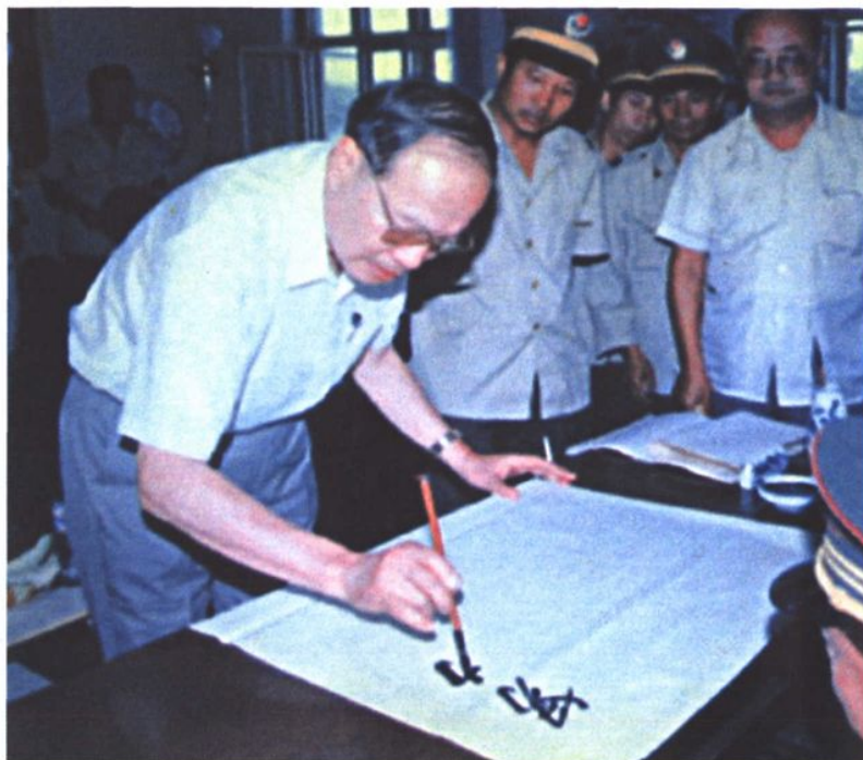
1991年8月16日，司法部部长蔡诚视察 自治区监狱