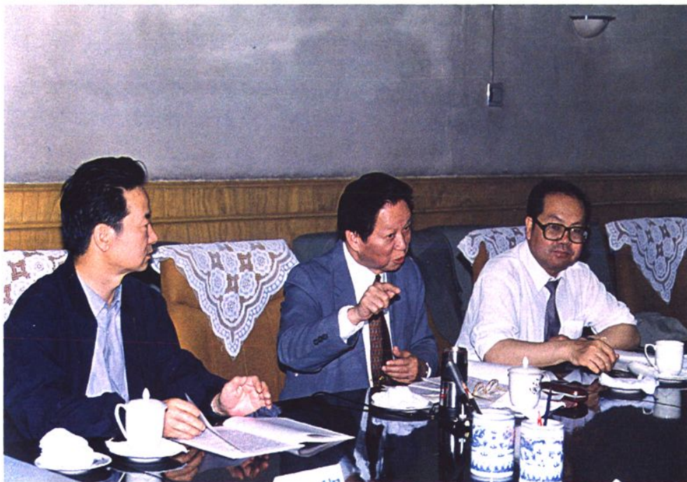
1997年5月19~24日，司法部部长肖扬（中）在自治区调研司法行政工作时，与自治区党委副书记云布龙（右），自治区党委常委、政法委书记万继生（左）在一起交谈