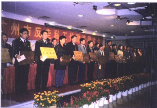
2000年1月市政府召开反走私工作会议表彰反走私先进集体和人员