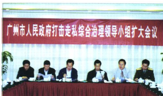
2004年市打击走私综合治理领导小组召开会议部署反走私综合治理工作