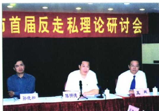
2004年11月市打私办举办首届反走私理论研讨会