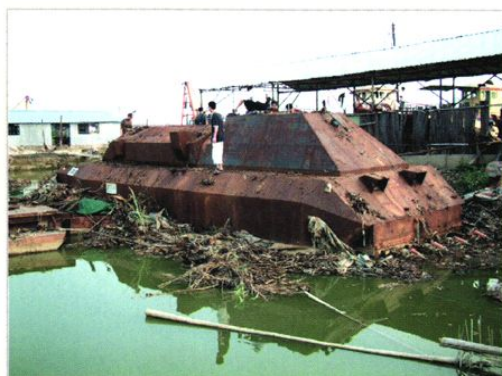
广州市打私办、广州海关联合查获的 装载走私汽车的“铁甲飞艇”