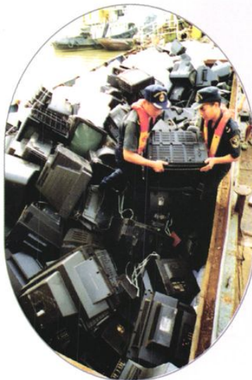
查缉走私废旧家电