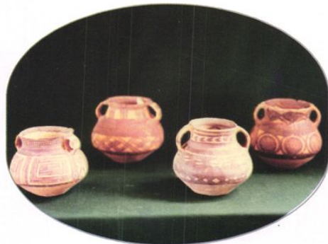
我市缉私部门查获的部分走私文物（陶罐）