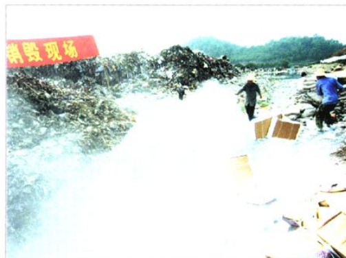
番禺区销毁走私冻肉现场