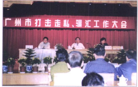
1998年11月市政府召开打击走私、骗汇工作会议