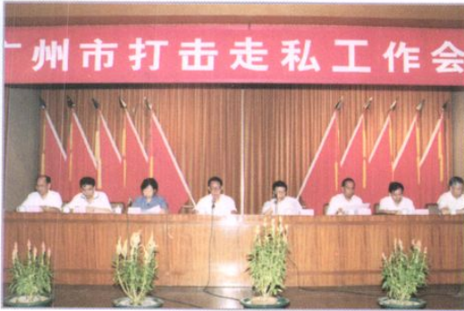
1998年8月市政府召开打击走私工作会议