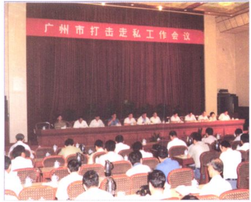
1995年9月广州市召开打击走私工作会议