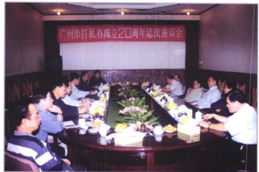
2001年4月市打私办成立20周年座谈会