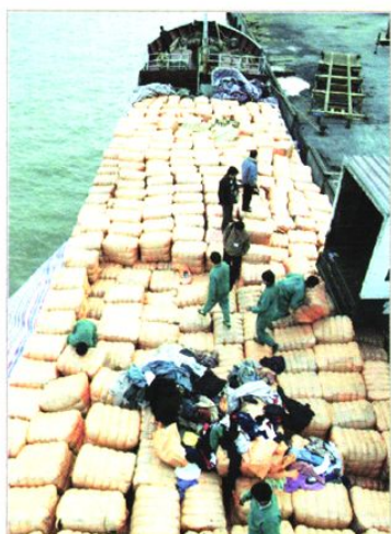
查缉走私废旧衣物