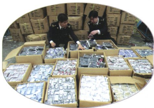
查缉侵犯知识产权走私商品