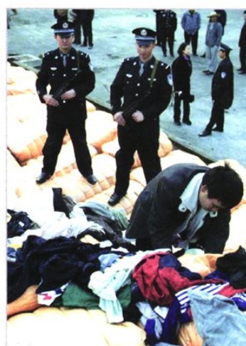
缉私警察当场抓获走私犯罪嫌疑人