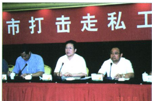
2003年9月广州市打击走私工作会议