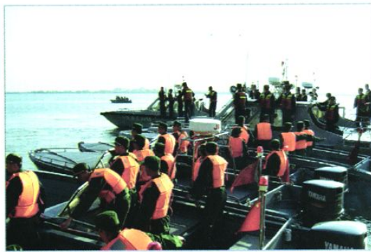
缉私战士整装待发