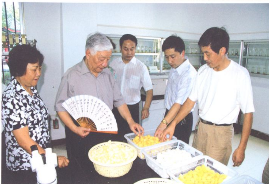
九届全国政协副主席王文元来校指导工作