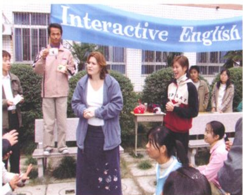
外籍教师开展语言交流活动