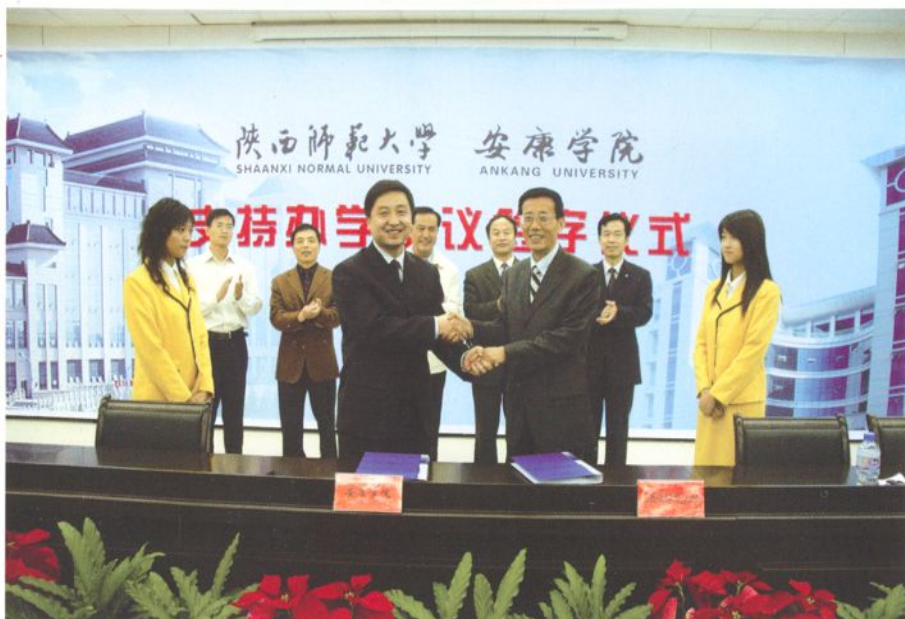
党委书记杨涛与陕西师范大学党委书记江秀乐签订支持办学协议