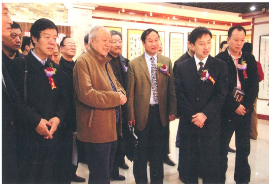
省决策咨询委员会主任、原省人大常务副主任、常务副省长徐山林来校指导工作