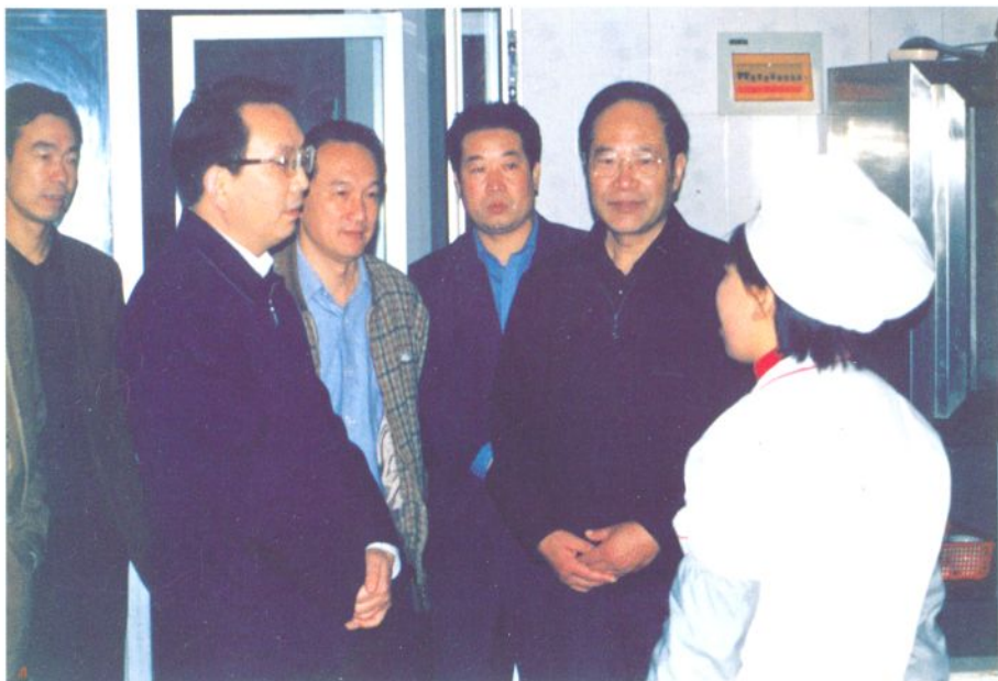
省委常委、省纪委书记郭永平来校检查工作