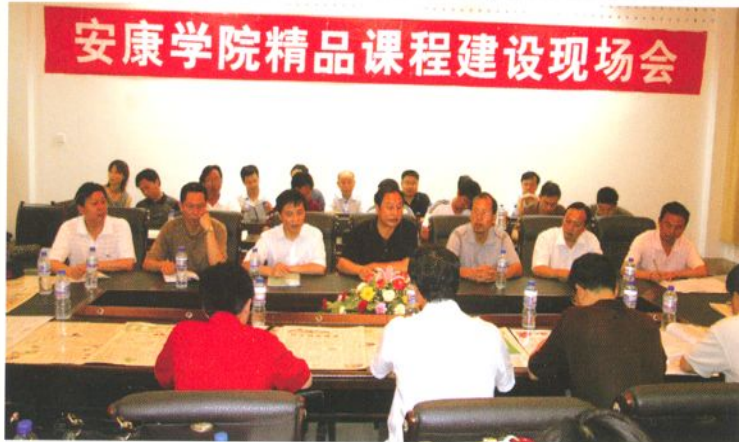
我院召开精品课程建设现场会