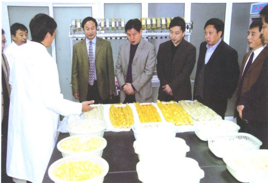
省教育厅厅长杨希文来校检查工作