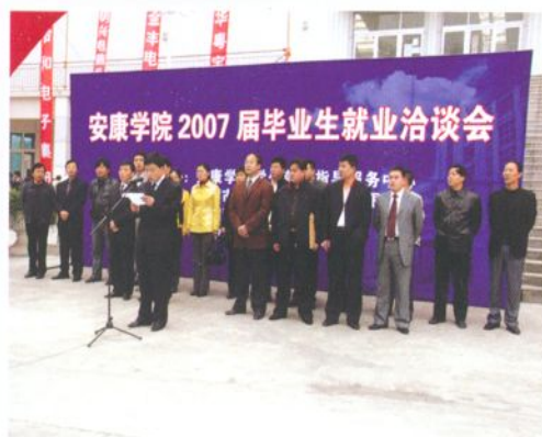
学院定期举办毕业生就业洽谈会