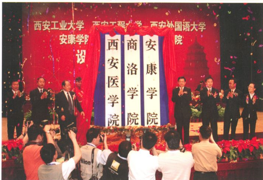
省长陈德铭、省委副书记杨永茂为学院揭牌