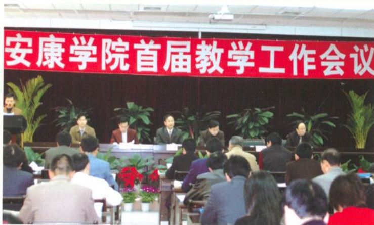
我院召开首届教学工作会议