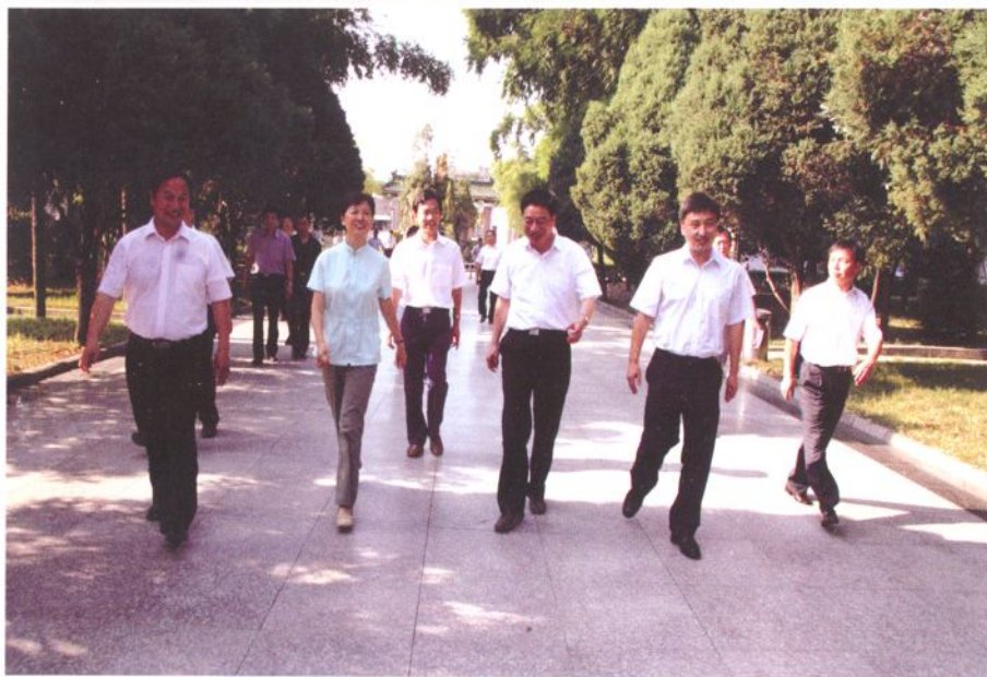
省委副书记、省委教育工委书记王侠来校指导工作