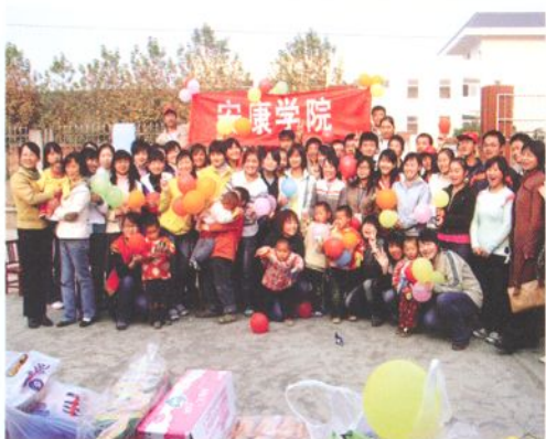
学生深入儿童福利院与孩子们在一起