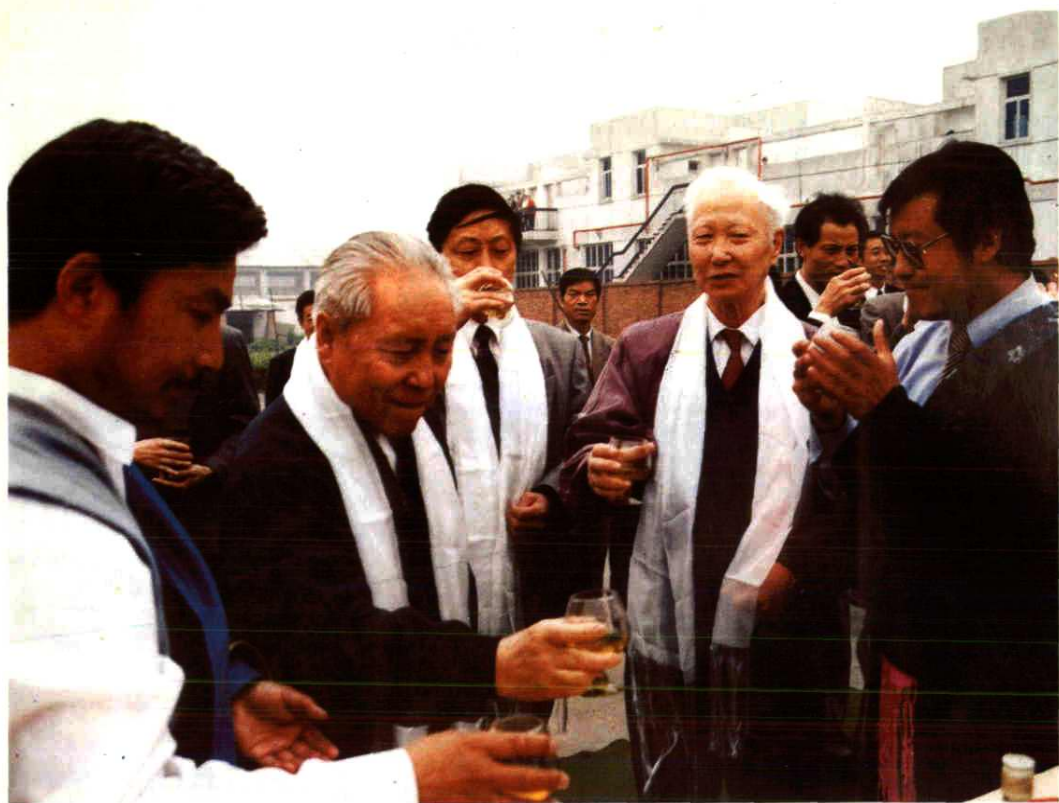
▲ 全国政协副主席，原中共四川省委书记杨汝岱（左二）在冰山饮料厂视察。左一壤塘县县长华拥军。右一共壤塘县委书记王树升。