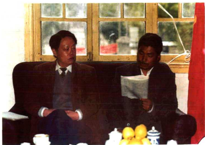
▲ 国家卫生部副部长殷大奎（左一）在视察壤塘县时与县长华拥军交谈。