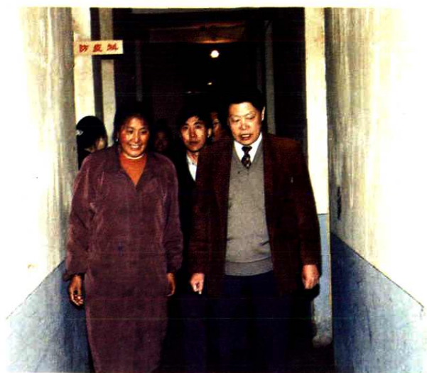
◀ 国家卫生部专家调查组在壤塘县调查