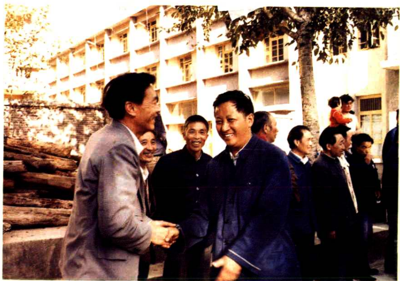
▲ 四川省人民政府省长蒋明宽(前排右)在壤塘县视察